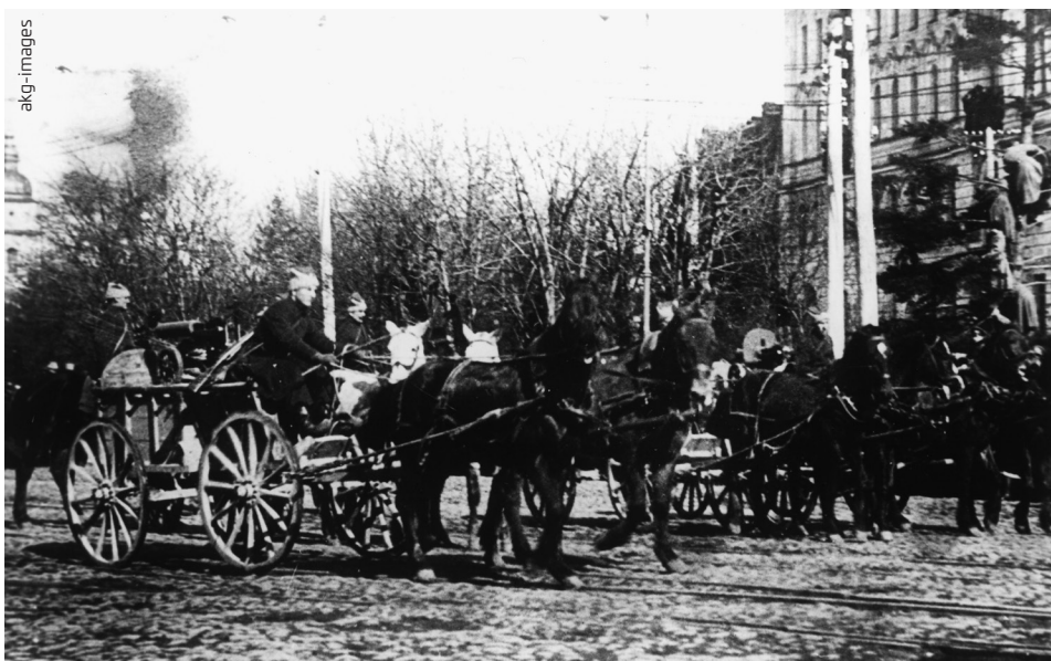
Rückeroberung von Kiew durch die Rote Armee, Juni 1920.