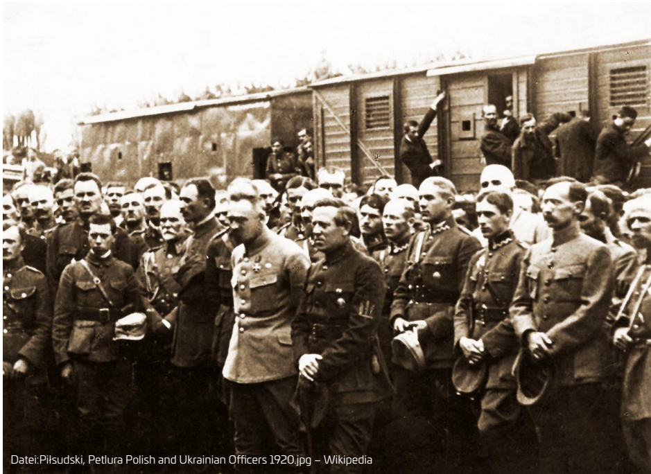
Datei:Piłsudski, Petljura Polish and Ukrainian Officers 1920.jpg

Mit Unterstützung des polnischen Staatschefs Józef Piłsudski versuchte der von den Mittelmächten anerkannte Präsident Symon Petljura, die Ukraine Volksrepublik wiederherzustellen. Hier sind Piłsudski und Petljura gemeinsam mit ukrainischen Offizieren zu sehen, 5. September 1920 (Adam Szelągowski »Wiek XX«, Warszawa 1937).