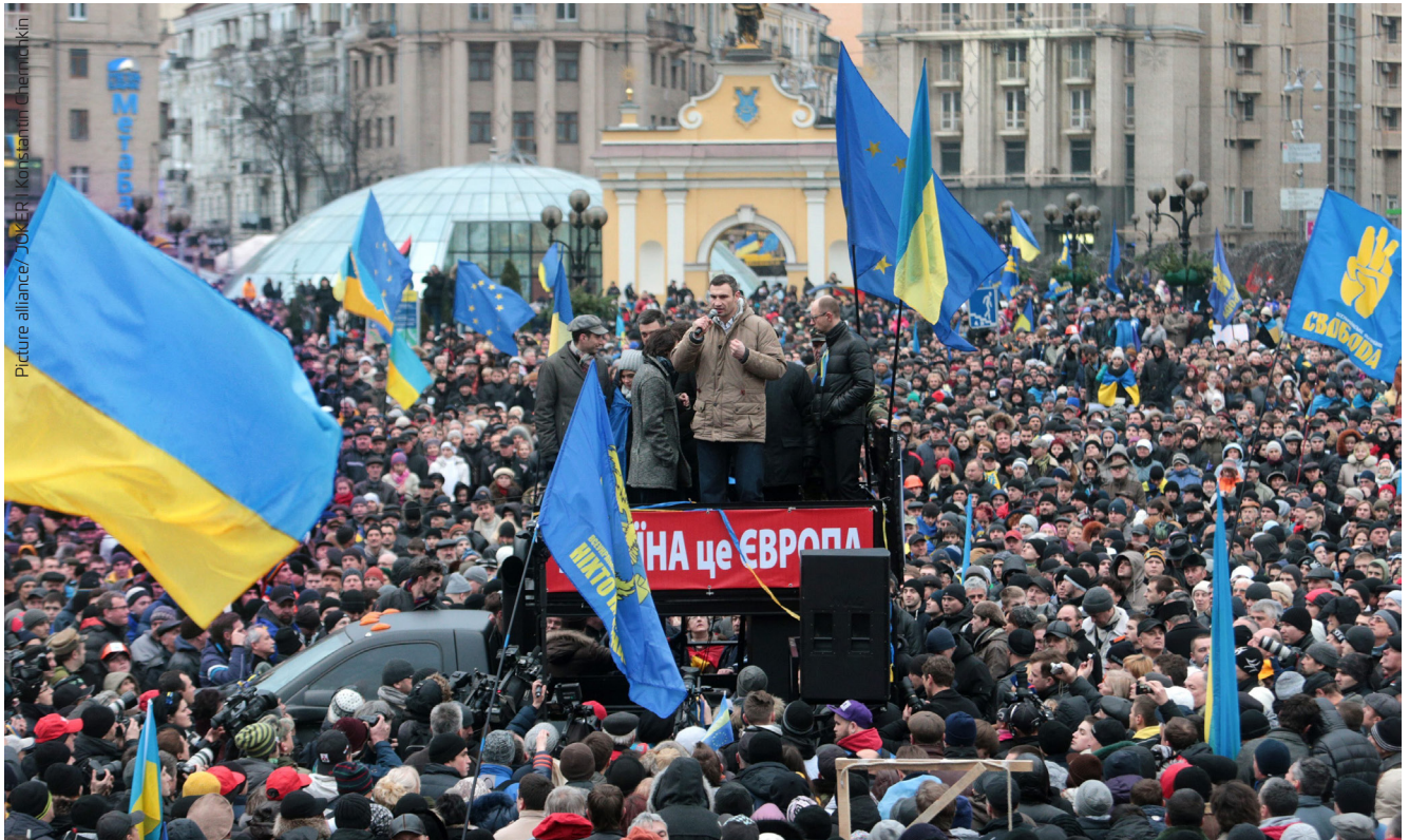
Pro-EU-Demonstration: Tausende gehen im Dezember 2013 in Kiew gegen die Politik von Präsident Janukowytsh auf die Straße. Der heutige Bürgermeister Kiews Vitali Klitschko spricht zu den Demonstranten.

der Ukraine von Russland sowie in weiteren politisch und wirtschaftlich relevanten Bereichen. Daran konnten Handelsabkommen sowie ein 1997 unterzeichneter Freundschafts- und Kooperationsvertrag nichts ändern. Gleichzeitig begann sich die Ukraine dem Westen und seit 1997 auch der NATO anzunähern. 1999 wurde der Beitritt zur EU zum Staatsziel erklärt. Dies stieß bei Putin auf Ablehnung, der Russlands Einfluss im Raum der Gemeinschaft Unabhängiger Staaten (GUS: Verbindung von elf souveränen Staaten, die Teil der UdSSR waren) wiederherstellen wollte. Moskau mischte sich daher in die 2004 stattfindenden Präsidentschaftswahlen der Ukraine ein, wie es aber auch die EU und die USA als Gegenpart zu Russland praktizierten. Ein Ergebnis war die sogenannte Orangene Revolution, eine politische Spaltung der Ukraine und das