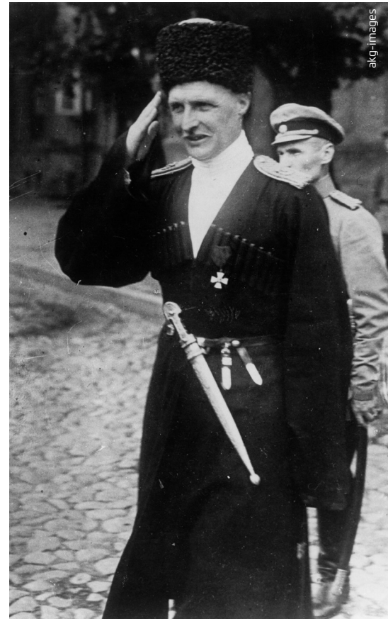
Pawlo Skoropadskyj nimmt als vom Deutschen Kaiserreich gestützter Hetman eine Parade ab, 1918.

Der neu geschaffene Staat sah sich mit zahlreichen Problemen und Hindernissen konfrontiert. Dabei spielten ideologische und politische Gegensätze eine Rolle, die nicht nur linke und rechte Politiker trennten, sondern auch die unterschiedlichen Herkunftskulturen widerspiegelten. Gefährlicher war aber, dass sich die UNR im Bürgerkrieg neben bolschewistischen Eroberungsversuchen auch deren »weißgardistischen« Gegnern sowie anarchistischen und marodierenden Gruppen zu erwehren hatte. Dazu mussten rumänische und polnische Versuche, das Territorium ihrer Staaten auf Kosten der UNR zu erweitern, unterbunden werden. Auf der Friedenskonferenz von Paris wurde 1919 mit