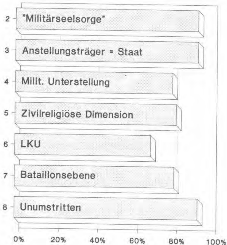
Graphik 2: Religionsausübung in Streitkräften, weltweit: Stärkste Ausprägung: Standardmodell

Auf diese Weise läßt sich ein fiktives "Standardmodell" beschreiben, das folgendes Profil aufweist: