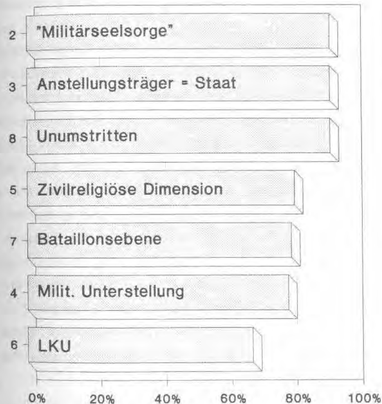
Graphik 3: Religionsausübung in Streitkräften, weltweit: Abweichungen vom Standardmodell nach Kategorien