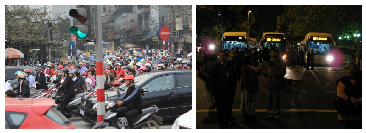
Bild 2: Dichter Verkehr in Hanoi (links). Eröffnung des Transantiago-Systems (rechts).