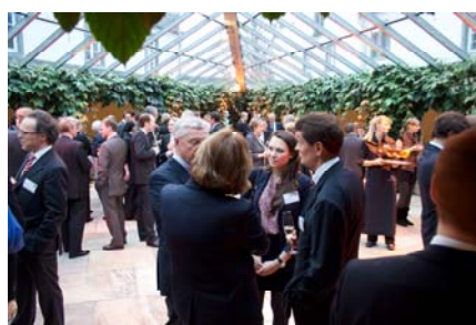
Sektempfang auf Klostergut Besselich