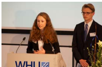
Eröffnung durch das studentische Organisationsteam