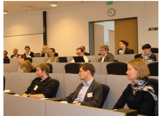
Während einer Artikel-Präsentation

Neben der Präsentation von Artikeln nutzten die Forscher im Rahmen der Konferenz die Gelegenheit, aktuelle Forschungsprojekte durch Kommentare und Diskussionen im Plenum weiterzuentwickeln. Ausgewählte Artikel dieser Konferenz werden in einem Special Issue der topgerankten Zeitschrift Entrepreneurship Theory & Practice veröffentlicht, um so Familienunternehmen als ein eigenständiges Forschungsfeld weiter zu etablieren.