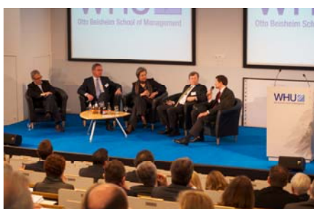
Podiumsdiskussion: Tradition vs. Innovation — ein Generationenkonflikt?