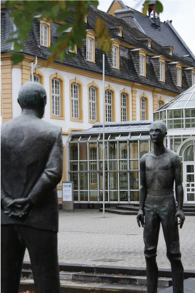
Die Stiftung WHU ist Träger der WHU – Otto Beisheim School of Management WHU – Otto Beisheim School of Management is the Business School of the WHU Foundation