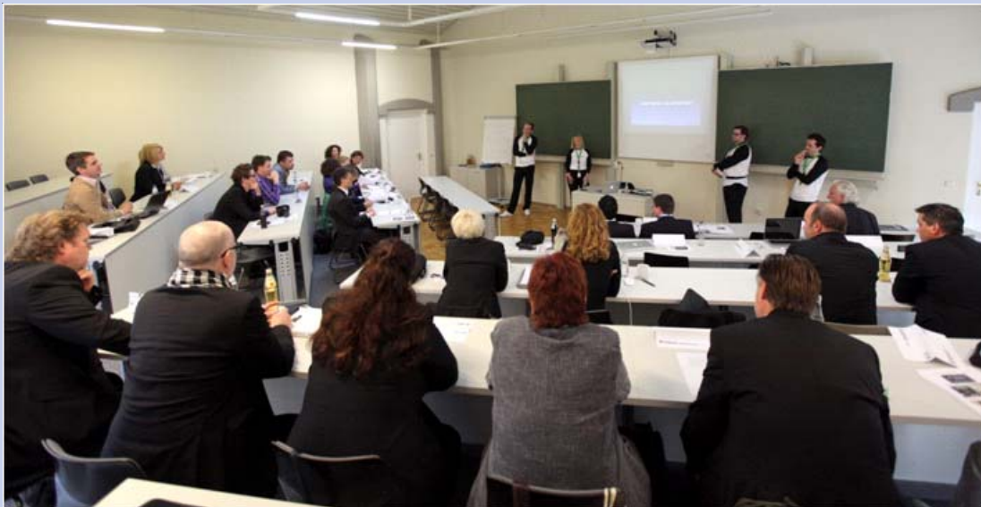
Eine Veranstaltung aus dem LUMEA-Programm