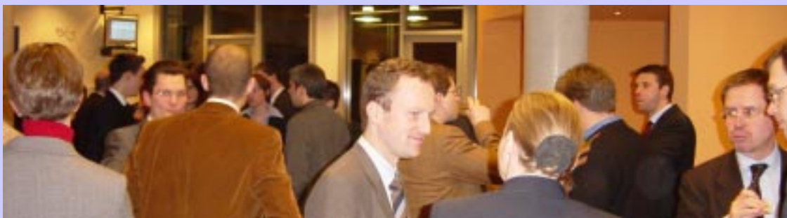
Die Gäste der Antrittsvorlesung beim Sektempfang im Foyer des Neubaus der WHU

Im Anschluß an die Vorlesung wurden die Gäste zum Sektempfang im Foyer des Neubaus der WHU geladen. Dort ergaben sich Möglichkeiten zur interdisziplinären wissenschaftlichen und wissenschaftsübergreifenden Diskussion.