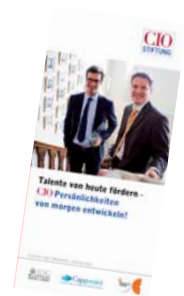
Sonderpublikation der CIO Stiftung

Die globalen Beziehungen in der Management-Weiterbildung sichtbar zu machen, erfordert mehr als entsprechende Lehrinhalte und ausländische Dozenten. In der Management-Weiterbildung lernen Kursteilnehmer auch viel voneinander. Deshalb sollten Teilnehmergruppen nach beruflichem