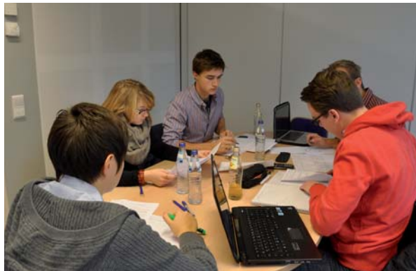
oben: WHU-Doktoranden unten: Planspiel anlässlich der Schülerakademie