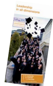
Sonderpublikation der Kellogg/WHU Executive MBA Stiftung