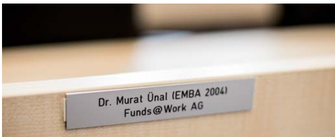
WHU-Gebäude Schwanenhöfe nach Fertigstellung der Umbauarbeiten Beispiel einer Namensplakette eines Stuhlsponsors