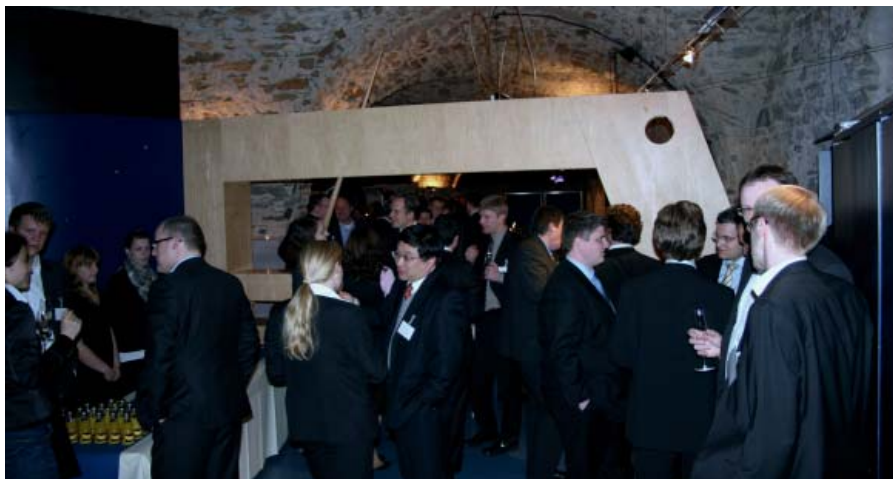
Sektempfang im Gewölbekeller