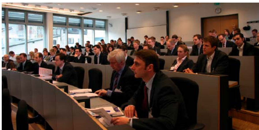
Plenum Controllertagung Vallendar