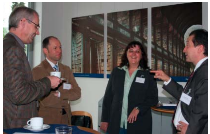
InPraxi Treffen März und September 2009