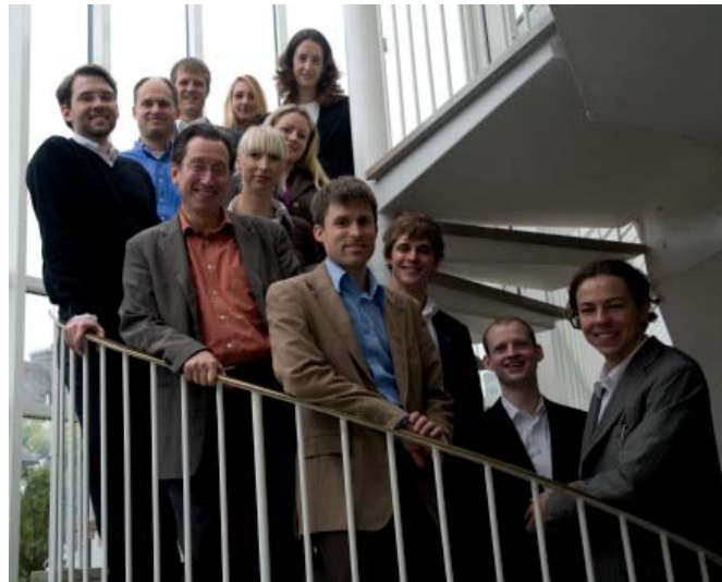
Das Team des CCM

Als ein wesentliches Ergebnis der Studie „Controlling und Human Resources“ zeigt sich, dass das Zentralcontrolling in vielen Großunternehmen die Rolle einer „Kaderschmiede“ für den Führungsnachwuchs spielt. Dabei führt die zunehmend verbreitete Rolle des Controllers als interner Berater zu erhöhten Ansprüchen an die Sozial- und Führungskompetenz. Wenn Controller die Möglichkeit haben, auch in anderen Finanzfunktionen oder Unternehmensbereichen Erfahrung zu sammeln, erhöhen sich ihre Chancen auf eine Managementkarriere.