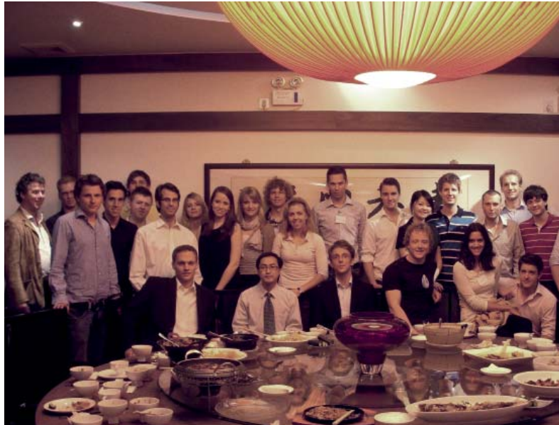
Kursteilnehmer Perflussdelta und Alumni beim gemeinsamen Abendessen

chen die Möglichkeit, Arbeiten und Leben in China hautnah zu erfahren. Ergänzt wurde das Programm durch einen Ausflug der Studenten mit Alumni der WHU, die in China leben und arbeiten. Beim gemeinsamen Abendessen in der Gartenstadt Suzhou unweit von Shanghai hatten die über 70 Teilnehmer die Gelegenheit, Erfahrungen auszutauschen und Perspektiven zu diskutieren.