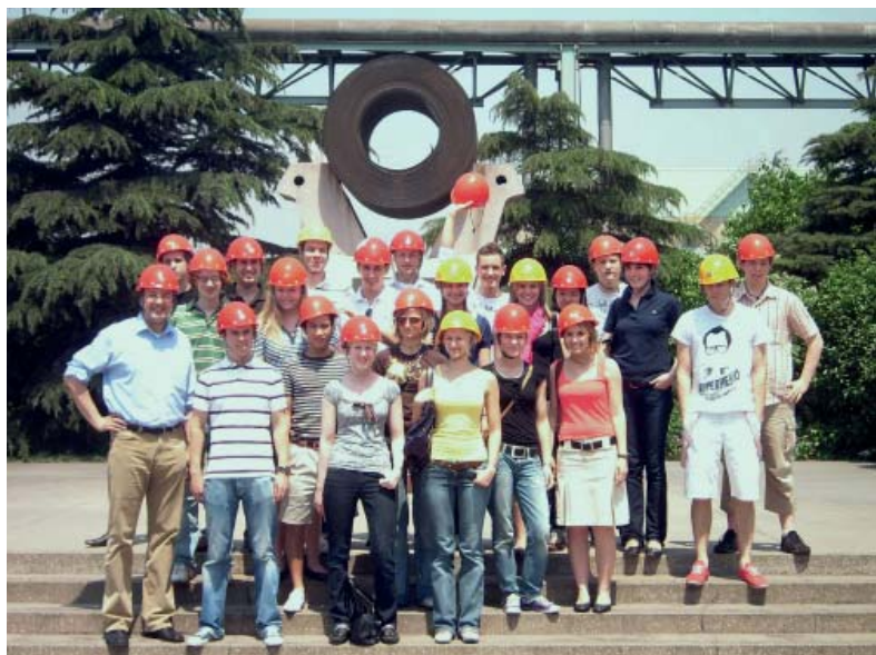
Kursteilnehmer Shanghai bei der Besichtigung der Stahlwerke BAO-STEEL