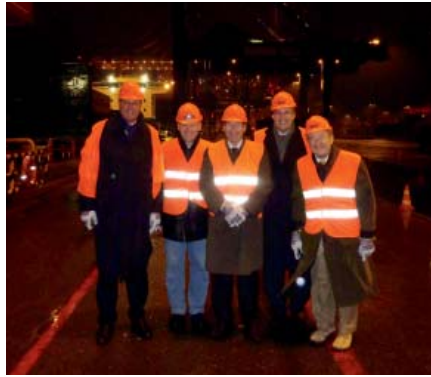
Mitglieder des ICV-Kuratoriums in Bremen