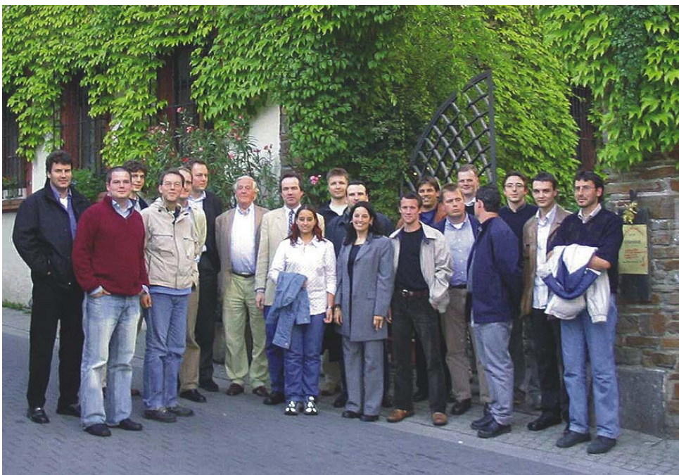
Beim Kennenlernen in Winnigen