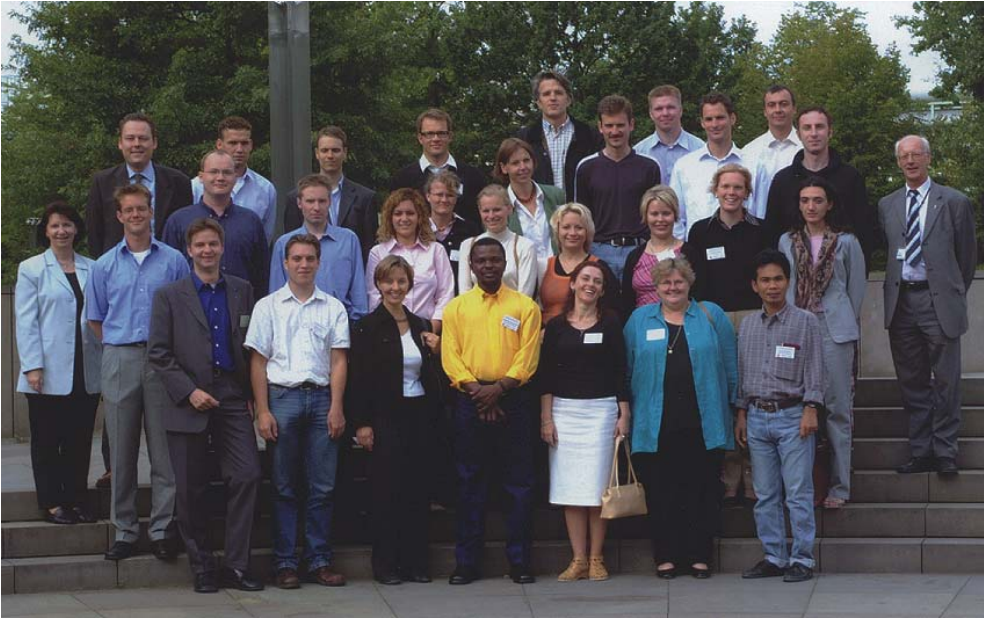
Gruppenfoto bei Bayer während der Exkursion

Kundeneinbindung in den Innovationsprozess. Er wies darauf hin, dass in vielen Publikationen die Kundeneinbindung uneingeschränkt positiv beurteilt wird, dass jedoch für derlei ungetrübten Optimismus wenig Anlass besteht. Es gibt noch eine Reihe ungelöster Probleme, die schon bei der Definition des Kunden anfangen (Großhändler? Endkunde?) und auch bei der Identifikation der „richtigen“ Kunden nicht enden.