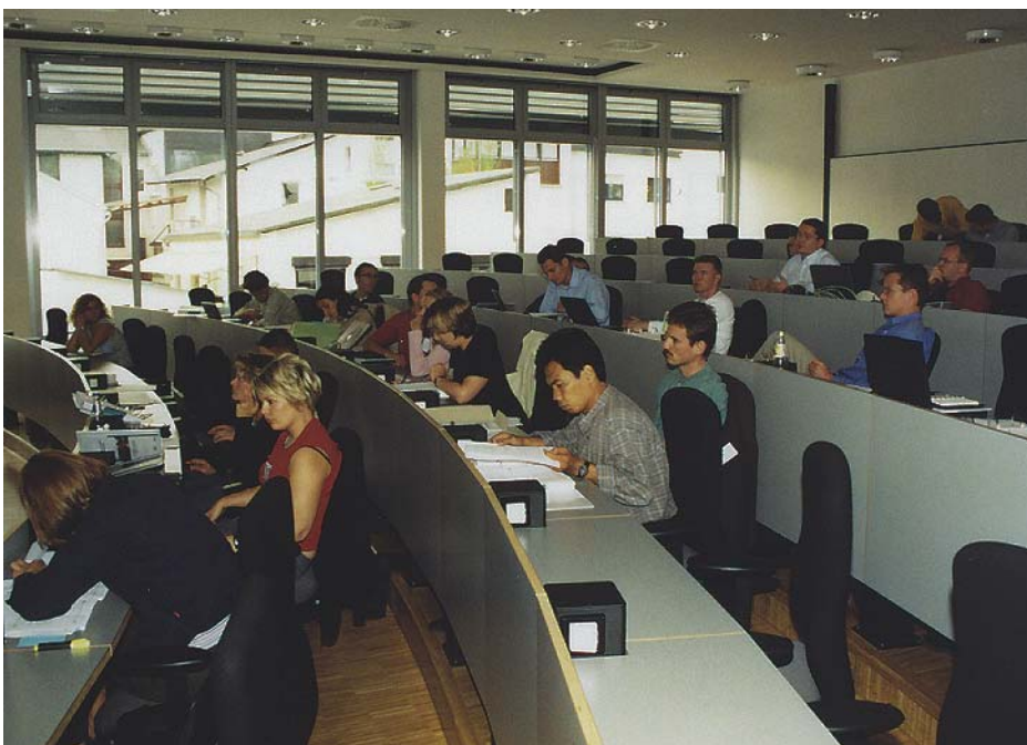
Ein Blick in den Hörsaal: Die Teilnehmer bei einer der täglichen Sessions