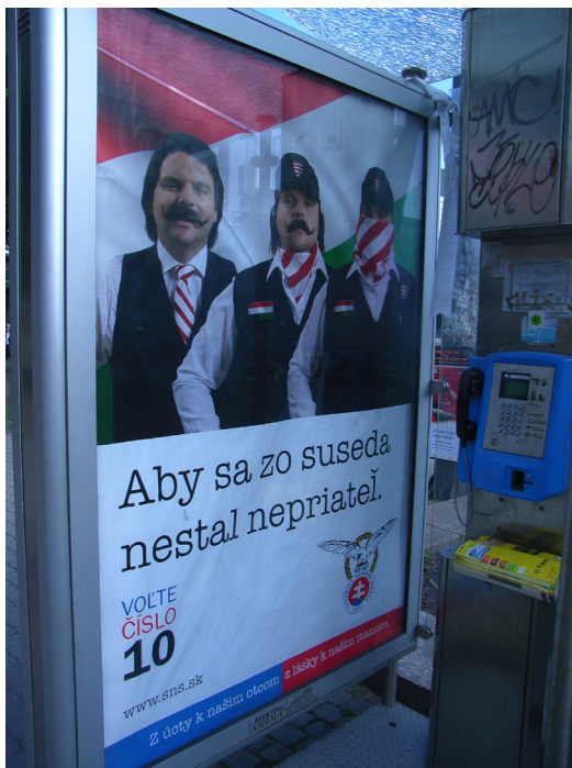
Grafik 2: Plakat der Slowakischen Nationalpartei (Slowakisch: Slovenská Národná Strana) im Wahlkampf 2010 (Wahlen zum slowakischen Parlament). Text: „Damit der Nachbar nicht zum Feind wird“ (Slowakisch: „Aby sa zo suseda nestal nepriateľ“).