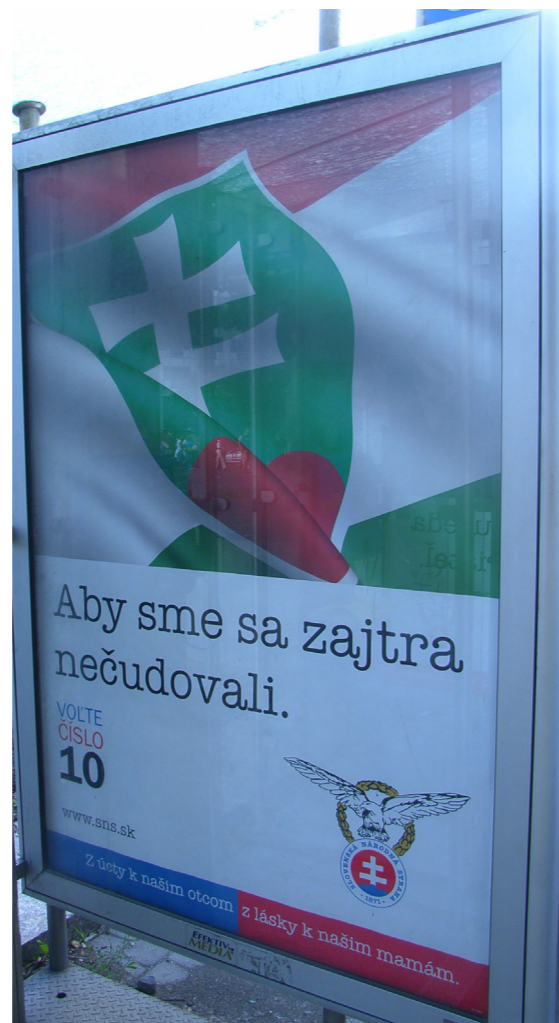
Grafik 3: Plakat der Slowakischen Nationalpartei (Slowakisch: Slovenská Národná Strana) im Wahlkampf 2010 (Wahlen zum slowakischen Parlament). Text: „Damit wir uns morgen nicht wundern.“ (Slowakisch: „Aby sme sa zajtra nečudovali.“).