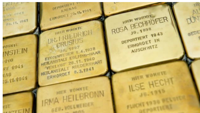
Abbildung 1: Symbolbild Stolpersteine 1