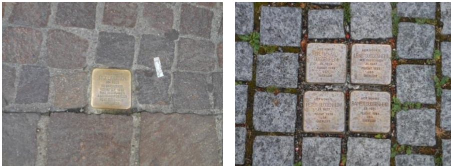
Abbildung 2: Stolperstein Wessenbergstraße (links) und Stolpersteine Sigismundstraße (rechts) 11

Einen weiteren wichtigen Grund für die Auswahl dieser beiden Gedenkstätten stellte die unterschiedliche Bodenbeschaffenheit dar. Zwar ist fast überall in der Konstanzer Altstadt Kopfsteinpflaster verlegt, wie auch in den beiden ausgewählten Straßen, allerdings unterscheidet sich die Farbe der Pflastersteine, wie auf den beiden Bildern in Abbildung 2 zu erkennen ist.