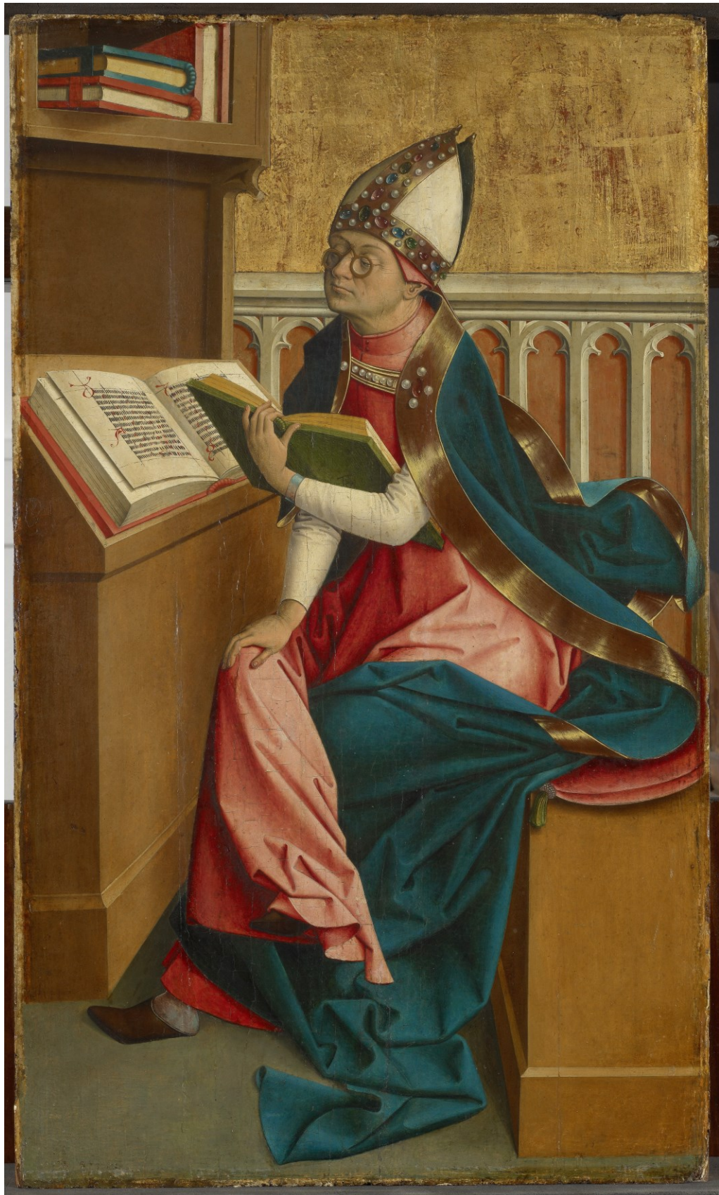
Kirchenvater Augustinus, 1498, Wien/Österreichische Galerie Belvedere