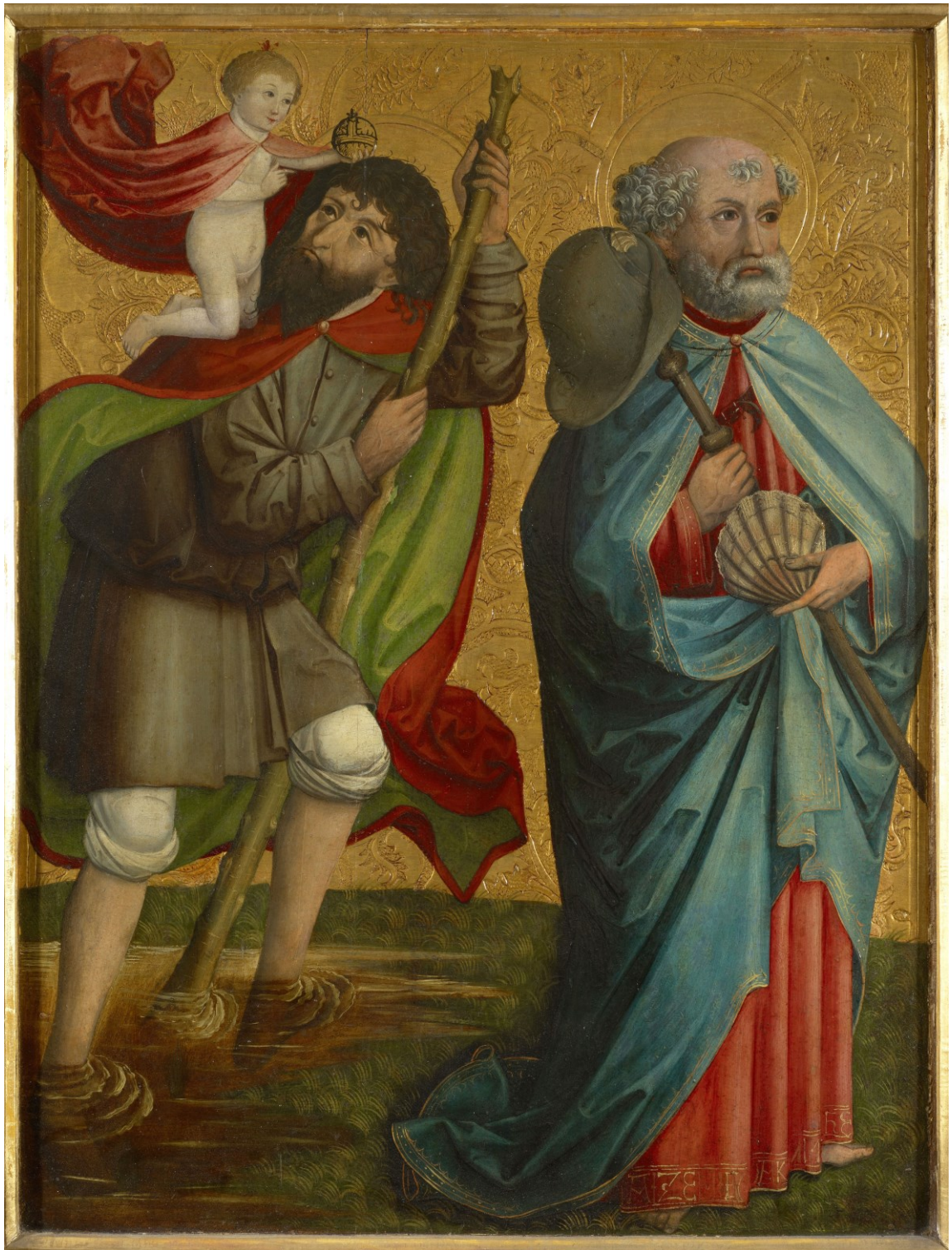
Heiliger Christophorus und Heiliger Jacobus Major, Flügel des Pretschlaipfer-Triptychons, Feiertagsseite, 1473/1486, Wien/Österreichische Galerie Belvedere