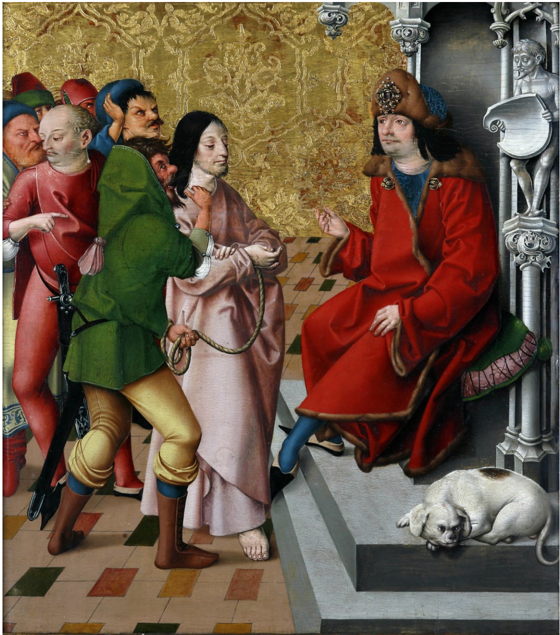
Christus vor Pilatus, Tafel des Passionsaltars, 1470/1510, Regensburg/Historisches Museum