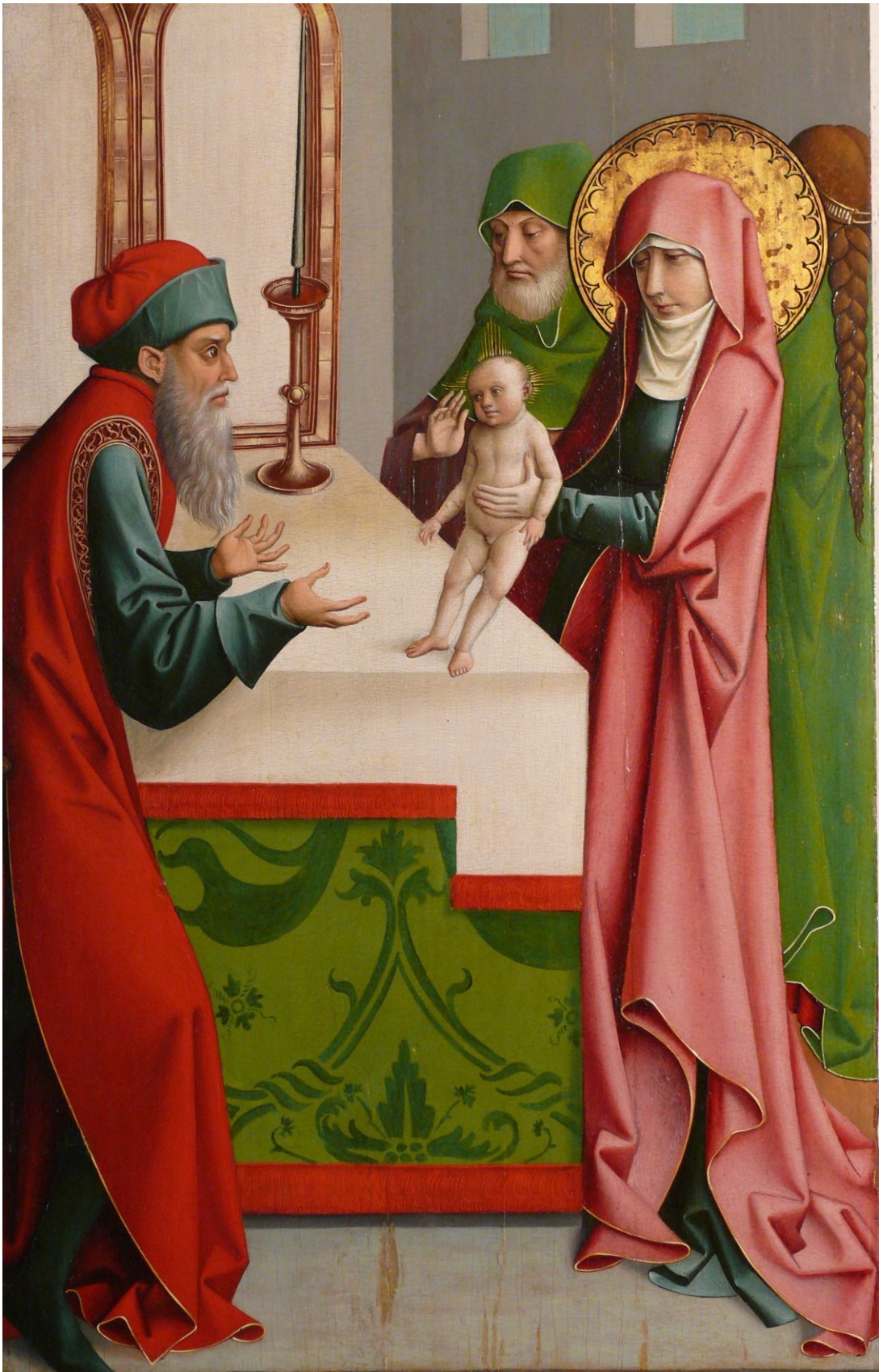
Darbringung Christi im Tempel, Tafel zum Marienleben, um 1490/1500, Venedig/Museum Civico Correr