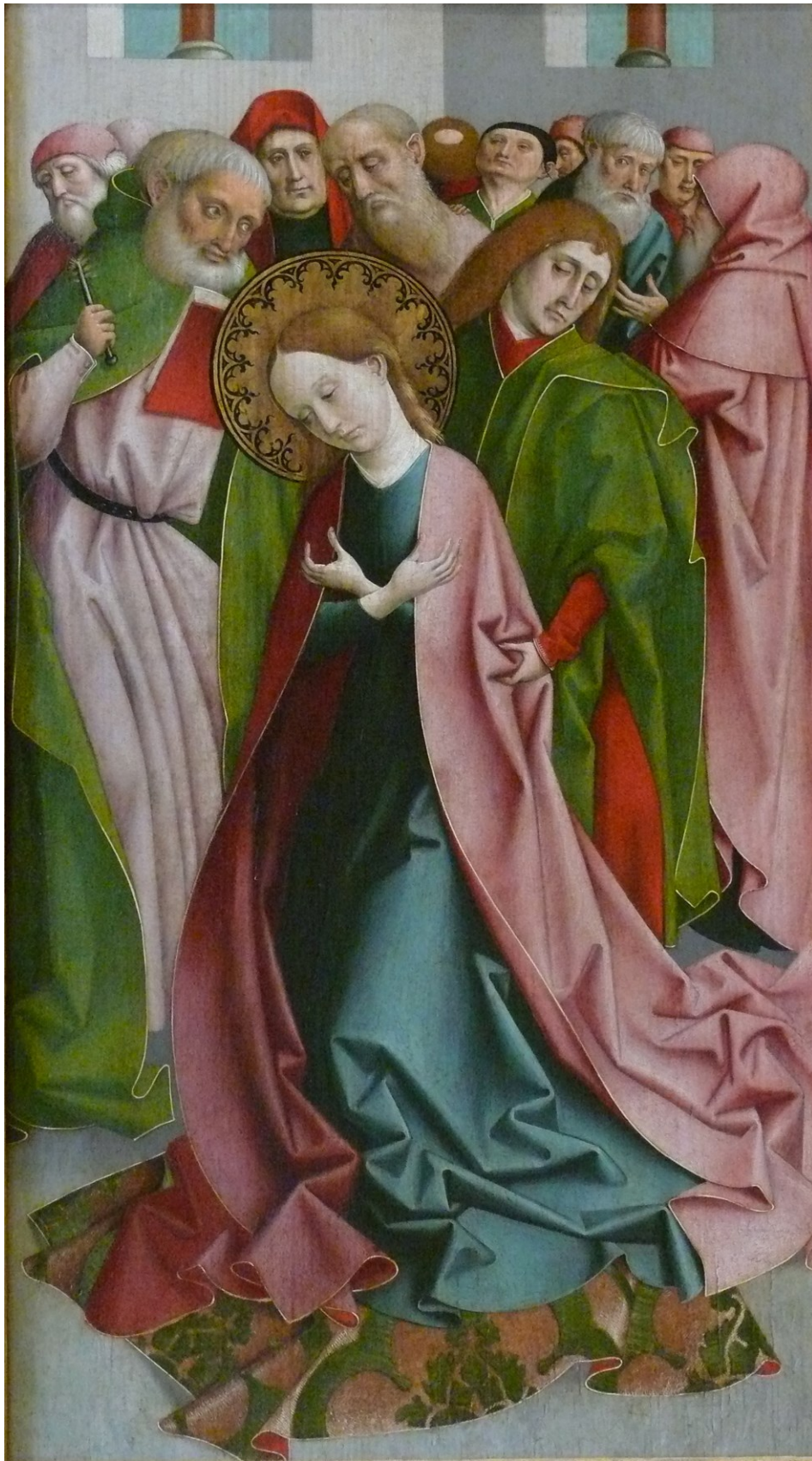
Marientod, Tafel zum Marienleben, um 1490/1500, St. Florian/Stiftsgalerie