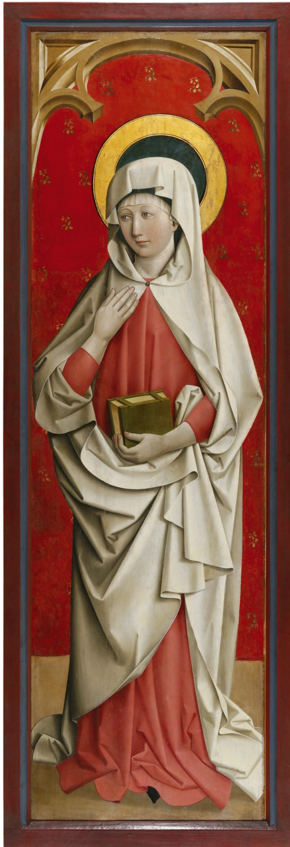
Maria, Tafel des Passionsaltars, 1470/1510, Regensburg/Historisches Museum