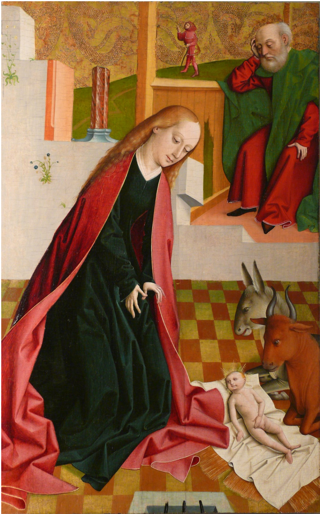
Geburt Christi, Tafel zum Marienleben, um 1490/1500, Venedig/Museum Civico Correr