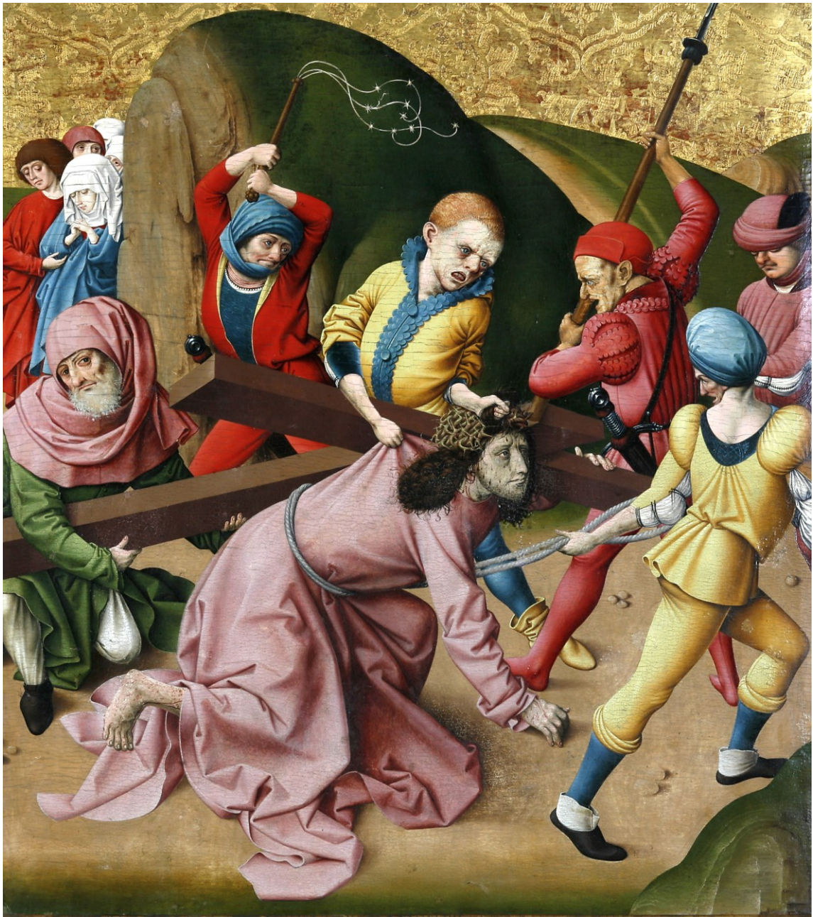
Fall Christi unter dem Kreuz, Tafel des Passionsaltars, 1470/1510, Regensburg/Historisches Museum