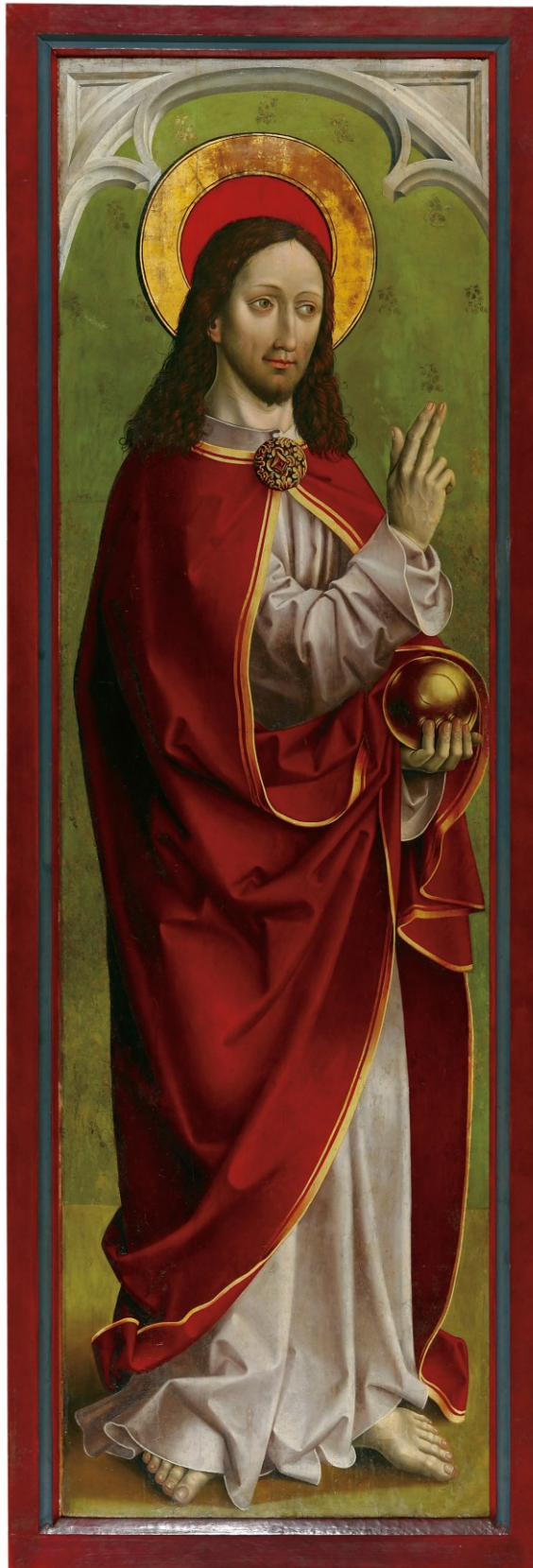
Christus als Salvator, Tafel des Passionsaltars, 1470/1510, Regensburg/Historisches Museum