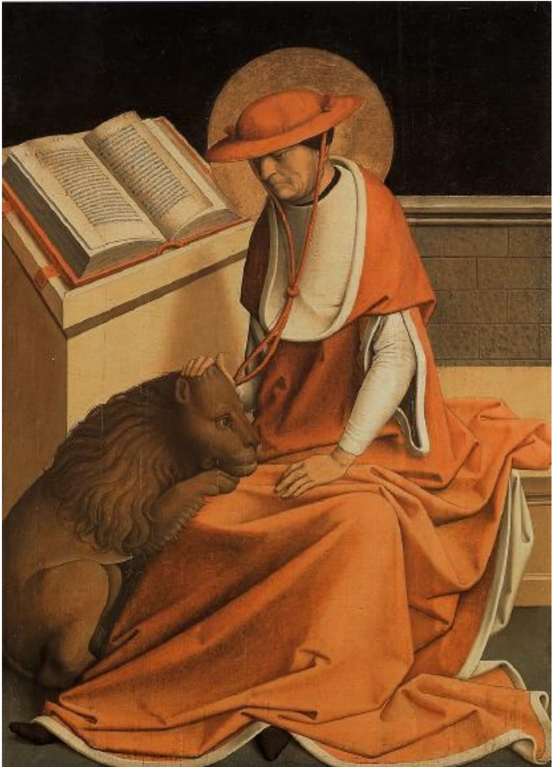
Kirchenvater Hieronymus, 1498, Madrid/Museum Thyssen-Bornemisza