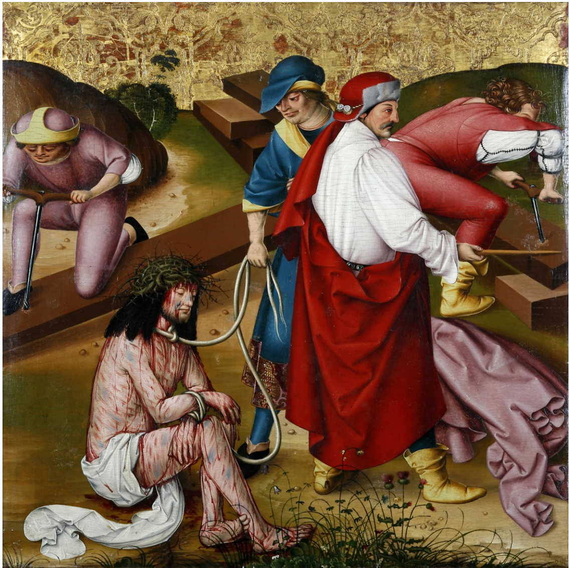
Christus in der Rast, Tafel des Passionsaltars, 1470/1510, Regensburg/Historisches Museum