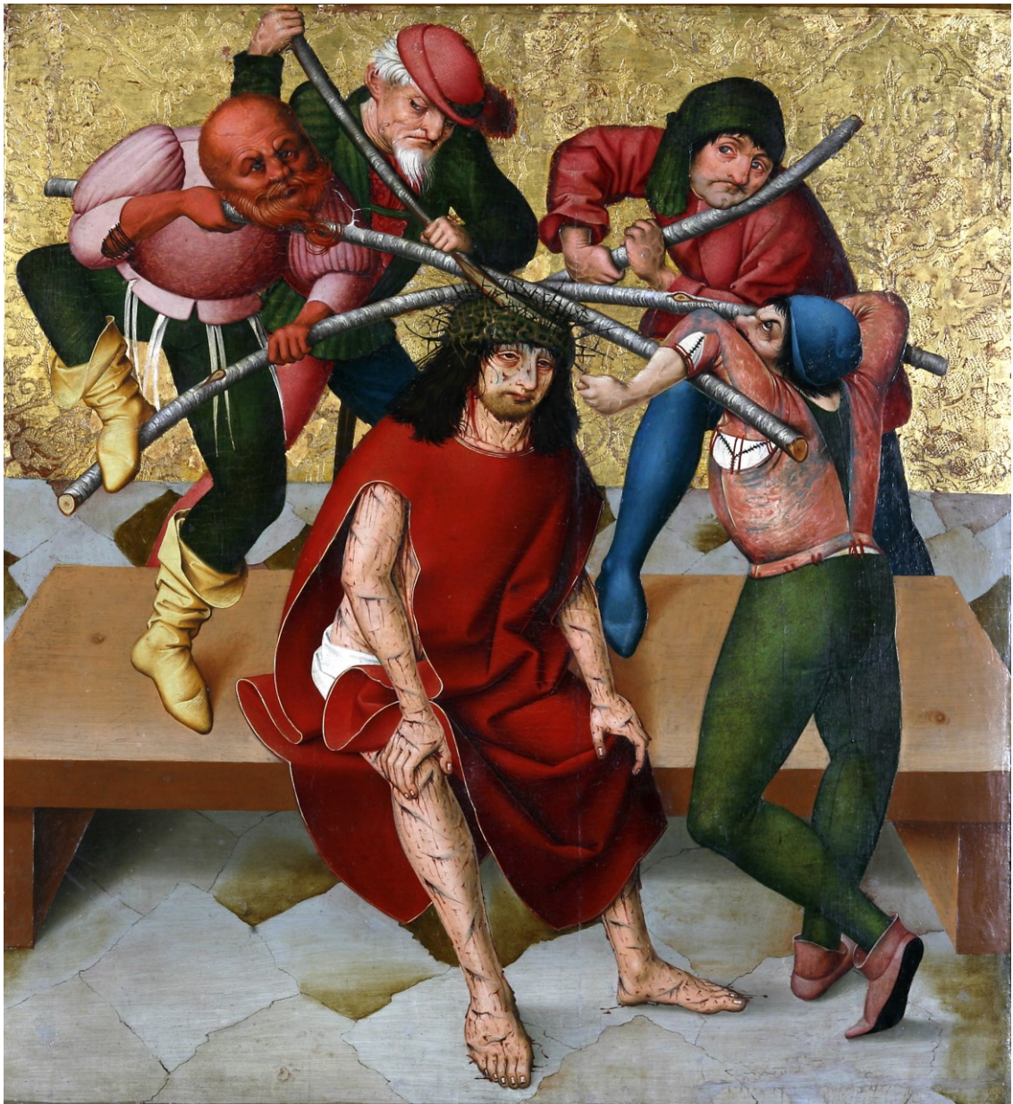
Dornenkrönung, Tafel des Passionsaltars, 1470/1510, Regensburg/Historisches Museum