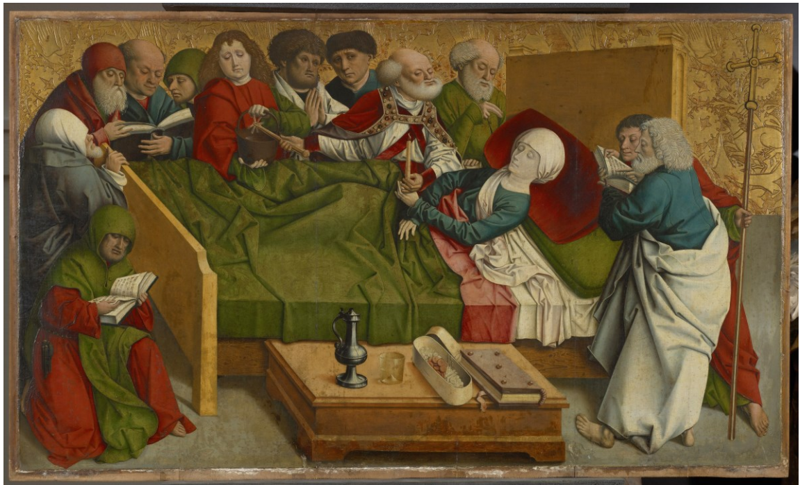
Marientod, Mittelbild des Pretschlaipfer-Triptychons, 1473/1486, Wien/Österreichische Galerie Belvedere