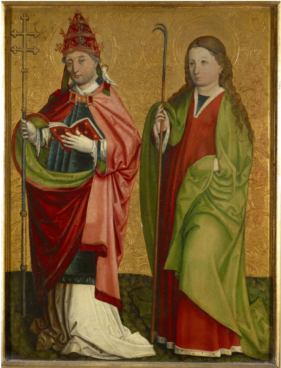
Heiliger Gregor und Heilige Agathe, Flügel des Pretschlaipfer-Triptychons, Feiertagsseite, 1473/1486, Wien/Österreichische Galerie Belvedere