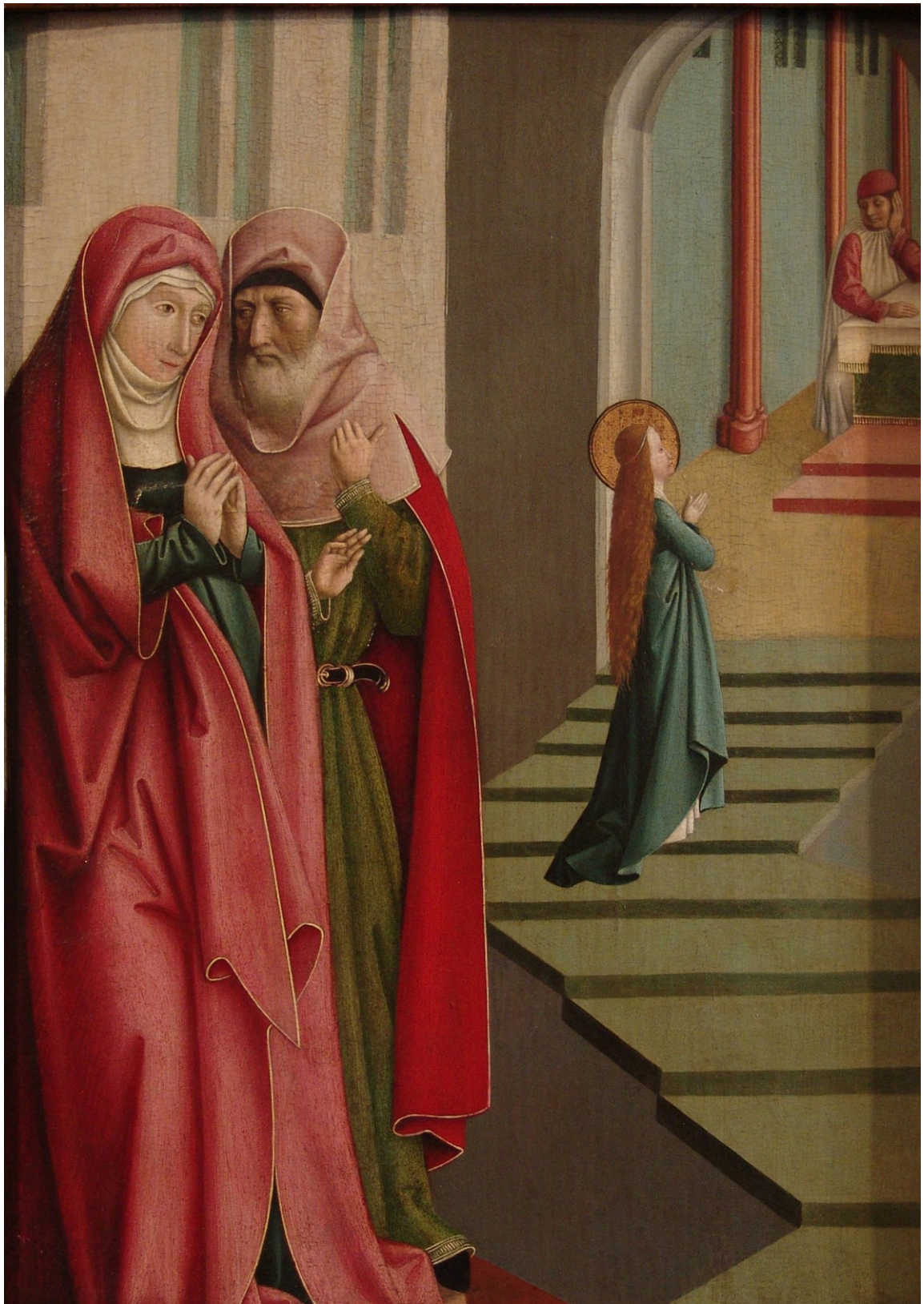
Tempelgang Mariens, Tafel zum Marienleben, um 1490/1500, Herzogenburg/Stiftsgalerie