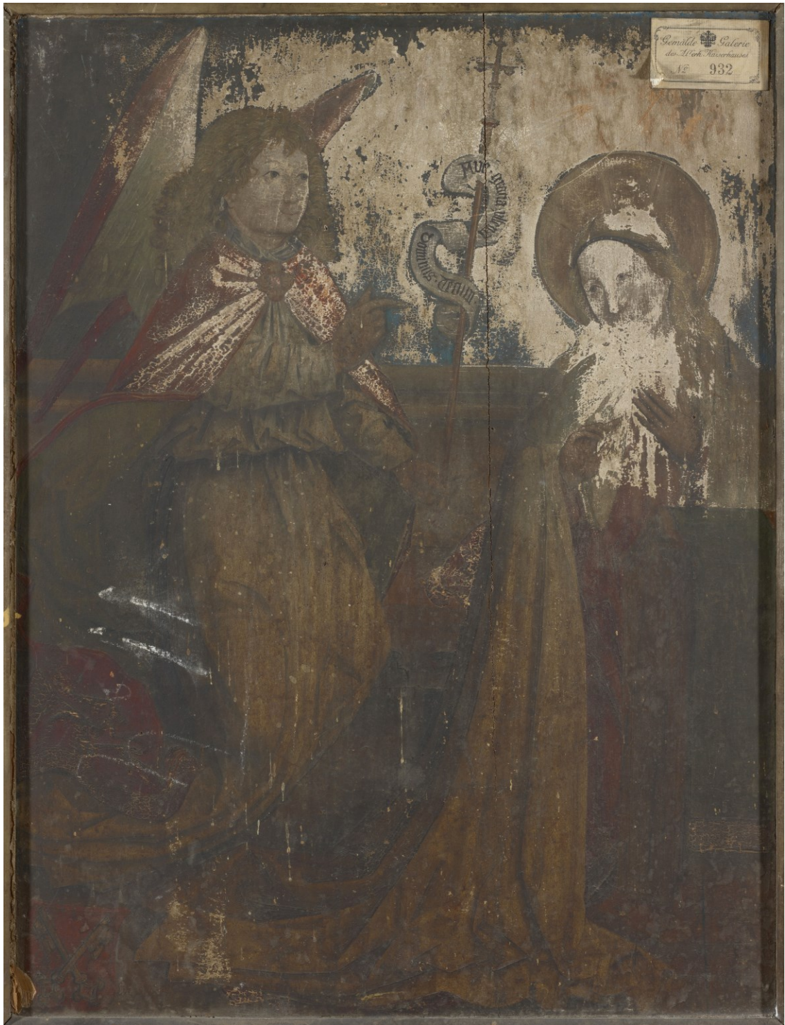
Verkündigung, Flügel des Pretschlaipfer-Triptychons, Werktagsseite, 1473/1486, Wien/Österreichische Galerie Belvedere