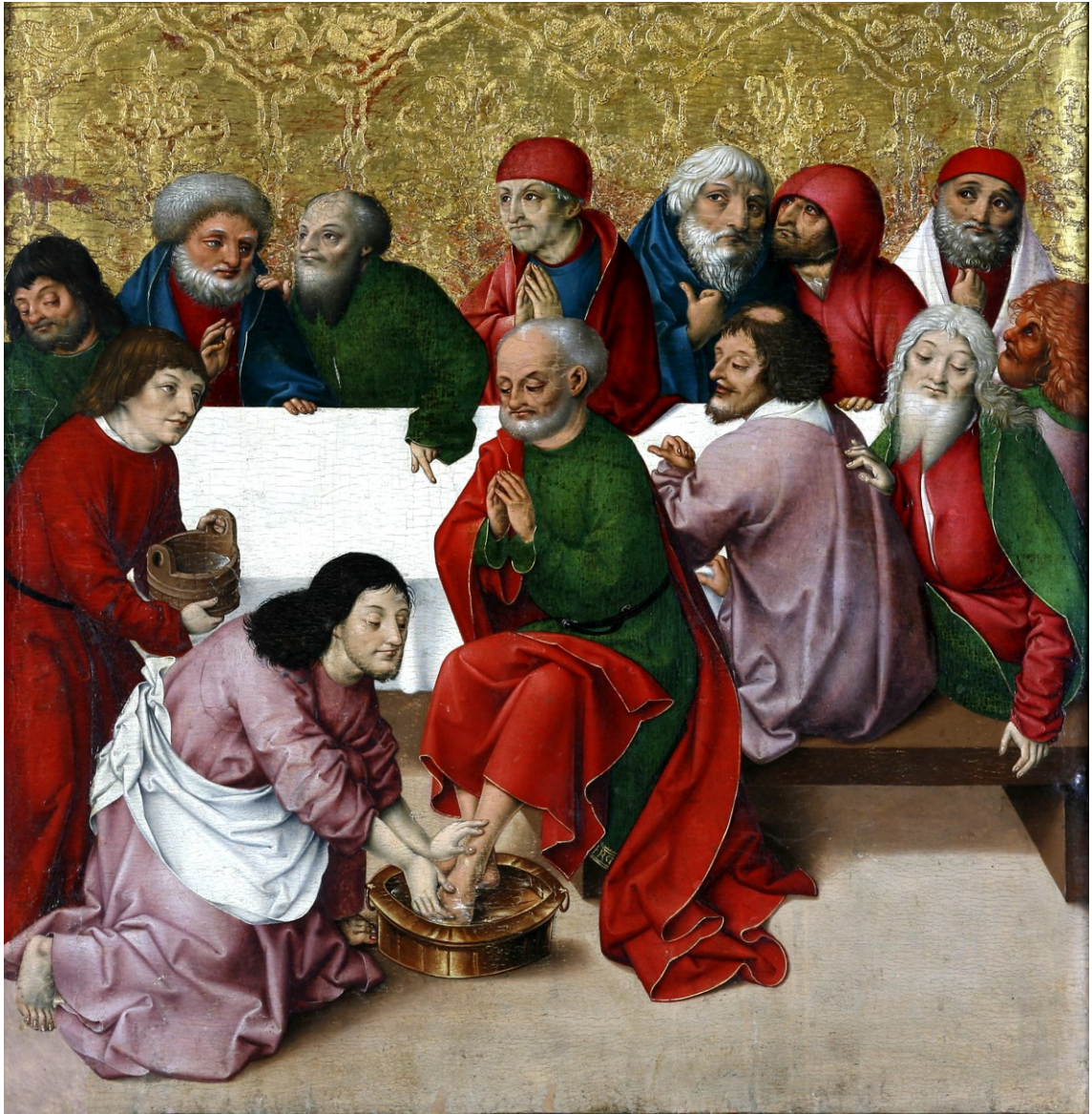
Fußwaschung, Tafel des Passionsaltars, 1470/1510, Regensburg/Historisches Museum