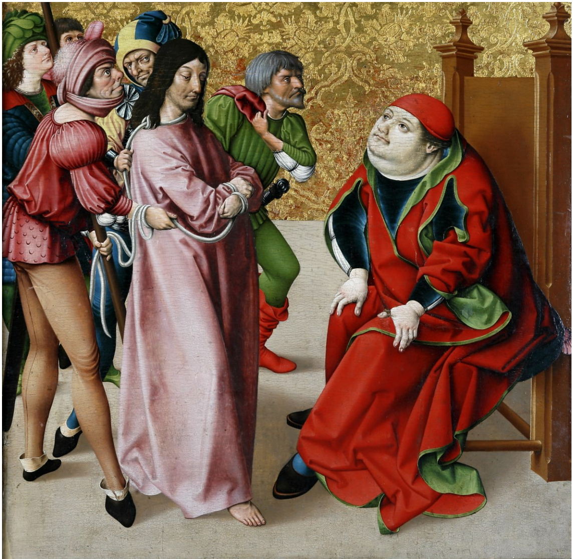
Christus vor Kaiphas, Tafel des Passionsaltars, 1470/1510, Regensburg/Historisches Museum