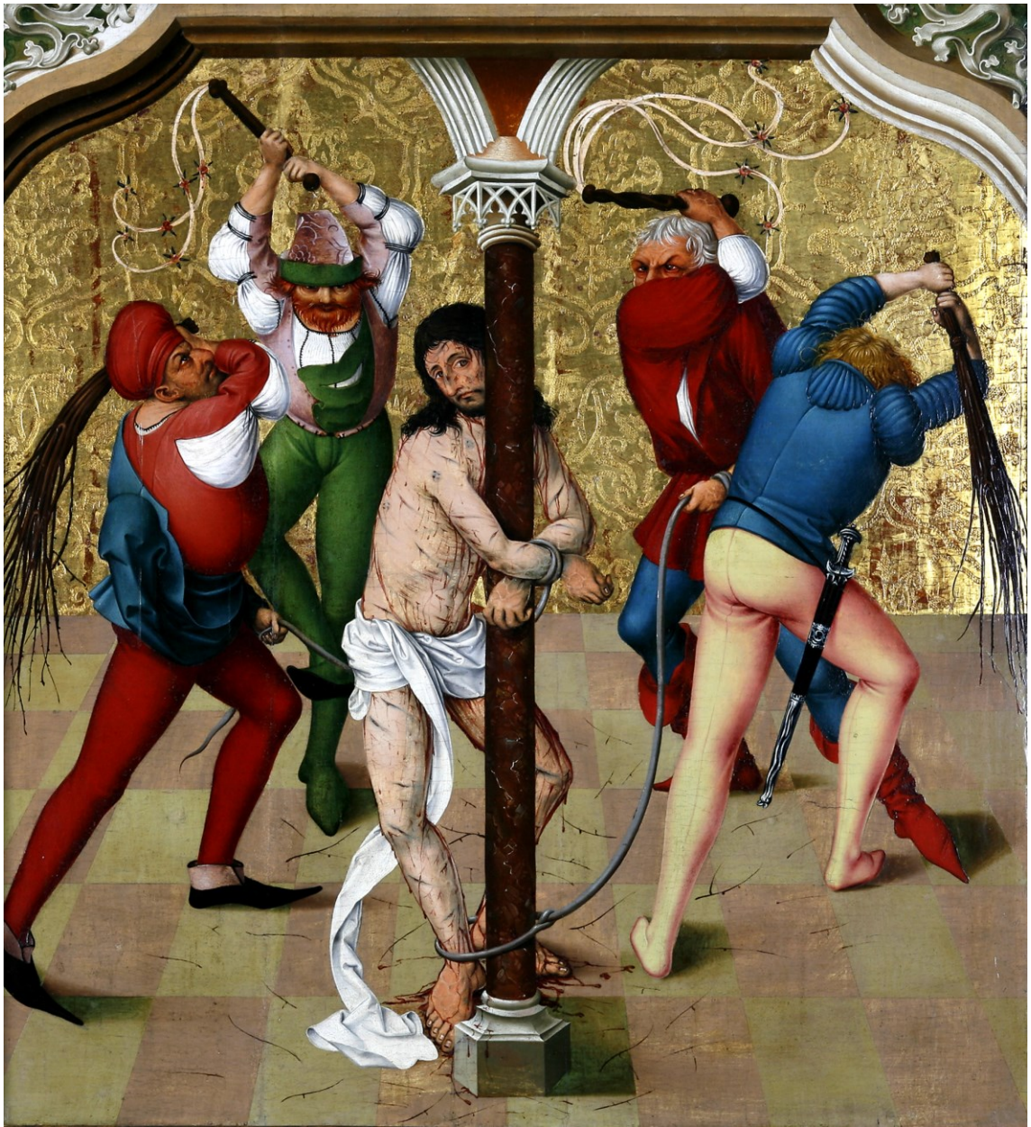
Geißelung, Tafel des Passionsaltars, 1470/1510, Regensburg/Historisches Museum