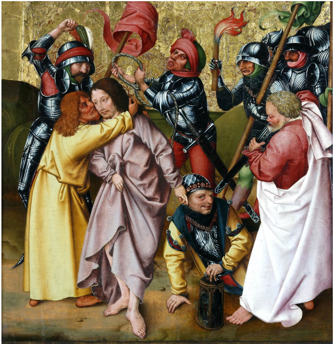
Gefangennahme, Tafel des Passionsaltars, 1470/1510, Regensburg/Historisches Museum