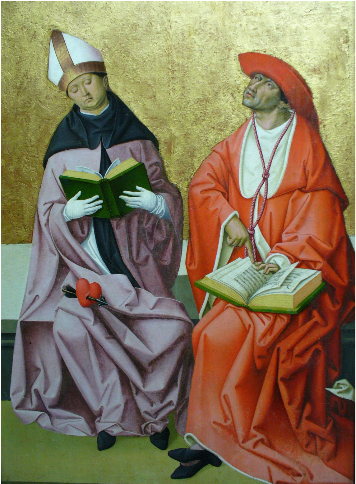
Kirchenväter Augustinus und Hieronymus, um 1500, Freising/Diözesanmuseum (jetzt als Dauerleihgabe im Stadtmuseum Fürstenfeldbruck)