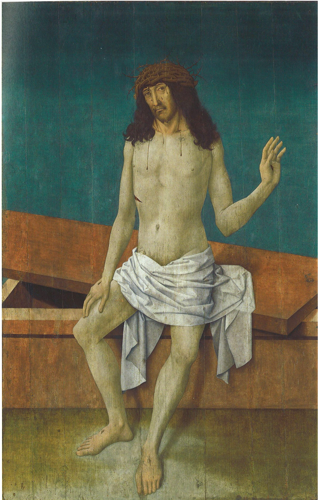
Christus als Schmerzensmann, 1490/1499, München/Alte Pinakothek