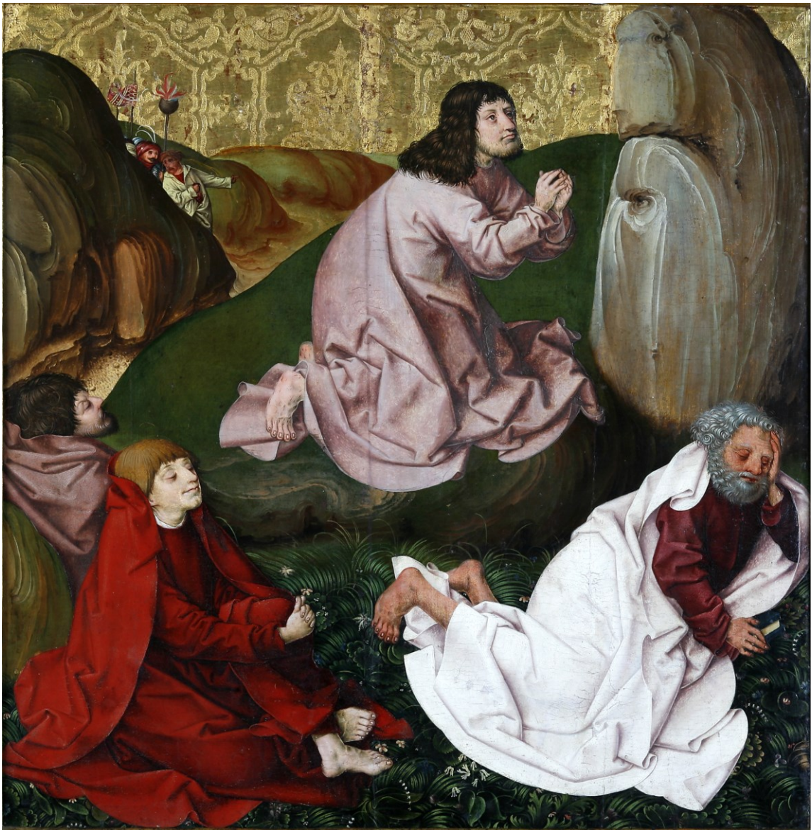
Ölberg, Tafel des Passionsaltars, 1470/1510, Regensburg/Historisches Museum