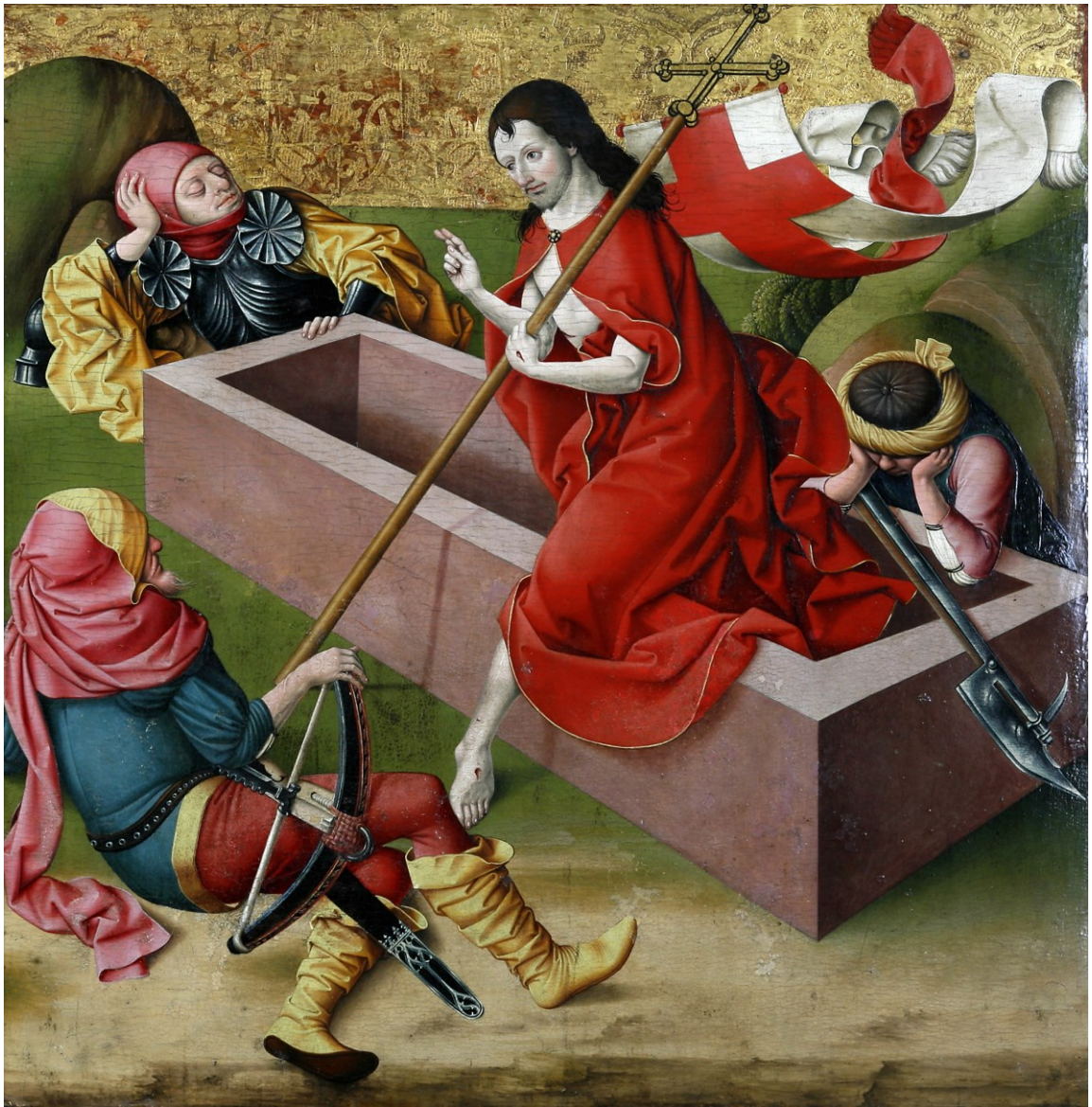
Auferstehung, Tafel des Passionsaltars, 1470/1510, Regensburg/Historisches Museum