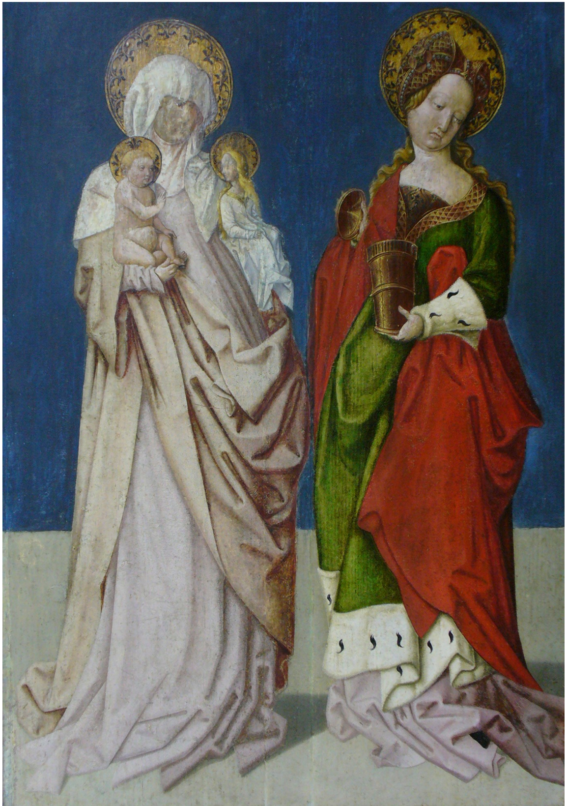
Heilige Anna Selbdritt und Heilige Maria Magdalena, um 1500, Freising/Diözesanmuseum (jetzt als Dauerleihgabe im Stadtmuseum Fürstenfeldbruck)