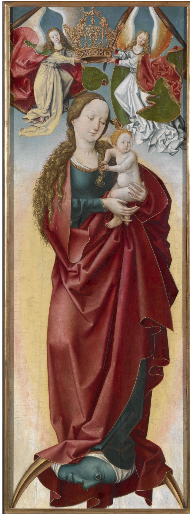
Mondsichelmadonna, 1485/1510, Klosterneuburg/Stiftsmuseum