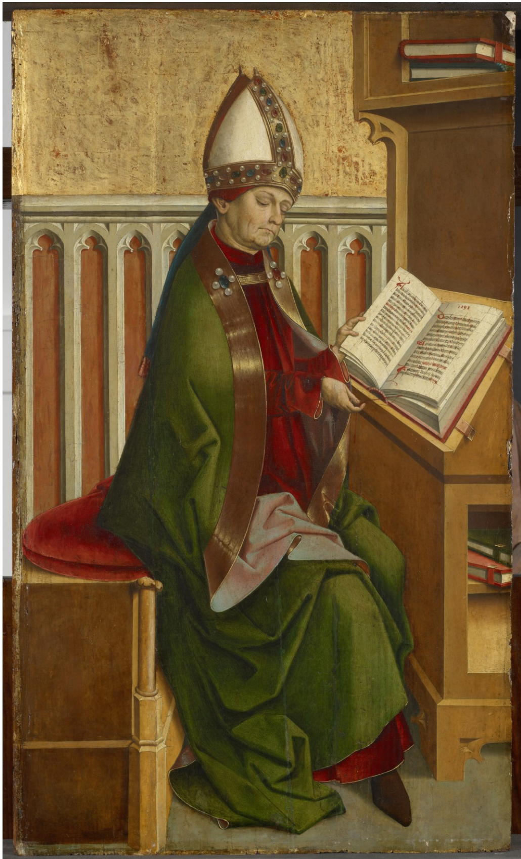
Kirchenvater Ambrosius, 1498, Wien/Österreichische Galerie Belvedere