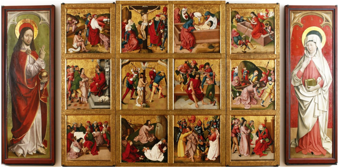
Passionsaltar, 1470/1510, Regensburg/Historisches Museum