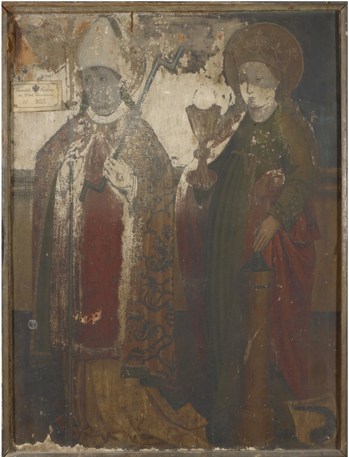
Heiliger Erasmus und Heilige Barbara, Flügel des Pretschlaipfer-Triptychons, Werktagsseite, 1473/1486, Wien/Österreichische Galerie Belvedere