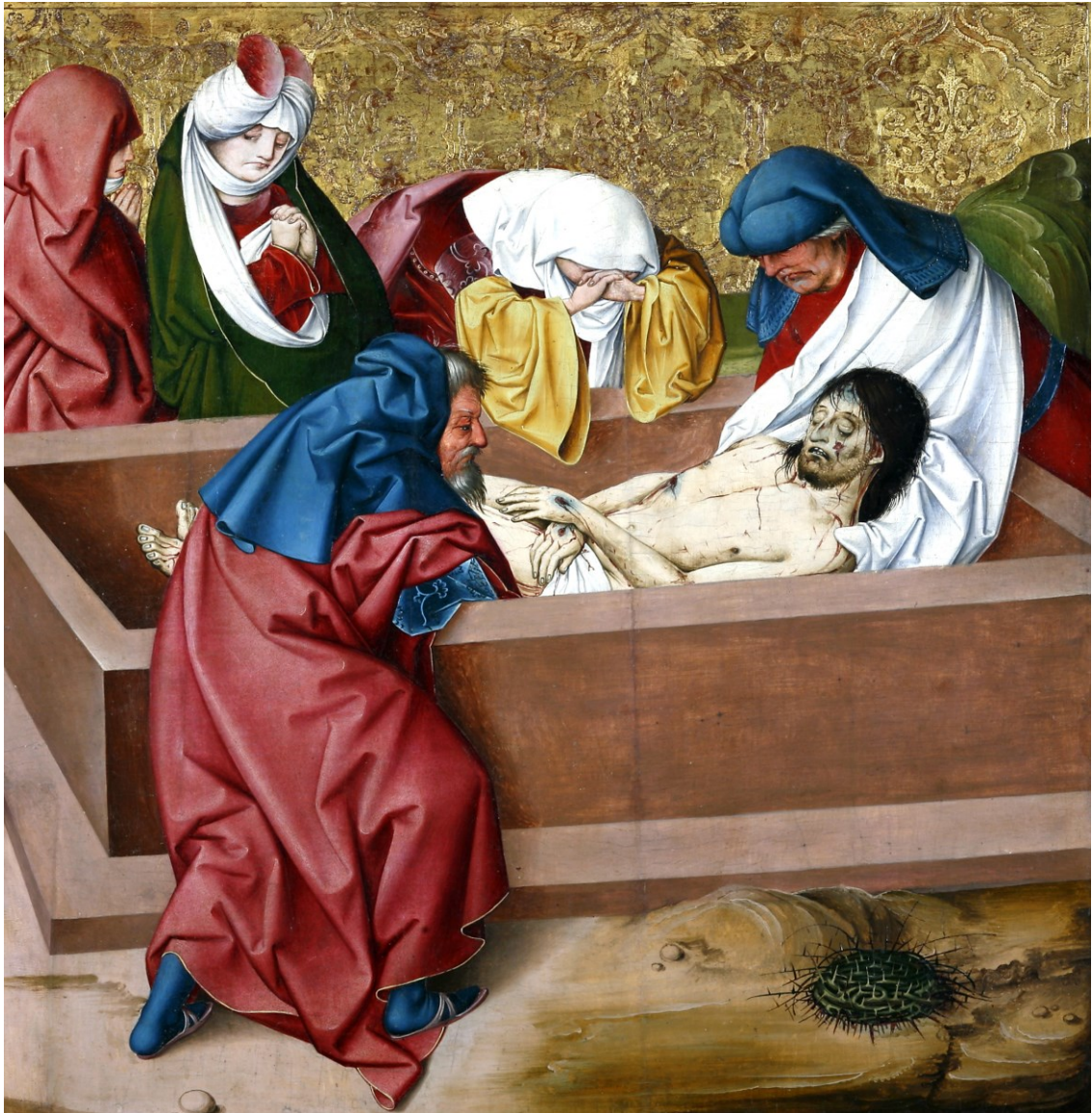
Grablegung, Tafel des Passionsaltars, 1470/1510, Regensburg/Historisches Museum