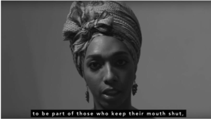
Ilustración 5: Quinesia endurecida 3. (Tatis 2016: 0:58)

el vídeo se refiere a los afrodescendientes que no se oponen a la sociedad blanqueada, 17 independientemente del color de la piel de sus integrantes, a los que asumen imposiciones epistémicas racializantes sin enfrentarse a ellas. Por ello, afirma explícitamente que se opone a formar parte de los afrodescendientes blanqueados que se instalan o que todavía no han salido de su vulnerabilidad. Se entiende, por lo tanto, la vulnerabilidad como antónimo de la valentía resistente a la racialización de la fisonomía afrodescendiente en la que se sitúa el yo poético, e indirectamente Tatis como activista estética. En el poema, los vulnerables se caracterizan por mostrarse pasivos –callando ante una injusticia por temor ante las consecuencias–, y por expresar este mismo temor, considerado como cobarde, a través de las lágrimas. Así pues, la vulnerabilidad queda articulada en este clip y, por tratarse del vídeo de inicio, en la carta de presentación