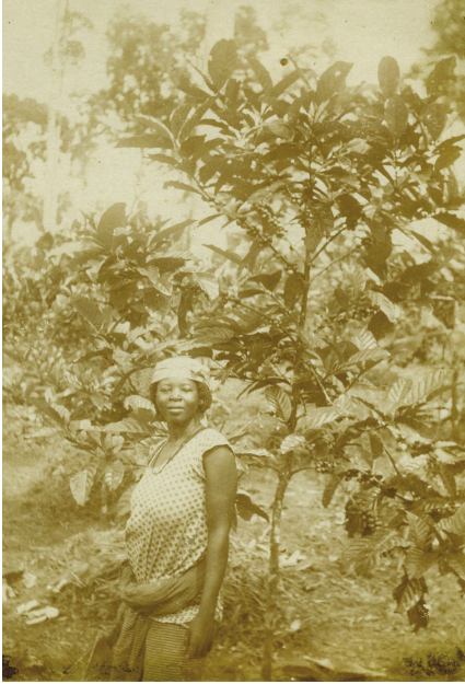
Figure 1: Photograph of a Fang woman in plantation, Equatorial Guinea.