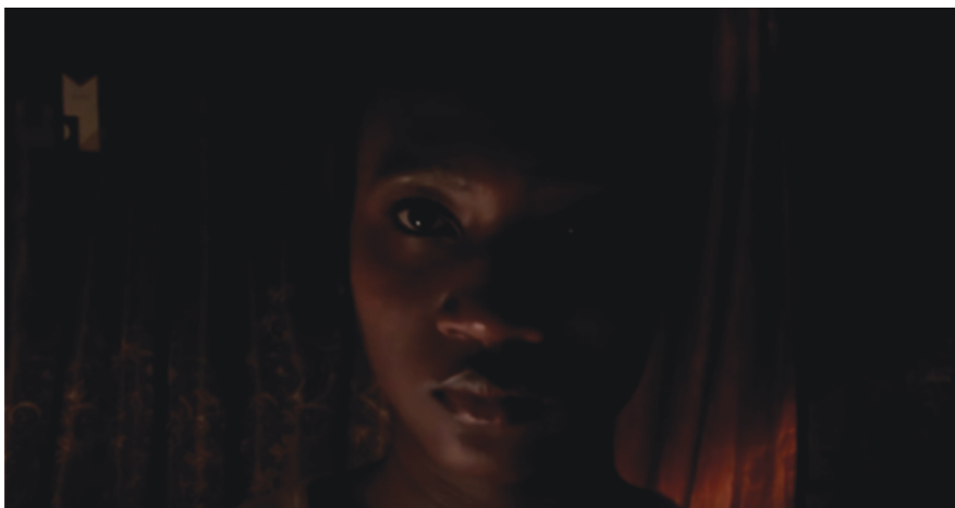
Ilustración 7: Segunda etapa (Rivas 2017: 0:23).

Un fundido en negro sirve de transición a la segunda etapa, en la que surge su imagen con los ojos abiertos, metáfora visual de lo que la voz en off expresa: “cuando te das cuenta que [sic] estás atrapada, que las cadenas te detienen, que no te reconoces, no eres un ser humano. No eres tú, eres ellos” (Ilustración 7. Rivas 2017: 0:18–0:27). La protagonista afirma captar, en un segundo momento, que había estado alienada emocionalmente en su etapa anterior de ignorancia y que ahora es capaz de sentirse agobiada por estar encajonada. Afirma sentirse