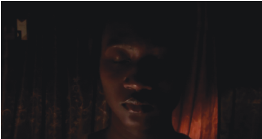
Ilustración 6: Primera etapa (Rivas 2017: 0:04).

Un fundido en negro sirve de transición a la segunda etapa, en la que surge su imagen con los ojos abiertos, metáfora visual de lo que la voz en off expresa: “cuando te das cuenta que [sic] estás atrapada, que las cadenas te detienen, que no te reconoces, no eres un ser humano. No eres tú, eres ellos” (Ilustración 7. Rivas 2017: 0:18–0:27). La protagonista afirma captar, en un segundo momento, que había estado alienada emocionalmente en su etapa anterior de ignorancia y que ahora es capaz de sentirse agobiada por estar encajonada. Afirma sentirse