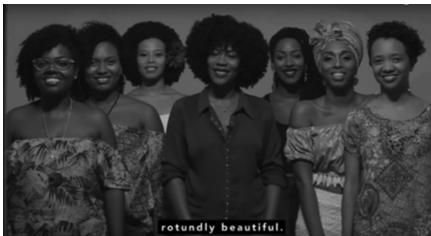
Ilustración 2: Unidad de la experiencia afrodescendiente, plano general. (Tatis 2016: 1:14)

Solo hay una referencia explícita al dispositivo emocional en el mensaje verbal. Este se expresa en los siguientes términos: “Me niego rotundamente a dejar de ser yo, a dejar de sentirme bien cuando miro mi rostro en el espejo con mi boca, rotundamente grande , y mi nariz, rotundamente hermosa , y mis dientes, rotundamente blancos ” (Tatis 2016: 0:19–0:39. La cursiva es de la autora). La poesía se refiere así a la sensación del bienestar y a la autoestima con que