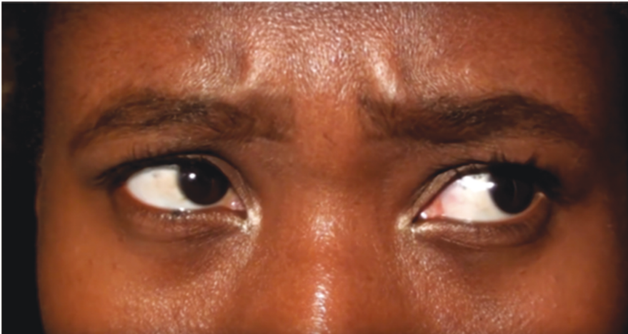
Ilustración 8: Tercera etapa (Rivas 2017: 0:40).

En una tercera etapa, el agobio se torna en angustia, la cámara se acerca y se centra, en un primer primerísimo plano, en los ojos –que se mueven nerviosos– y en la frente, que termina por fruncir el ceño (Ilustración 8). El ritmo de los latidos del corazón y de la voz en off se acelera, al reconocer la rabia y el dolor de “cuando por fin te enteras que [ sic ] te niegan, que no existes, que no eres, que no puedes ser, gritas, gritas tan fuerte y lloras, te sacudes, te sacudes las cadenas e intentas liberarte de la historia, del presente y maldices, maldices ferozmente a aquel que te dice que no puedes ser” (Rivas 2017: 0:29–0:44).