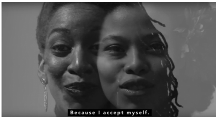
Ilustración 1: Unidad de la experiencia afrodescendiente, primer plano. (Tatis 2016: 1:03)