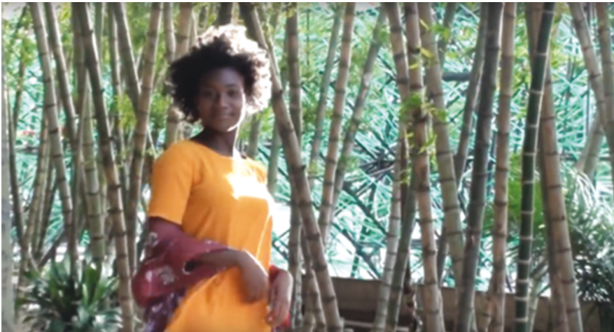
Ilustración 11: El bienestar. (Rivas 2017: 1:44)