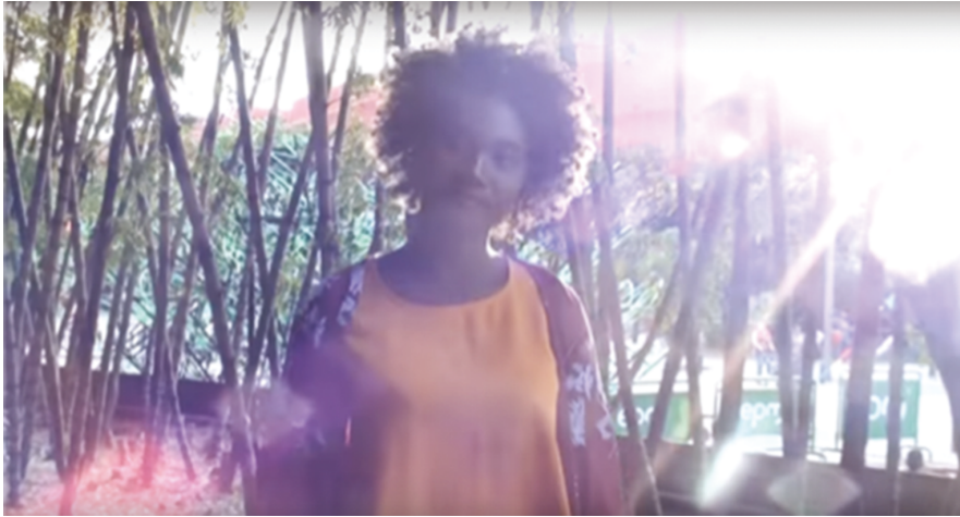
Ilustración 12: La realización personal. (Rivas 217: 1:32)