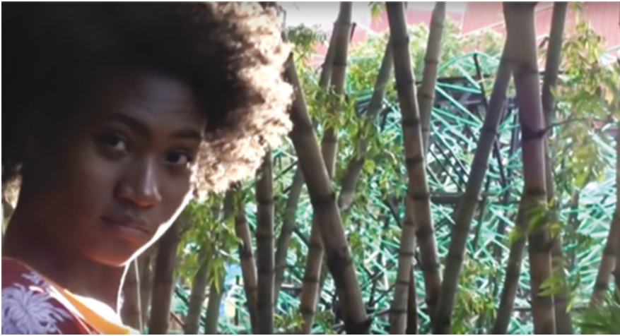
Ilustración 10: El orgullo. (Rivas 2017: 1:26)

imágenes que cierran el vídeo compensan esta inexpresabilidad a la que hacía referencia Rivas y muestran a la protagonista sonriente, relajada, confiada, exhibiendo su cuerpo y su pelo, al igual que hiciera Pelo bueno . Rivas va un paso más allá y llega incluso a coquetear con la cámara (Ilustración 10 y 11). Por último, la luz del atardecer, que funciona como metáfora de la realización personal, ciega al espectador y cierra el vídeo (Ilustración 12).