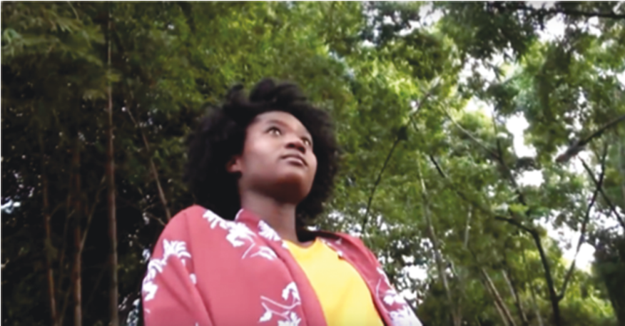
Ilustración 9: La llegada al orgullo. (Rivas 2017: 0:54)

Este hito provoca un desplazamiento en su dispositivo emocional hacia el emotive del orgullo: en sus palabras ya “solo podía ver y sentirme altiva, orgullosa por lo que era y lo que había elegido ser” (Rivas 2017: 1:04–1:09). La sensación de altivez se refuerza visualmente a través del ángulo adoptado por la cámara en contrapicado, o en angulación oblicua superior, que tiene la función convencional de transmitir la superioridad del personaje y le permite, además, a la protagonista mirar desde arriba, gesto típico de la altivez (Ilustración 9). Al igual que en el vídeo de Pelo bueno , el orgullo se expresa acústicamente a través de la apropiación de los tambores, marcador de la negritud cultural por la que Rivas se decanta en una aproximación constructivista de la identidad, por “lo que había elegido ser” (Rivas 2017: 1:09).