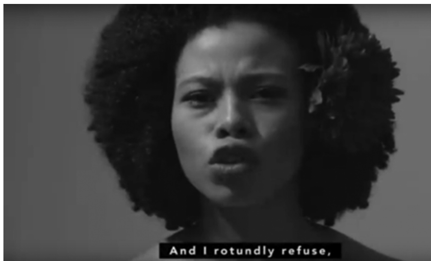
Ilustración 3: Quinesia endurecida 1. (Tatis 2016: 0:58)