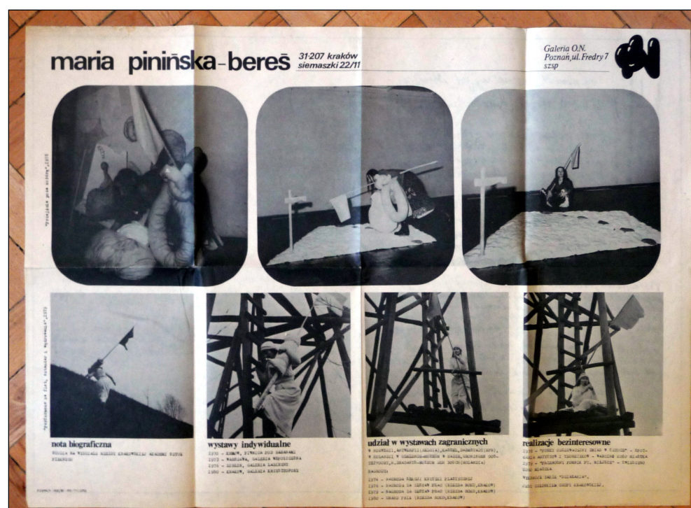
Maria Pinińska-Bereś Sztuka Kobiet, Galeria O.N, Posen, Ausstellungsplakat Vorderseite, 1980

https://wissenderkuenste.de/wp-content/uploads/2021/04/einschreiben_constanze_krueger.mp3