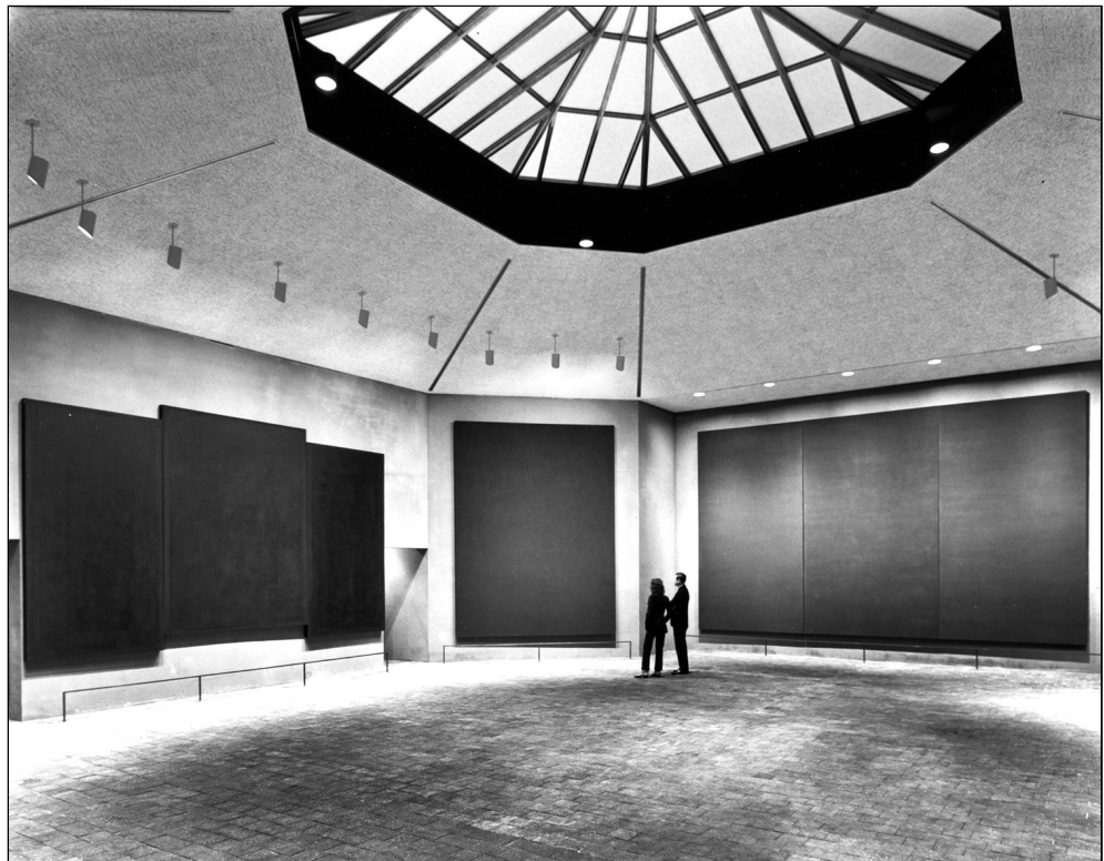
Mark Rothko - Rothko Chapel interior, 1971

https://wissenderkuenste.de/wp-content/uploads/2021/05/symbolisieren_silvia_bahl.mp3