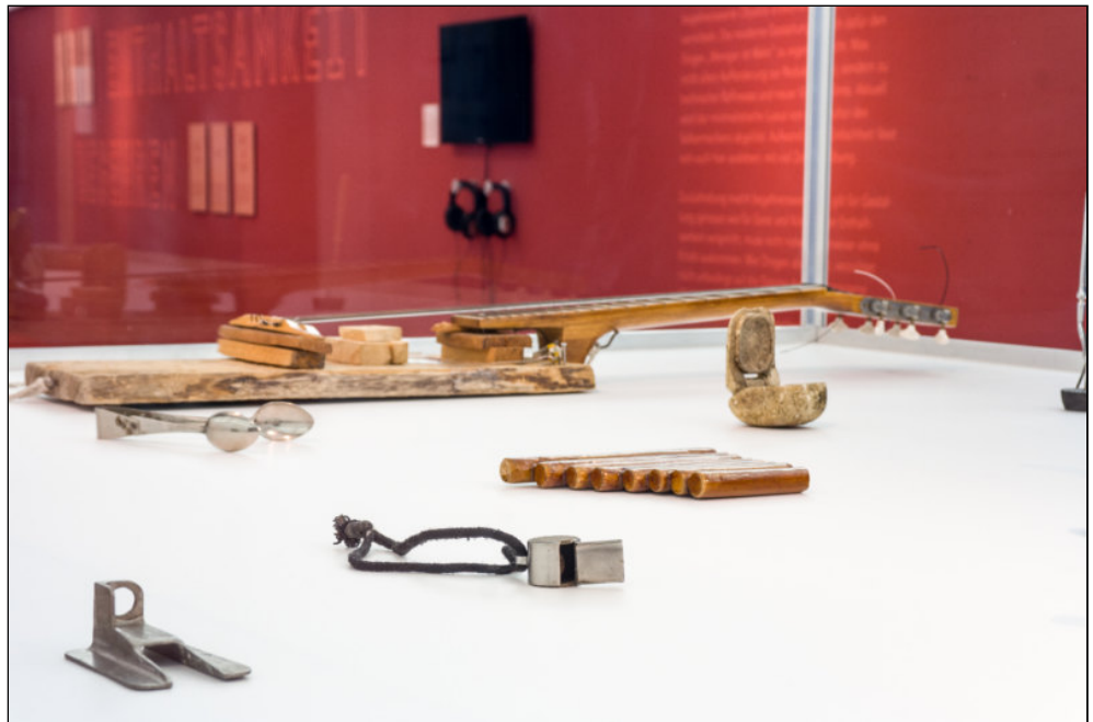
Abb. 2: Vladimir Arkhipov: Museum of the Handmade Object, 16 Objekte, ca. 1947– 2007; Courtesy Vladimir Arkhipov; Ausstellungsansicht Vögele Kultur Zentrum, „Mehr von Weniger“, Mai – September 2015; Foto: Felix Sattler/Exponenten.