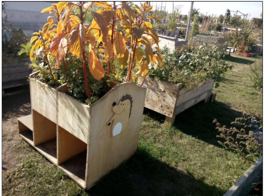
Abb. 5: Tempelhofer Feld, Allmende-Kontor, Berlin 2015, Foto: NW.

Damit geht der provisorischen Ästhetik gegenüber der Bastelei verloren, was der Vladimir Arkhipov für seine Objektsammlung reklamiert: 10 Fundus eines funktionalen, fiktionalen, gestalterischen Erfindungsreichtums zu sein, weil der Design(er)-Amateur mit dem dafür nicht Vorgesehenen arbeitet und dem Material neue Eigenschaften abringt in einer Art ingenieurhaftem Tun. Der Hollywood-Film Apollo 13 von 1995 setzt einen solchen bastelnden Ingenieur dramatisch in Szene: Er baut aus dem, was die Raumfähre alles an Bord hat unter Zeitdruck einen provisorischen Luftfilter, und hilft damit die Katastrophe zu verhindern.