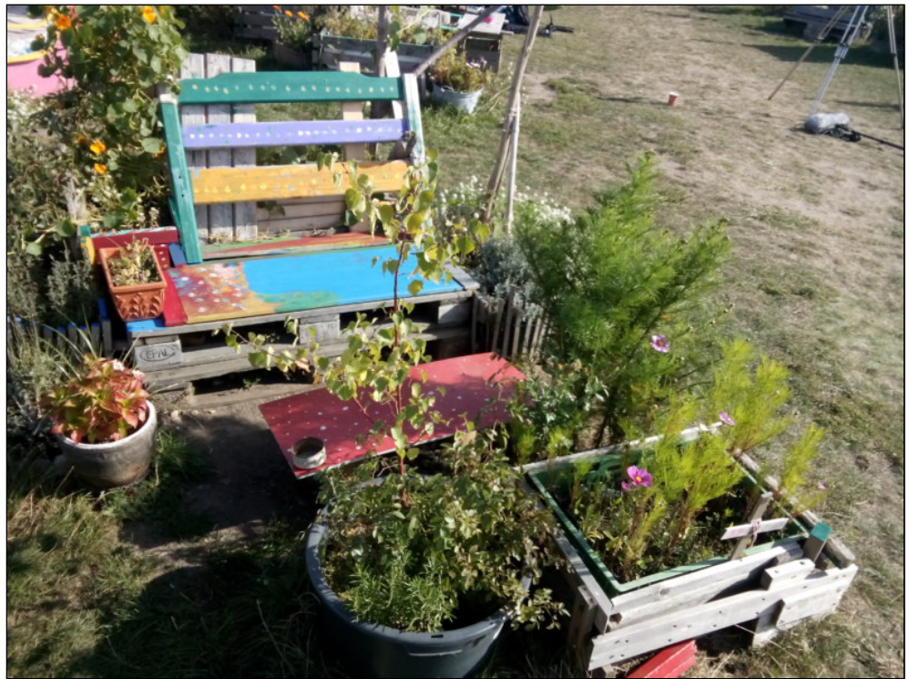
Abb. 1: Tempelhofer Feld, Allmende-Kontor, Berlin 2015, Foto: NW.

An Lévi-Strauss' Bastler könnte man zunächst denken, wenn man durch die Gärten auf dem Berliner Tempelhofer Feld spaziert (Abb. 1). Vieles ist hier selbstgebaut oder umgearbeitet oder scheint gerade in der Mache – häufig aus dem Grundstoff Europalette. Doch der Bastler gehört zu einer Kultur des Mangels und zu einem Zeitregime der Vorsorge – eine Bedeutung, die etymologisch auch in der lateinischen Wortherkunft von Provisorium steckt. Die Ästhetik des Provisorischen hingegen, die uns heute umgibt, gehört einer Kultur des Überflusses und sie folgt einem anderen Zeitregime. Obgleich auch der Bastler wie der Produzent provisorischer Ästhetik einem gewitzten Einfall folgt und sein emsiges Tun nicht allein damit begründet werden kann, dass er einfach nur irgendeinen Mangel ausgleicht, ist nicht länger der bricoleur am Werk. Vielleicht könnte ihr/sein heutiger Name Provisoriker/in sein.