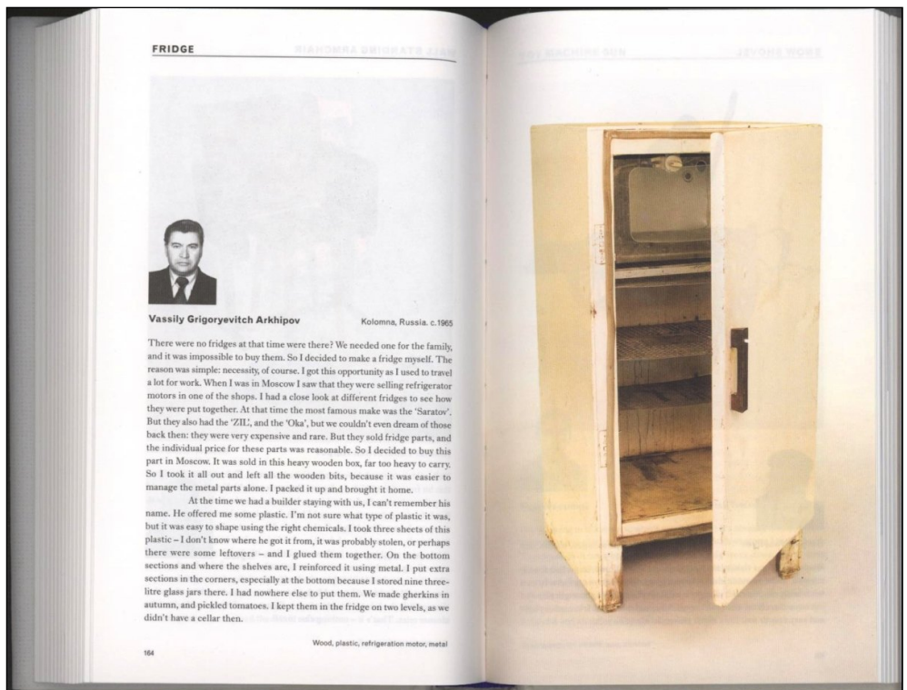
Abb. 3: Doppelseite aus: Vladimir Arkhipov: Home-Made. Contemporary Russian folk artifacts, London 2006, S. 164–165.