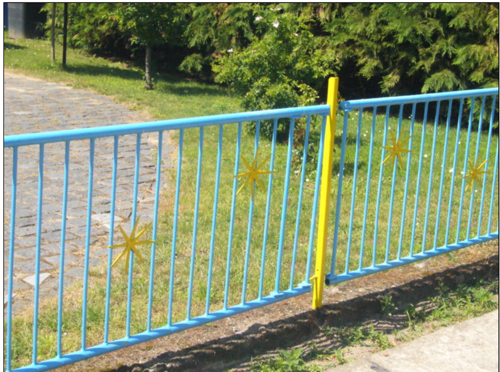
Abb. 4: Selbstgebauter Zaun, ca. 1970, DDR, Oderbruch