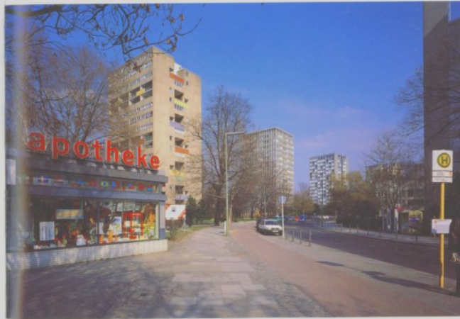
Die Reihe der Punkthochhäuser

Die fünf Punkthochhäuser, die der Kurve des Stadtbahnviaduktes eingeschrieben sind, bilden den nördlichen Abschluss des Interbaugeländes. Aus der Sicht der Fußgänger, die die Bärtingallee entlanggehen, blenden sie nicht nur das nördlich anschließende Stadtviertel, sondern auch das S-Bahnviadukt, das dicht hinter ihnen verläuft, effektiv aus dem Blickfeld aus. Mit ihrer Höhe von 15 bzw. 17 Geschossen stellen sie als plastische Baukörper frei vor dem offenen Himmel, deutlich voneinander unterscheidbar in ihren unterschiedlichen Konstruktionen und Farbgestaltungen. Die Gartenarchitekten, die für diesen Abschnitt der Interbau verantwortlich zeichnen – Gustav Lüttge (Hamburg) und Pietro Porcinai (Florenz), fassten den Raum am Fuße der Hochhäuser zusammen und gaben ihm mit einem hinterpflanzten Pergolagang, der an den nördlichen Grundstücksgrenzen entlangführt, eine gemeinsame Rückwand. Zwischen den Häusern legten sie weite Wiesenflächen mit vereinzelt Bäume an; im Bereich Bärtingallee 11 und 13 entstanden zwei von Buschwerk gerahmte runde Sitzplätze. Ein besonderer Kunstgriff gelang mit der Erhaltung einer Reihe älterer Linden zwischen den Häusern von den Broek und Bakema, Bärtingallee 9, und Hasselpflanzung, Bärtingallee 11. Diese Bäume hatten die ehemals vom Hansaplatz geradeaus nach Norden führende Klopfstock-