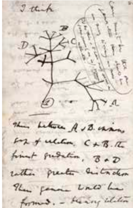
Abb. 2: Charles Darwin, Die populärste von Darwins diagrammatischen Skizzen der Entwicklung der Arten, verstanden als Spur eines in schneller Entwicklung begriffenen Erkenntnisprozesses (Tinte auf Papier), 17 x 9,7 cm

Ähnlich hat Hans-Jörg Rheinberger festgestellt, dass ein erkenntnistreibendes Modell ein solches erst im Blick darauf sei, was an ihm zu wünschen übrig bleibe. 13 An einem Modell kann sich der suchende Verstand auf sinnlich erfahrbaren und konkret vorstellbaren Oberflächen gleichsam abstützen und somit zu anderen Überlegungen gelangen als ohne Modell. Baum und Koralle verleihen der offenen Frage verschiedene Farben und Formen und lenken daher die Hypothesenbildung in verschiedene Richtungen. Insofern hier also materielle Formen Gedanken prägen und anleiten, sind ästhetische Spekulationen zentral an der Herausbildung der Evolutionstheorie beteiligt.