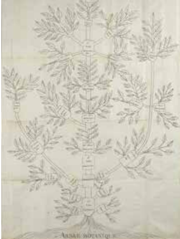
Abb. 1: Augustin Augier: Arbre botanique , 1801, Kupferstich

einer der wichtigsten Erkenntnisse der neuzeitlichen Wissenschaften, unter dem Einfluss einer Reihe erkenntnisträchtiger Modelle. Die wichtigste Rolle spielt hierbei aufgrund seiner langen Geschichte als genealogisches Familienmodell der Baum, und zwar bemerkenswerterweise vor, während und nach der Formulierung der Evolutionstheorie (Abb. 1). Ein zentrales Element dieses Modells ist die Verzweigung und der Umstand, dass – von seltenen Ausnahmen abgesehen – ein Ast eines Baumes nicht wieder mit dem Stamm und ein Zweig nicht wieder mit einem Ast zusammenwächst. Fasst man einen konkreten Baum als Modell der Entstehung der Arten auf, dann wird seine vegetabile Verzweigungslogik theoriebildend – ein materielles Objekt formt also einen Gedanken. Dies wird durch die Modellauffassung möglich, genauer gesagt dadurch, dass ein Gegenstand als Modell von etwas und für etwas anderes aufgefasst wird. Dieses Als-ob ermöglicht fiktive Rochaden, durch die das Materielle, Visuelle und Taktile zu Gedanken, Ideen und Erkenntnissen und zugleich das Ästhetische zum Spekulativen werden kann. 8