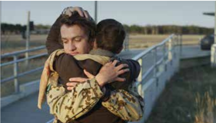
Omer Fast, Continuity , 2012, Single Chanel HD Video, Ton, Farbe, 40 min.

um ein Selbstporträt. Genau wie bei den Eltern in Continuity befindet sich ein großes gähnendes Loch in der Mitte von dem, was ich tue, und der kreative Prozess speit immer wieder Platzhalter aus.