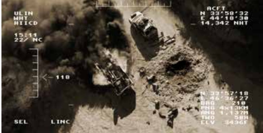
Omer Fast, 5.000 Feet is the Best , 2011, Digital Video, Ton, Farbe, 30 min.

phische Spekulation ist laut Kant aufgrund ihrer mangelnden empirischen Fundierung in ihrer Gültigkeit beschränkt und vor allem rein theoretisch. Der Gedanke, dem wir mit dem Symposium und diesem Band nachspüren, ist, dass es auch im Ästhetischen, in der Kunst, den spekulativen Ausgriff auf das gibt, was sich jeder Erfahrung entzieht; dass auch ästhetische Verfahren existieren, die spekulativ zu nennen sind, insofern sie sich auf das der Erfahrung Unverfügbare richten und das Nicht-Wissen produktiv werden lassen.