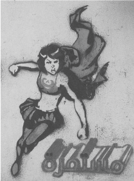
Abb. 4: El Teneen: Graffito mit dem Motiv der „Women in the Blu Bra“, Tahrir Platz, 10. Februar 2012. Siehe Tafelteil, S. XIV.

bekanntesten Bildlieferanten. 28 „Auf der Straße, unter den Blicken und Kameras der Medienöffentlichkeit, werden die Bilder nun als Bildobjekte dem digitalen Bildverkehr entwunden und gleich wieder in ihn eingespeist“, so Tom Holert. 29 „Bildobjekte“ sind nach Holert solche Bilder, die – anders als ein Bewegtbild – in der Hand gehalten und vorgezeigt werden können, und das nicht nur für die lokale Umgebung, sondern auch im Hinblick auf ein zukünftiges Bild, das die Bildobjekte zusammen mit den sie tragenden Subjekten zeigt und welches seinerseits in Umlauf gesetzt wird. Hunderte von Fotografien sind von diesen Demonstrationen inklusive Bildobjekten und Handys, die von der Menge in die Höhe gehalten werden, in Flickr-Alben zu finden, dort nach Themen, Motiven oder Anlässen gruppiert. Manche dieser Fotografien erscheinen auch auf Galeriewänden außerhalb von Ägypten – einige der ägyptischen Fotograf/innen haben es zu Bekanntheit (und zu Geld) gebracht. 30