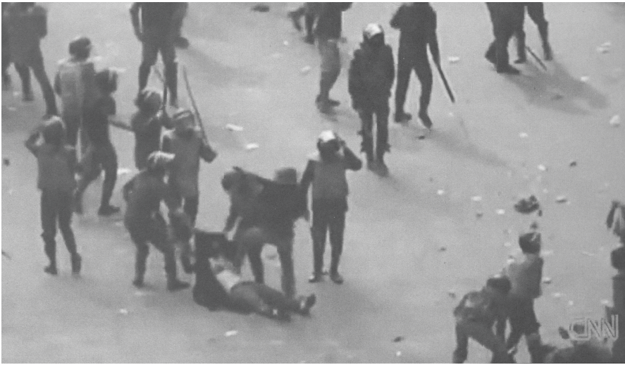
Abb. 1: Filmstill aus dem CNN-Bericht, Dezember 2011. Siehe Tafelteil, S. XIII.

mediale Berichterstattungskonventionen und durch postkoloniale Verhältnisse bestimmt ist. Diese Peripheriezuschreibung als Ort des Anderen hat direkt zu tun mit einer Okzident- und Orientunterscheidung, die nicht zuletzt getragen und perpetuiert wird von Einschätzungen geschlechterpolitischer Fortschrittlichkeit vs. Rückständigkeit, wie sich auch am Blue Bra -Video zeigen wird. Zum anderen erfolgt die Verbreitung dieses Videos unter medialen Bedingungen, die die Peripheriefrage neu und anders stellen. Denn verglichen mit den alten Institutionen der Nachrichten- und Bildagentur samt ihrer räumlichen, baulichen und technischen Zentralen, handelt es sich im Fall des Videos um eine Verstreuung auf peripheren Verbreitungswegen. Es ist eines jener autorlosen oder unautorisierten Videoschnipsel, wie sie zuhauf in den Social Media zirkulieren, d.h. in bzw. zwischen Blogs, Sharing-Plattformen und Nachrichtenseiten verlinkt, kopiert und appropriiert werden. Die Disseminationen und Verstreuungen beschränken sich dabei keineswegs auf den Raum des Digitalen. Als Still, als stehendes Bild, wandert das Video zurück auf die Straße, auf Mauern und Plakate. Auch als Coverbild auf gedruckten Zeitungen taucht es auf, ägyptischen wie europäischen. Die Verfahren redaktioneller Auftragsvergabe und Materialauswahl, die sich als Evidenzsicherungsverfahren etabliert haben, greifen nur noch punktuell.