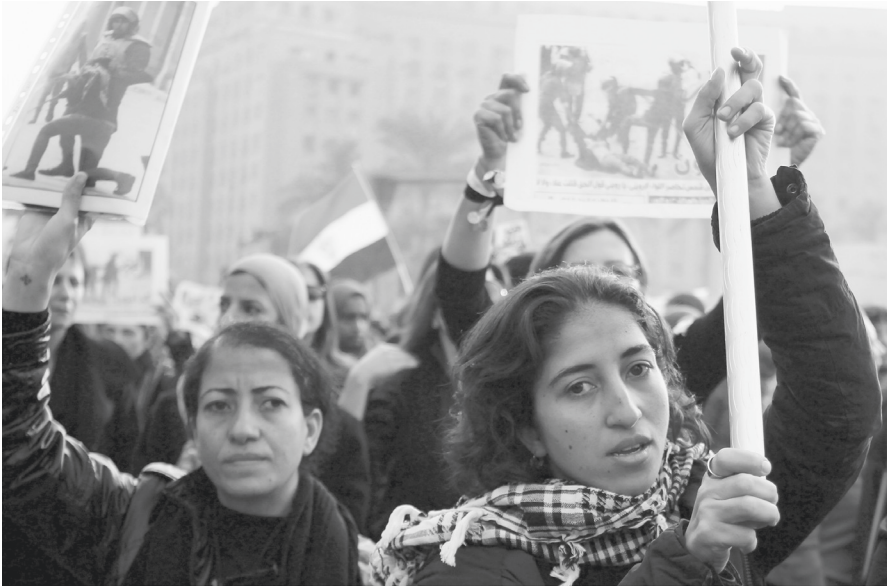
Abb. 2: Kairo, 20. Dezember 2011, Protestmarsch von Frauen zum Pressesyndikat, Foto: Aly Hazza'a.

Wirkmächtigkeit berichtender Fotografie begründete. 25 Wenn also einerseits die niedrige Auflösung – die insgesamt ‚schlechte‘ Qualität – des digitalen Bildes dessen permanentes Verschicken und Weiterleiten erst ermöglicht, so muss dieses Bild andererseits ästhetisch und technisch aufgewertet werden, sobald es in einem Printmedium, d.h. in einem ‚klassischen‘ Distributionsmedium, reproduziert wird.