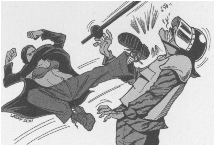
Abb. 5: Carlos Latuff: Masked Avenger , 11. Januar 2012.

anspielungen versehen: Auf dem Tahrir-Platz ist ein Graffiti zu finden mit dem Blue Bra als Element eines Superwoman-Kostüms (Abb. 4). Der brasilianische Karikaturist Carlos Latuff zeichnet eine Blue-Bra-Comicszene , die die Rache der Niedergetretenen imaginiert (Abb. 5). Es entstehen Wandmalereien im Stil von Märtyrerinnendarstellungen; der blaue BH taucht als Graffiti-Schablone auf – er ist zu einem Symbol geronnen, das den gesamten Kontext aufzurufen vermag. Es gibt zudem einen von Anonymous lancierten Hashtag #opBlueBra mit Solidaritätsbekundungen, Protestaufrufen und Memen, die die Verschleierung als Anonymous-Maske variieren und Maskeraden von User/innen mit blauem BH versammeln. 31 Während in solchen Bildverarbeitungen die Vorstellung einer weiblichen Ermächtigung artikuliert wird, die sich jenseits einer vermeintlich verletzligen Weiblichkeit und ihres paternalistischen Schutzes behauptet, gibt es auch Collagen, in denen der blaue BH auf die ägyptische Flagge montiert ist, als Einhebung der Frauenbewegung in die Nation. 32