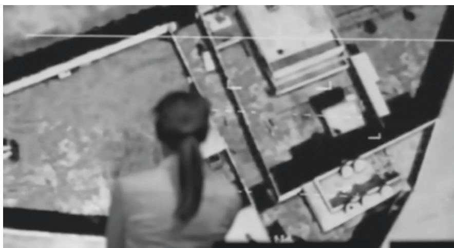
Abb. 1 und 2: Paranoia als affektiv-räumliche und sensorische Erfahrung in Zero Dark Thirty (Regie: Kathryn Bigelow, USA 2012). Siehe Tafelteil, S. VI.

uns die (zu) dunklen Bilder umso mehr den Eindruck einer intimen Sinneserfahrung gewinnen. In der Düsternis der Szenerie erlangen wir das Wissen über den gegebenen filmischen Raum gerade nicht durch die mit Hilfe der Nachtsichtgeräte erzeugte visuelle Transparenz – im Gegenteil: Die technisch herbeigeführte Durchdringung des finsternen Gebäudes im Modus eines Ego-Shooter-Videospiels und der grünliche Schein der Nachtsichtbilder lassen die Erwartung eines drohenden