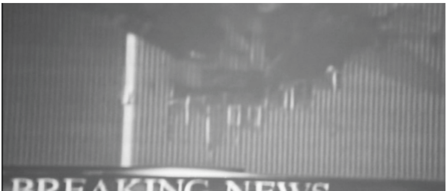
Abb. 3, 4 und 5: Indirekte Erfahrbarkeit und Ränder in United 93 (Regie: Paul Greengrass, F/UK/USA 2006). Siehe Tafelteil, S. VII.