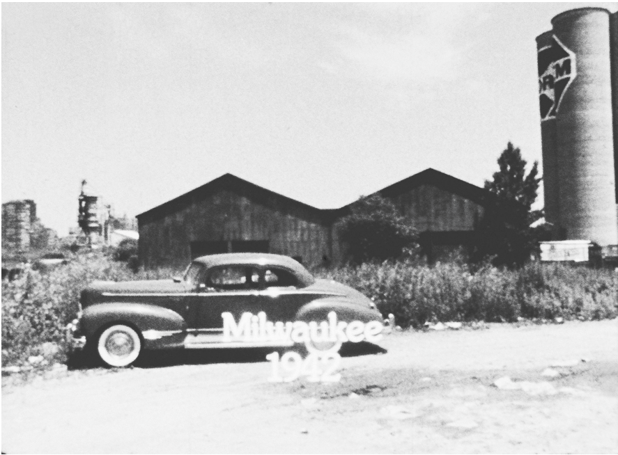
Abb. 1: Eine Montage, die sich als Schwenk verkleidet. Filmstill aus Him & Me (Regie: James Benning, USA/CA/BRD 1982).

vor einigen Jahren ähnlich: „Camera movement has generally been subordinated in filmmaking and film theory to editing as a way of changing camera viewpoint.“ 8 Die von Gunning und Bordwell, aber auch anderen Theoretikern 9 verzeichnete Lücke ist überraschend: Trotz einer gut einhundert Jahre langen Tradition der Filmtheorie gibt es kaum Untersuchungen zur Kamerabewegung. 10 Zwar kommen Theorien regelmäßig auf das allgemeine Bewegungsprinzip des Kinos zu sprechen, aber die existierenden Ausführungen operieren meist sehr weit weg von oder zu nah an der materiellen Praxis von Kamera, Stativ, konkreter Bild-Bewegung. Zu weit weg, wie in den allgemein-philosophischen Reflexionen zum Bewegungsbild ,