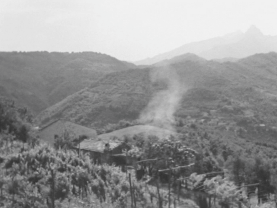
Abb. 8: Mikrogeschichten von Antizipation und Vergessen. Filmstill aus Fortini/Cani (Regie: Danièle Huillet/Jean-Marie Straub, I/UK/USA/F 1976).

panning, that we have to make an effort of recognition: only after a few moments we have already started to forget. 28