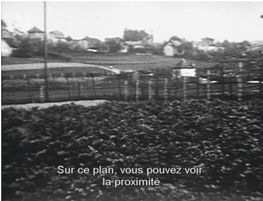
Abb. 5: Ethik und Evidenzproduktion: Samuel Fullers Schwenk. Filmstill aus Falkenau, vision de l'impossible (Regie: Emil Weiss, F 1988).