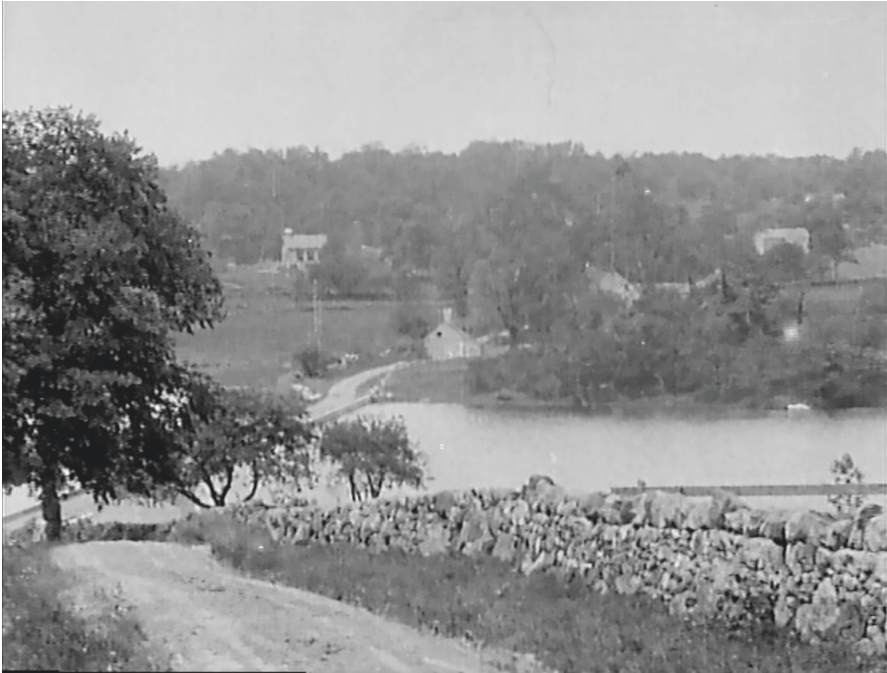
Abb. 3: Der Schwenk als Grundierung der fiktionalen Welt. Filmstill aus The Country Doctor (Regie: D.W. Griffith, USA 1909).