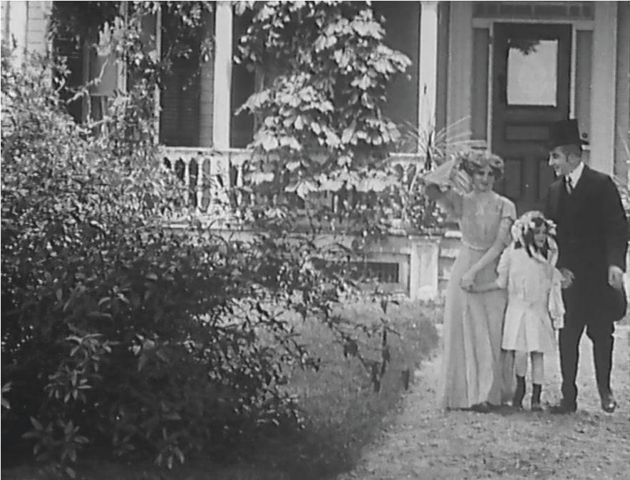
Abb. 4: Der Schwenk als Grundierung der fiktionalen Welt. Filmstill aus The Country Doctor (Regie: D.W. Griffith, USA 1909).

Mizoguchi Kenji, Ozu Yasujiro und Charlie Chaplin – als einen der „greatest documentary directors“ 14 bezeichnet, aber in der üblichen Filmgeschichtsschreibung wird seine Arbeit meist weit entfernt vom dokumentarischen Pol des Kinos verortet. Sein Name steht für die Entstehung eines Erzählkinos, in dem der narrativ-fiktionale Zusammenhang zwischen verschiedenen Einstellungen ins Zentrum und die dokumentarischen Anteile in den Hintergrund rücken. Zugleich (und damit eng verbunden) entsteht in den Jahren um 1910 eine vertikal integrierte ökonomische Struktur von Produktion und Rezeption, die fast vollständig um die Pole von Erzählung und Fiktion konstruiert ist. 15