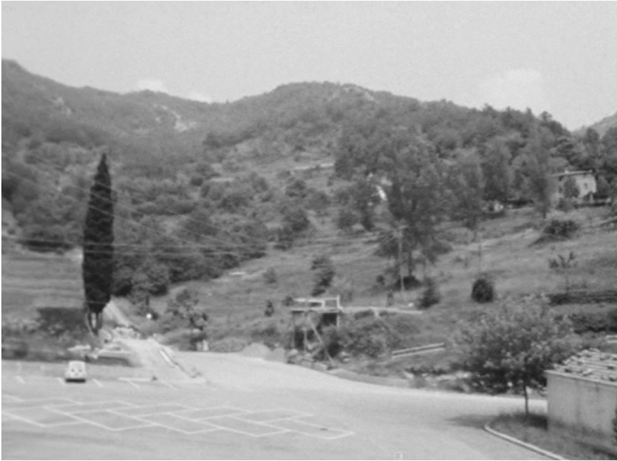
Abb. 7: Mikrogeschichten von Antizipation und Vergessen. Filmstill aus Fortini/Cani (Regie: Danièle Huillet/Jean-Marie Straub, I/UK/USA/F 1976).

scape of the Apennines near Florence in a series of slow, prolonged panning shots around places where the Germans massacred large numbers of Italian partisans during the Second World War, pretty landscapes where no trace can be seen now of the blood that once was spilled here. That blood may have left no mark in these places but the camera marks them with its deliberate panning, marks them but does not appropriate them, lets us know but lets them be, for people died in these places but people go on living here too. 27