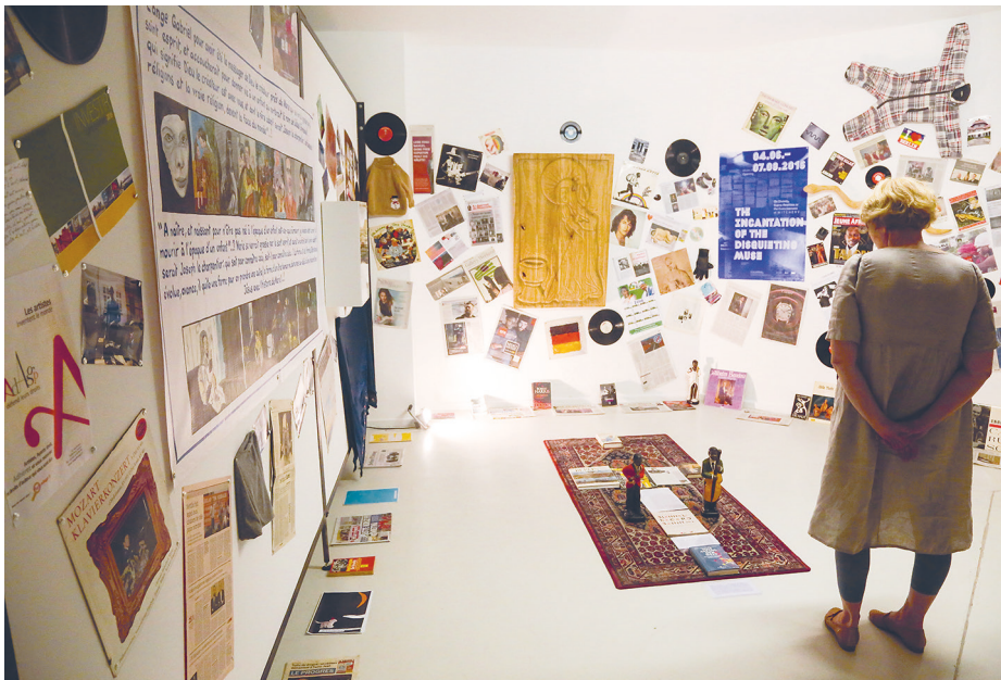
The Incantation of the Disquieting Muse. On Divinity, Supra-Realities or the Exorcisement of Witchery, Ausstellungsansicht, SAVVY Contemporary, Berlin, 2016

Barbara Gronau Vielen Dank für Ihr pointiertes Statement. Ich denke, es wäre zunächst einmal interessant, die Übertragung von Walter Mignolos Konzept des »epistemischen Ungehorsams« in das Feld der Kunst zu diskutieren. Es scheint, dass darin ein zentrales Selbstverständnis von SAVVY Contemporary besteht: Es geht einfach nicht nur darum, eine weitere Galerie in der Stadt