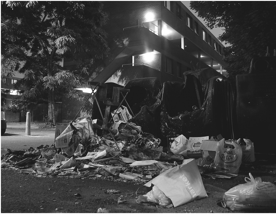
Douglas White: Ohne Titel, 2006, digitale Fotografie

Diese von Douglas White gemachte Aufnahme entstand am Abend seiner Begegnung mit den ausgebrannten Recycling-Containern.