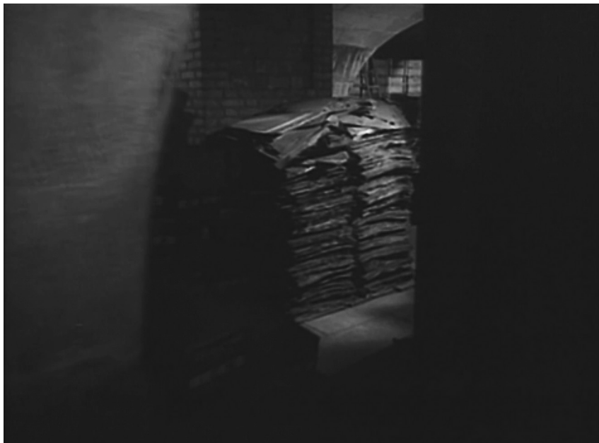
Filmstill aus Toute la mémoire du monde (Regie: Alain Resnais, F 1956)

dem Verhältnis von Wissen und Materialität ausdrücklich – ganz einfach, weil die gezeigte Materialität die einer Bibliothek und also auch eines Wissens ist. Oder wird mit der Materialität die Anfechtung eines Wissens in Szene gesetzt?