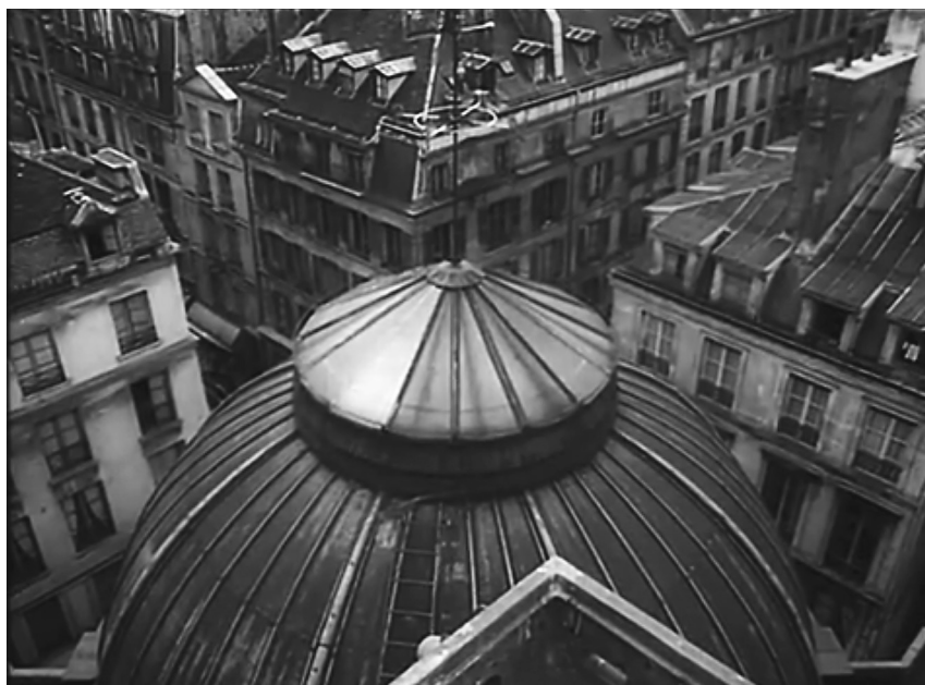
Filmstill aus Toute la mémoire du monde (Regie: Alain Resnais, F 1956)

Während Resnais offenbar an eine Angst der Menschen vor einer Materialität glaubt, die das Wissen gefährdet, verkehrt sich das Verhältnis zwischen Wissen und Materialität beim früheren Bibliothekar der abgefilmten Bibliothèque nationale, Georges Bataille, ins Gegenteil: Weil Menschen Wissen und Bibliotheken errichten, »um einer Bedrohung zu fliehen«, wie Bataille schreibt, und weil »jede Art von Eroberung sicher die Tat eines Menschen ist, der vor einer Bedrohung flieht«, sei auch die Flucht vor der eigenen Angst von vornherein zum Scheitern verurteilt. 16 Die Festung des Wissens werde demnach zum »Gefängnis« – schließlich halte man »in Paris die Wörter in der Nationalbibliothek gefangen«, wie der Film verkündet. Und tatsächlich zeigt der Film die Architektur der Bibliothek auch als panoptisches Gefängnis, mit Blicken durch Eisengitter, über die Wärterfüße gehen. Aus diesem Gefängnis gibt es kein Entrinnen, solange das spätere Leben der gefangenen Dokumente auf der Verdrängung seiner Ursprünge aufbaut, auf jenen »vollgestopften Kellerräumen«, die womöglich älter sind als die Bibliothek – auf jener Materialität, auf der das Wissen beruht.