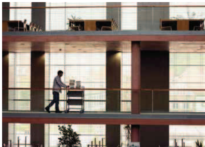
Anfangs übernahm der neue Kollege typische bibliothekarische Routinen, die er zuverlässig und gewissenhaft ausführte.

Nach Rücksprache mit der Personalabteilung der Hochschule und der sogenannten zuständigen Stelle in Gestalt der brandenburgischen Landesfachstelle für Archive und öffentliche Bibliotheken konnte im Sommer 2011 der Kontakt mit