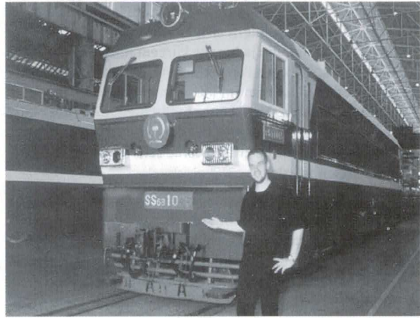
Die Abbildung zeigt eine elektrische Wechselstromlokomotive der Baureihe Shaoshan 6B, wie sie zur Zeit nach dem Stand der Technik in Zhuzhou gefertigt wird. Diese Triebfahrzeuge sind noch in konventioneller Wechselstrom-Gleichstromtechnik konzipiert.

Die Besonderheiten des chinesischen Marktes müssen ebenfalls berücksichtigt werden.