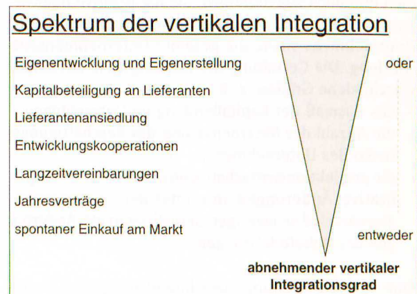
Abb. 1: Beispiele für Entscheidungsalternativen der Fertigungsstufenoptimierung 4

Entscheidungen über die Fertigungstiefe betreffen auf der einen Seite die betrieblichen Grundfunktionen Beschaffung, Produktion und Absatz. Aktivitäten in Richtung auf die Beschaffungsseite zu übernehmen bedeutet Rückwärtsintegration. So können Teilprodukte entweder selbst hergestellt oder über den Markt bezogen werden. Vorwärtsintegration beinhaltet dagegen die Übernahme von Aktivitäten auf der Absatzseite. Für ein Unternehmen ist die Leistungstiefe durch das Ausmaß bestimmt, in dem benachbarte Leistungsstufen, wie z. B. Fertigung und Montage von Vorprodukten, weitergehende Montage zu Endprodukten oder die Schritte bis zur Vermarktung und zum Kundendienst jeweils innerhalb eines Unternehmens erbracht werden. Die vorherrschende Leistungstiefe ist in den einzelnen Branchen durchaus unterschiedlich. Betriebe mit sehr hoher Leistungstiefe finden sich beispielsweise in der Stahl- und Chemiebranche. 3