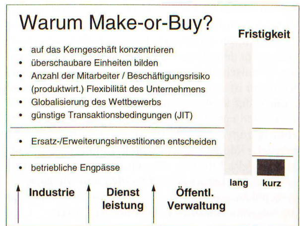
Abb. 2: Anlässe für Make-or-Buy Entscheidungen

Make-or-Buy Fragen können auch aus anderen konkreten Entscheidungsproblemen entstehen. Eine Entscheidung über Ersatz- oder Erweiterungsinvestitionen ist zu treffen. Unter Umständen kann es sein, daß sich die Entscheidungsträger gar nicht der Tragweite ihrer Entscheidung bewußt sind. Dann nämlich, wenn sie die Perspektive Make-or-Buy gar nicht in den Entscheidungsprozeß integrieren. Weiterer Handlungsbedarf entsteht beispielsweise im Rahmen der praktischen Produktionsprogrammplanung, wenn sich herausstellt, daß die existierenden Kapazitäten nicht ausreichen. Der letztgenannte Anlaß beschreibt die kurzfristig notwendige Wahl zwischen Eigenfertigung und Fremdbezug bei Vorliegen eines betrieblichen Engpasses. Die erstgenannten Fragen dokumentieren dagegen ausweislich die strategische Bedeutung der Make-or-Buy Fragestellung. 6