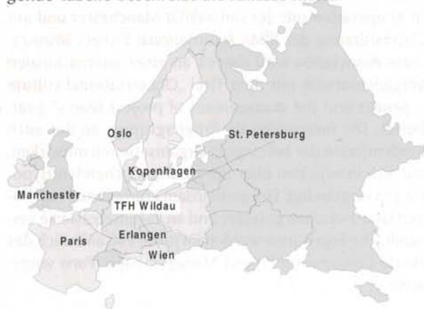
Abb. 3: Nationale und internationale Aktionsorte im Projekt FIPRO

Bild 3 zeigt die Aktionsorte im Überblick. Die nachfolgende Tabelle beschreibt die Anlässe näher.