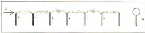
Abb. 3: Multielektroden-Längsanordnung

Im IPLT wurde der Weg über eine Entladungsanordnung gewählt, die von vornherein ein aktives Medium mit nahezu kreisrundem Querschnitt erzeugt. Es wird die Tatsache ausgenutzt, daß Entladungen, die zwischen zwei stiftförmigen Elektroden brennen, von vornherein eine Zylindersymmetrie aufweisen. Wegen der geforderten geringen Induktivitäten ist dabei die Länge der Entladung (Elektrodenabstand) auf wenige Zentimeter begrenzt, also zu klein, um eine ausreichende optische Verstärkung zu erreichen. Die Lösung besteht daher darin, elektrisch parallele Längsentladungen zwischen zwei Stiftelektroden optisch hintereinander anzuordnen. (vgl. Abb. 3)