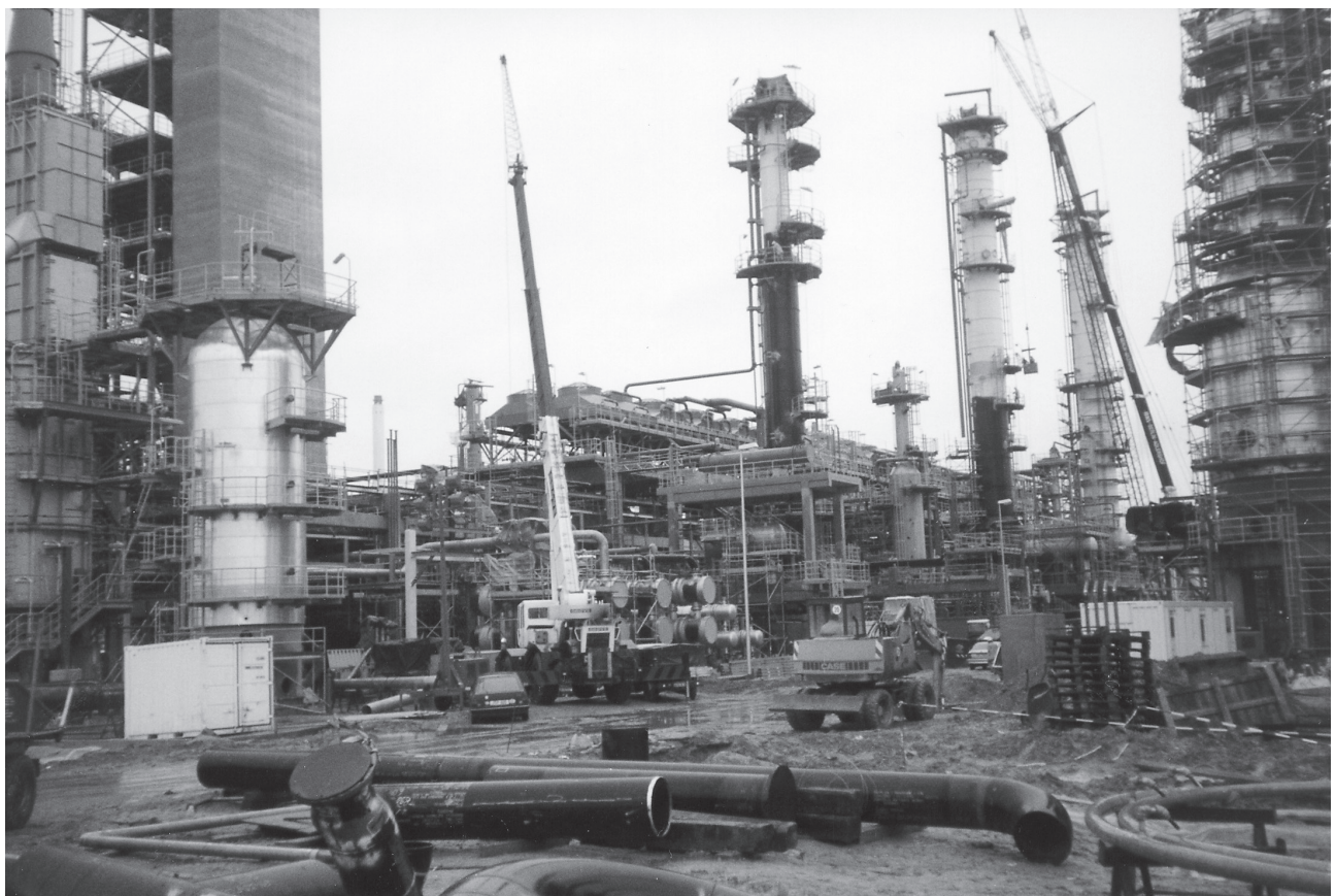
Abb. 3: Montagesituation, Baustelle Leuna 2000 (MIDER)