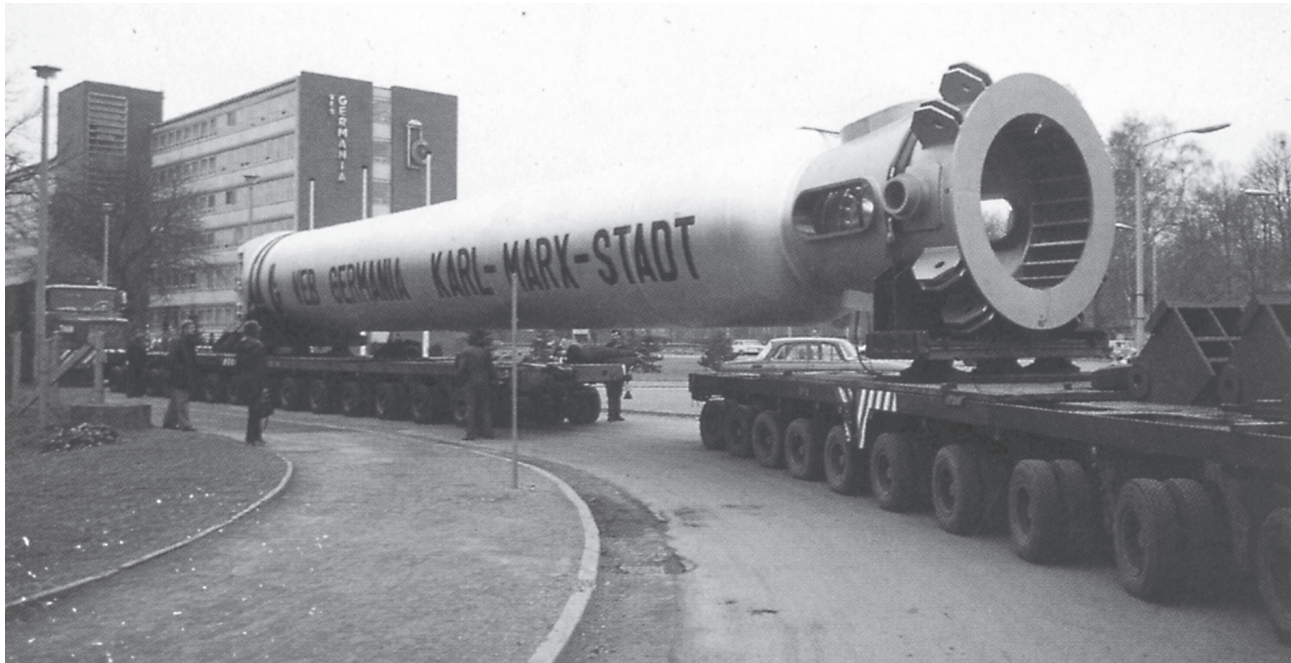
Abb. 4: Sonderlastfall „Montage“ (Transportbeanspruchungen der Montageeinheit)

Als Fazit ist festzustellen, dass die Montagegerechtigkeit von ihrem Inhalt her (relativ und auf eine rationelle Montage bezogen) für alle Produktentwicklungen zutrifft, von ihrem Erreichen her – aufgaben-, bzw. montageeinheitenbezogen – jedoch sehr unterschiedliche Arbeitsschritte notwendig sind. Die bereits 1955 von Bock [13] für das Konstruieren getroffene Definition: „... schöpferisches und lückenloses Vorausdenken eines technischen Gebildes, das den Forderungen des historisch bedingten Standes der technischen Entwicklung entspricht, und Schaffen aller zweckmäßigen Unterlagen für seine stoffliche Verwirklichung ...“ als auch die von Schuart [14] für die Projektierung: „... die gedankliche Vorwegnahme und Beschreibung eines technischen Systems zur optimalen Funktionserfüllung, unter Einhaltung der geforderten Nebenbedingungen und unter weitgehender Verwendung bekannter Elemente der zur Herstellung notwendigen technologischen Prozesse und der zu seiner Bewertung erforderlichen betriebstechnischen und ökonomischen Parameter ...“ beinhalten, dass die angestrebte Montagegerechtigkeit integraler Bestandteil bereits der ersten Überlegungen für eine Gestaltungslösung sein muss. Wie dies im Stufenprozess verfahrenstechnischer Anlagenentwicklung erfolgen kann, ist Inhalt eines weiteren Beitrages.