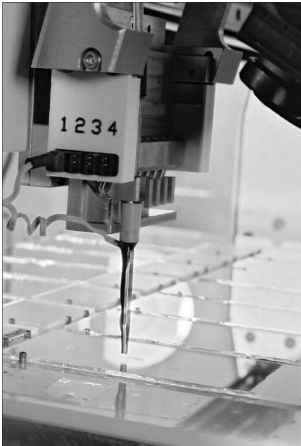
Spotter zur Beschichtung von Biochips auf der Basis von Glasträgern (FhG-IBMT)

tenten wurde im Biotechnologiepark Luckenwalde mit EU-Fördermitteln realisiert, um Facharbeiter für die Unternehmen in der Region zu qualifizieren. Damit konnte eine Lücke in der Ausbildungskette geschlossen werden, die mit InnoRegio-Mitteln nicht realisierbar war.