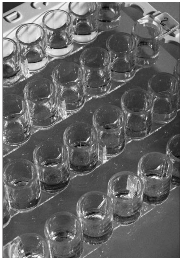
Ein Vorteil des Einsatzes von Biosensoren und Biochips besteht in der Messung einer großen Anzahl von Proben und geringen Probenvolumina (CONGEN GmbH).

In der Phase II wurden ab Sommer 2002 neue Projekte generiert, die weitere Ansätze für die Integration von Nachweisverfahren auf einer Sensoroberfläche bieten