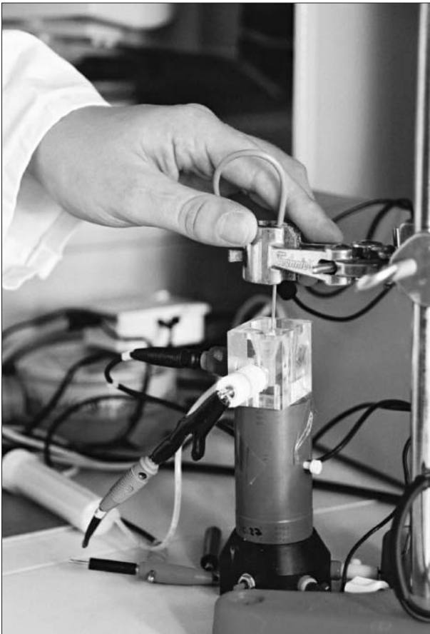
Sensormesszelle an der Universität Potsdam