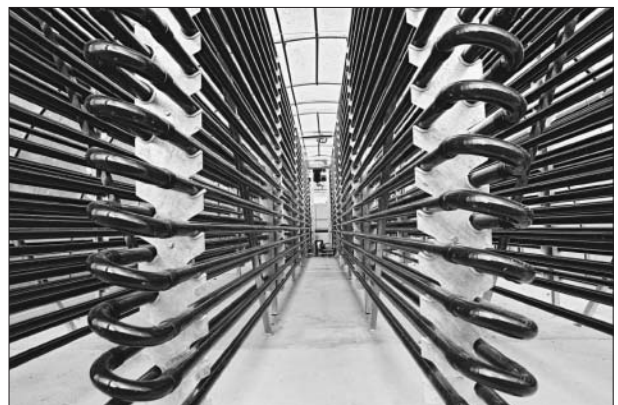
Produktionsanlage zur Gewinnung von Wirksubstanzen aus Algen; die Charakterisierung der Wirksamkeit erfolgt mit Biosensorchips (IGV GmbH).

So wurden im Netzwerk weitere Projekte für die Region eingeworben, die das InnoRegio-Konzept unterstützen. Das ursprünglich als Teil der Ausbildungsinitiative entwickelte Projekt einer Ausbildung zum Biologischen Assis-