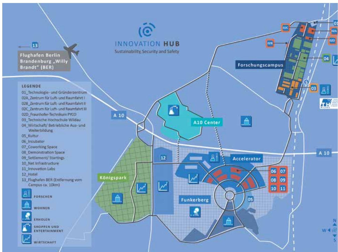
Abb. 1) Innovation Hub Funkerberg

Im Ergebnis lässt sich feststellen, dass die überwiegende Zahl der untersuchten 32 Standortfaktoren, die den Bereichen (1) Wirtschaft, (2) Architektur und bauliches Umfeld, (3) Naturraum und räumliche Lage, (4) Kultur und öffentlicher Raum, (5) Verkehrs- und Dateninfrastruktur, (6) Arbeitsmarkt und Sozialstruktur/Bildung zugeordnet wurden, nach Auffassung von Experten und zugrundeliegenden Studien bereits gegenwärtig gut ausgeprägt sind. Es konnten zahlreiche Stärken und Chancen identifiziert werden, was für die erfolgreiche Etablierung eines Innovation