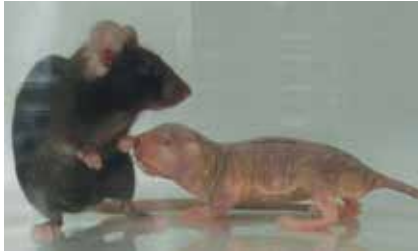
Abb. 1) Abbildung eines Nacktmulls (rechts) im Vergleich zu einer Hausmaus (aus Edrey et al. 2011)

Der Nacktmull ist ein in unterirdischen Bauten lebendes afrikanisches Nagetier mit einigen sehr interessanten biologischen Eigenschaften, weshalb er seit geraumer Zeit bereits als Forschungsobjekt in unterschiedlichen Fachgebieten eingesetzt wird: