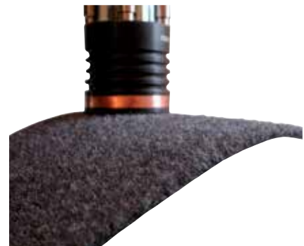
Abb. 4) Hydroadhäsionsgreifer

zwischen textilen Bauteilen sowie der Kontaktfläche des Greifers durch Gefrieren eines Wirkmediums. Die entstehende hydroadhäsive Verbindung ermöglicht hohe Haltekräfte ohne zusätzliche Verspannungen im Textil zu bewirken. Gerade diese Eigenschaften werden in der Konfektionstechnik von Greifsystemen gefordert, da die Textilien mit ihrer großen Fläche bei kleiner Bauteildicke biegeschlaff sind und flächig gegriffen werden müssen.