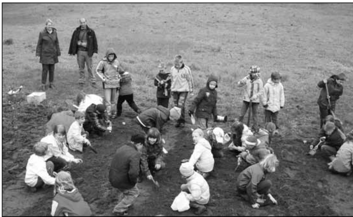
Wie tief muss denn nun eine Kartoffel in die Erde, damit fünf bis zehn neue wachsen? – Die Schüler der Grundschule in Groß Schönebeck können das jetzt im neuen Schulgarten selber ausprobieren.