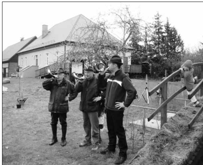
Jagdhornklänge an der Waldschule „Jägerhaus“ in Groß Schönebeck – links im Bild sieht man die Vogelkirsche, den „Baum des Jahres“, der später eingepflanzt wurde.