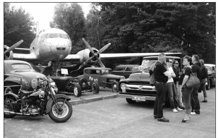
Roadrunners Paradise 2010 – im Juni gibt's wieder knatternde Motoren im Luftfahrtmuseum Finowfurt zu erleben.

museum immer besser. Und der kleine Ort Finowfurt wird einmal mehr über die Grenzen Deutschlands hinweg bekannt gemacht.