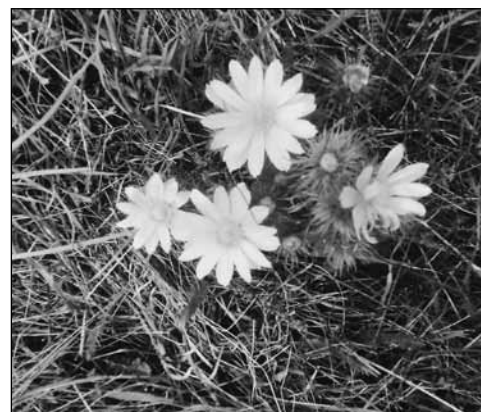
Adonisröschen in Lebus – die Seniorinnen der Begegnungsstätte in Finowfurt konnten die Blüten auf ihrer Tagesfahrt im April live bewundern.

Finowfurt. Die Seniorinnen der ProCurand Begegnungsstätte Finowfurt fuhren am 24. April nach Frankfurt/Oder. Zu Beginn unserer Tagesfahrt besuchten wir die Marienkirche und konnten dort die herrlichen Fenster bewundern. Das Mittagessen nahmen wir im Oderturm in der 24. Etage ein. Weiter ging es nach Lebus zu den Polderwiesen, um die Adonisröschen zu bewundern. Die Bustour ging weiter durch gepflegte Orte bis nach Zollbrücke. Dort bekamen wir Kaffee und Kuchen. Das Theater „am Rande“ von und mit dem Schauspieler Thomas Rühmann konnten wir besichtigen. Wer Glück hatte sah auch den Schauspieler.