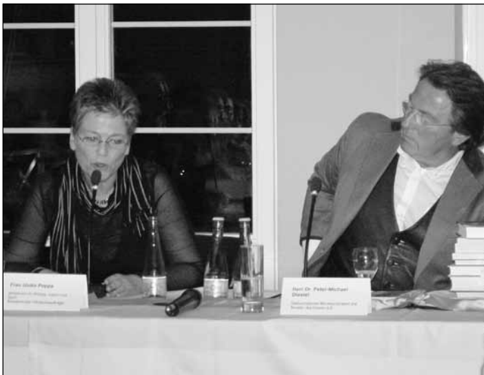
Die Beauftragte des Landes Brandenburg zur Aufarbeitung der Folgen der kommunistischen Diktatur, Ulrike Poppe, und Dr. Peter-Michael Diestel, der 1990 der letzte Innenminister der DDR wurde, bei den ersten „Schorfheider Kamingesprächen“ am 23. April 2010 im „Café Wildau“.