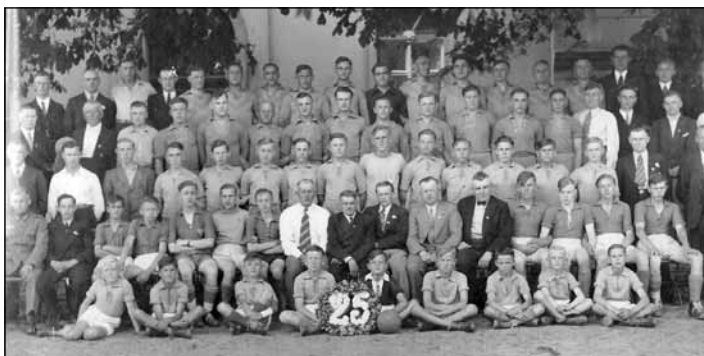
Aus vergangenen Planet-Zeiten – der FC Planet Finowfurt im Jahr 1936. Heute suchen die Fußballer des 1. FC Finowfurt nach dem Grund ihrer damaligen Namensgebung.