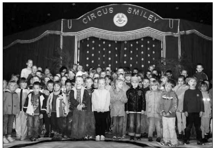
Voller Aufregung: die Kinder der Grundschule Groß Schönebeck beim ersten Besuch im frisch aufgebauten Zirkuszelt am Montagmorgen.

Dann komm doch einfach mal vorbei und schau dich um! Fifu-Club • Spechthausener Straße 5 • 16244 Schorfheide