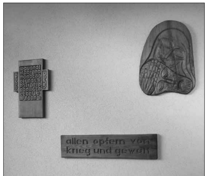
Gedenktafeln für alle Opfer von Krieg und Gewalt – diese wurden unter dem Glockenturm in Altenhof angebracht und Ende April eingeweiht.