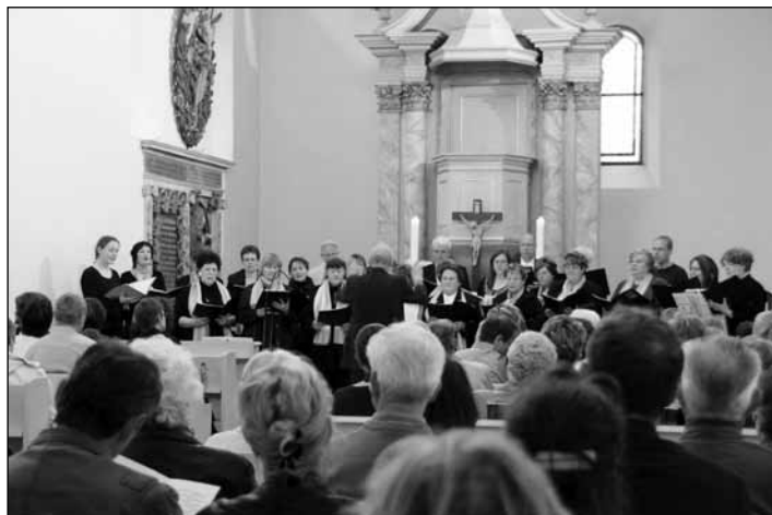
10 Jahre Lichterfelde Kirchenchor - Zum Jubiläum gab der Chor ein Konzert in der Lichterfelder Kirche vor über 150 Besuchern.

gebracht wurden. Auch der Kinderchor begeisterte mit einem Ausschnitt aus seinem diesjährigen Frühlingsprogramm. Zwei Lieder aus dem Film „Die Kinder des Monsieur Mathieu“ sowie das Lied „In Gottes Hand geborgen“ wurden mit voller Konzentration und viel Gefühl vorgetragen. Kleine und große Instrumentalsolisten vervollständigten den bunten musikalischen Frühlingstrauß mit Akkordeon, Klarinette, Trompete, Klavier und Orgel. Als besondere Überraschung überreichten Mitglieder des Kirchenchores ihrem Chorleiter ein Banner mit dem frisch entworfenen Logo des Chores. Eine Freude für die Chormitglieder waren auch die Glückwünsche der Gemeinden des Pfarrbezirks. Mit zwei Abendliedern verabschiedeten sich die Mitwirkenden nach einem etwa 90-minütigen Programm von ihrem dankbaren Publikum – und das wunderschöne Abendlied „Der Tag, mein Gott, ist nun