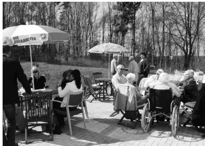
Herrliches Frühlingswetter zum Tag der offenen Tür bei den Johannitern in Althof. Bewohner und Gäste genießen die Sonne auf der hauseigenen Terrasse.

Althof. Am 17. April 2010 präsentierte sich das „Betreute Wohnen der Johanniter“ der Öffentlichkeit. Gleichzeitig wurde jene Veranstaltung genutzt, um das einjährige Bestehen der Einrichtung ein wenig nachzufeiern. Viele Gäste haben diese Gelegenheit genutzt um das Haus, sowie einige Leistungen von Kooperationspartnern kennenzulernen. Es stellten sich unter anderem das Sanitätshaus Koepe und der Optiker und Hörakustiker Ortler vor. Das herrliche Wetter an diesem