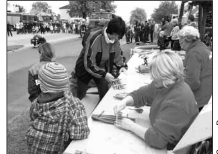
Vielfalt auf dem Heimattfest Finowfurt - Während die Jugendfeuerwehr zeigte, wie man einen Brand richtig löscht, bauten Andere mit dem Finowfurter Flößerverein ihr eigenes Floß miniatur.

aus, dass Finowfurter für Finowfurter in Aktion waren. Kinderschminken, Kistenkletterer, Zielangler, Tennisspieler, Handballtorwerfer, Floßbastler, Sägemeister und Hexe „Pixelpax“ sorgten für Kurzweil. Die