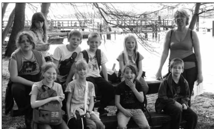
Klassenfahrt an den Werbellinsee – die Klasse 4a der Schule Finowfurt genoss das Areal des Schullandheimes Joachimsthal für sich allein.