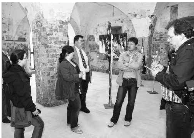
Die Ausstellung im Refektorium greift die besondere Atmosphäre des Ortes mit dem Titel „Engelgeflüster“ auf. Zu den Besuchern der Schau gehörten auch Journalisten aus dem Märkischen Kreis, die Mitte Juli bei uns im Landkreis weilten.

Uhr und von 13:00 bis 17:00 Uhr geöffnet. Bis zum 13. September 2009 zeigen Berufskünstler des Landkreises gemeinsam mit Künstlerkollegen aus Raciborz und Naklo (Polen) und dem Märkischen Kreis (NRW) ihre Interpretationen des Themas und präsentieren dabei alle Genres der Bildenden Kunst. (tho)