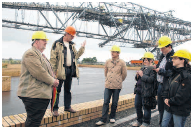
Großen Eindruck machte auf die Gäste aus Nordrhein-Westfalen die Abraumförderbrücke F60 in Lichterfeld-Schacksdorf.