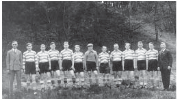
Jugendkreismeister 1935 - VfB Klettwitz

Für die gute Jugendarbeit des VfB Klettwitz von seiner Gründung im Jahre 1913 bis heute sollen stellvertretend die beiden nachfolgenden Fotos stehen. Sie zeigen den Jugendkreismeister von 1935 und den Kreispokalsieger der A/B-Junioren von 1995. Immerhin liegt zwischen beiden Aufnahmen ein Zeitraum von 60 Jahren.