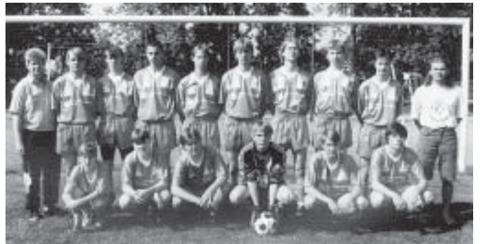
Kreispokalsieger der A/B-Junioren 1994/95 - VfB Klettwitz