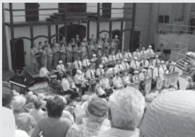
Gelungener Auftritt des Volkschores Schipkau e. V. im Amphitheater am Senftenberger See am 26.05.2003 beim Treffen der Chöre der Region vor voller Kulisse.

Ziel: EuroSpeedway Lausitz, Parkplatz Welcomecenter