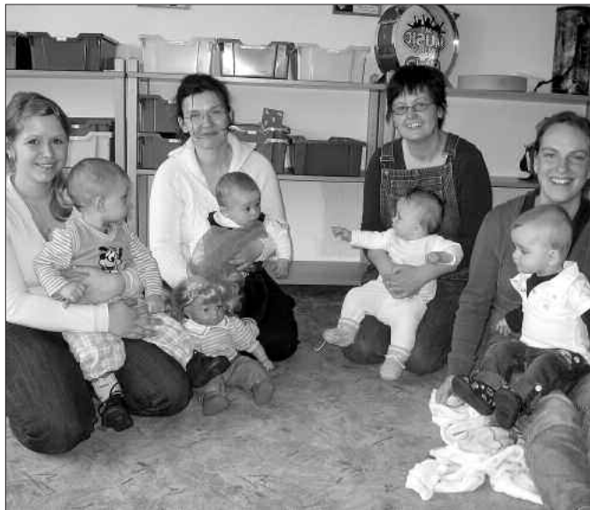
Baby-Musikgartengruppe im Kindergarten „Flax & Krümel“ Herzberg