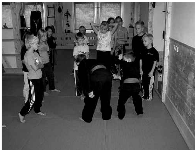
In den Trainingsgruppen lernen Kinder nicht nur etwas, sondern können auch neue Freundschaften schließen.

In den Herbstferien veranstaltet der Kuroi – Tora – Kampfsportverein e. V. aus Elsterwerda ein Selbstbehauptungstraining für Kinder und Jugendliche. Der dreitägige Kurs bringt den Teilnehmern grundlegende Verhaltensweisen für ein richtiges Verhalten in einer Not-situation bei. Hierfür wird der richtige Umgang geübt: Wie soll ich mich verhalten wenn ich von fremden Personen angesprochen werde? Welche Möglichkeiten hat das Kind um Hilfe zu rufen? Der Schulweg oder der Weg zu den Freunden liegt in der kalten Jahreszeit meist schon oder noch im Dunkeln. Von großer Sorge begleit-