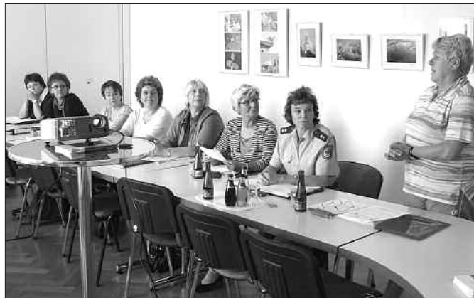
Die erste Sitzung des neuen Gremiums fand interessierte Zuhörer bei der Darstellung der Situation der Frauen im Landkreis.

Zu den Schattenseiten der Geschlechterverhältnisse gehört die häusliche Gewalt. Sie ist für Frauen das größte Sicherheitsrisiko. Mit der Schaffung der Struktur - Kooperationsgremium Häusliche Gewalt - will der Landkreis Elbe-Elster Frauen und Kinder engagiert unterstützen, schützen und sie darin stärken, ein Leben ohne Gewalt und Angst zu führen und ihre Rechte wahrzunehmen. Es geht auch darum, so viele Menschen wie möglich zu ermutigen, sich nicht mit der Gewalt abzufinden, sondern einen aktiven Schritt zu ihrer Vermeidung und Bekämpfung zu machen, das Thema im öffentlichen Bewusstsein besser zu verankern und Betroffenen Zuflucht zu gewähren. Dazu fand am 8. September 2008 die erste Sitzung des Kooperationsgremiums „Häusliche Gewalt - Opferschutz und Opferhilfe“ im Landkreis Elbe-Elster statt. Vertreter aus den verschiedensten Institutionen werden nun in gemeinsamer Zusammenarbeit