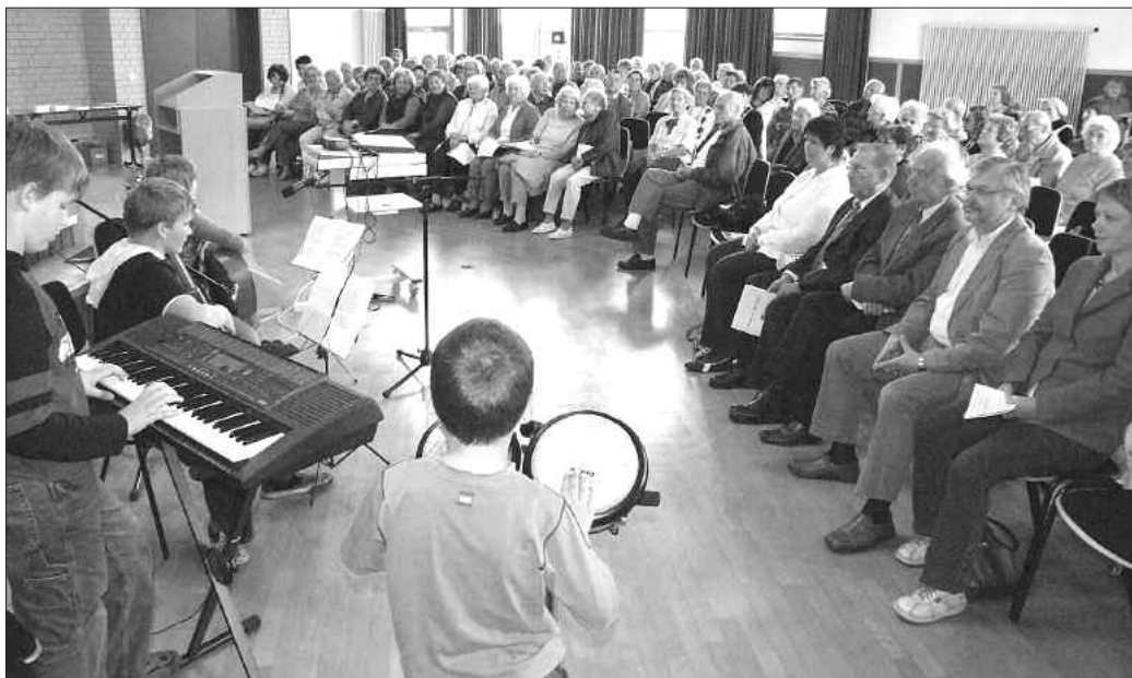
Der Vortrag am Jubiläumstag des neuen Semesters lautete: „Anti Aging oder die hohe Kunst des Älterwerdens“. Rund 150 Zuhörer kamen in die Aula der Oberschule nach Finsterwalde