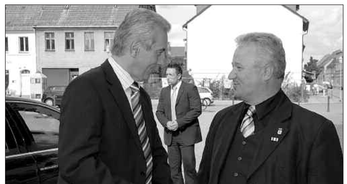
Empfang des sächsischen Regierungschefs vor dem Herzberger Rathaus: Bürgermeister Michael Oecknigk (r.) begrüßt Stanislaw Tillich (l.).

„Elbe-Elsteraue“ teil. Erörtert wurden u. a. die Bedeutung der Bundeswehr am Standort Schönewalde-Holzendorf für die Region und Chancen für eine bessere Verkehrsanbindung an der Grenze zum Nachbarland Sachsen. Mit Blick auf die ersehnte Autobahn A16 Leipzig-Herzberg-Cottbus sagte Stanislaw Tillich: „Die A16 sollten wir uns trotz erster Ablehnung nicht aus der Hand schlagen lassen. Nicht zuletzt mit Blick auf den Warenaustausch mit Osteuropa wird die Verbindung gebraucht.“ (tho)