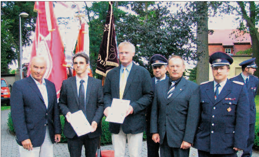
Die Feuerwehren der Stadt Doberlug-Kirchhain und des Amtes Elsterland erfüllen nun gemeinsam die Aufgaben im Brand- und Katastrophenschutz. Außerdem sind sie als Stützpunktfeuerwehr in der Lage, eine Förderung von 50 Prozent für die Neuanschaffung von Technik zu erhalten.