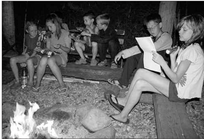
Wurden mit Begeisterung aufgenommen - die allabendlichen Lagerfeuer-Geschichten mit Gruselcharakter.

Der Kuroi-Tora-Kampfsportverein e. V. veranstaltete eine Woche lang ein Trainings- und Sommercamp für seine Kinder im Alter von 7 bis 12 Jahren. Das Training im Kampfsport stand genauso auf dem Programm wie das Baden. Man kann doch beides miteinander verbinden. Das Training bei dieser Hitze in das Wasser zu verlagern fand somit sehr großen Zuspruch. Mit Begeisterung wurden die allabendlichen Lagerfeuer-Geschichten mit Gruselcharakter wahrgenommen und förmlich von den Kindern verschlungen. Natürlich wurden auch kleinere Exkursionen gemacht, so zum Beispiel zum Stellwerk der DB-AG nach Elsterwerda. Hier hatten die Kinder die Möglichkeit, Weichen zu stellen und Wissenswertes über die Tätigkeit zu erfahren. Auf dem Rückweg ging es dann noch bei der Polizei in Elsterwerda vorbei.