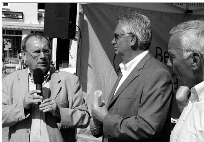
Landrat Klaus Richter am BBI-Infostand auf dem Marktplatz Finsterwalde im Gespräch mit Flughafenpressesprecher Eberhard Elie und Bürgermeister Johannes Wohmann (v. l. n. r.).

Bis dahin bleibt noch einiges zu tun. Unter anderem geht es um eine vernünftige Verkehrsanbindung des Flughafens für die Menschen im Landkreis-