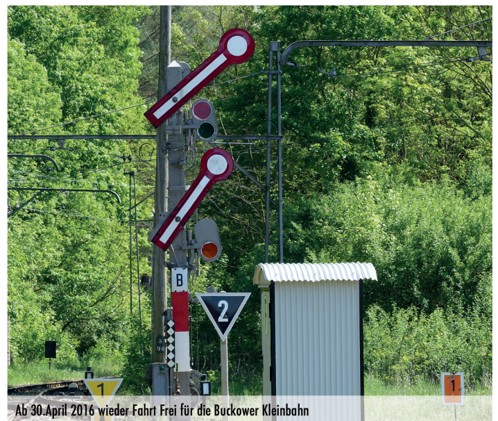
Ab 30.April 2016 wieder Fahrt Frei für die Buckower Kleinbahn

Helmut Krüger Museumsbahn Buckower Kleinbahn -Öffentlichkeitsarbeit-