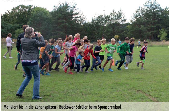
Motiviert bis in die Zehenspitzen - Buckower Schüler beim Sponsorenlauf