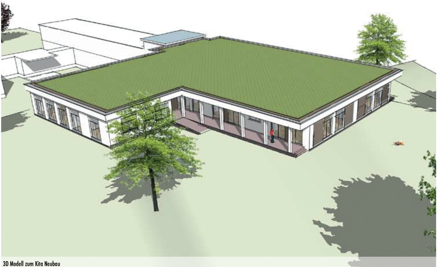
3D Modell zum Kita Neubau