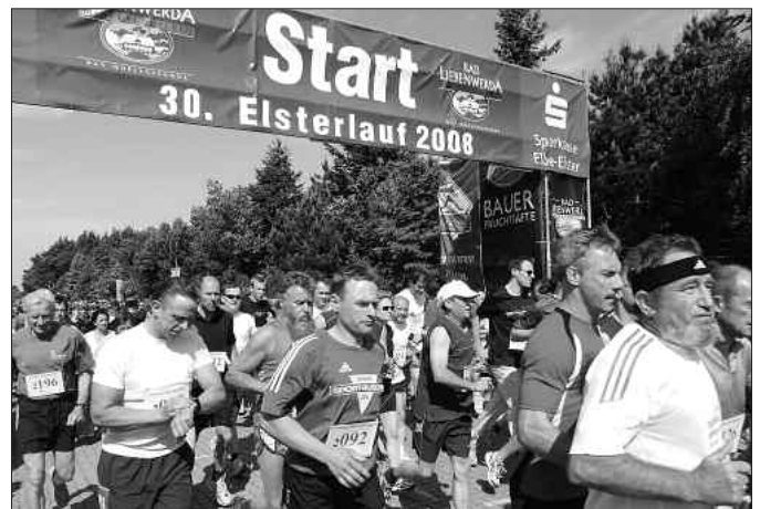
740 Läuferinnen und Läufer gingen an den Start des 30. Elsterlaufs in Bad Liebenwerda.

Der traditionelle Elsterlauf erlebte in diesem Jahr seine 30. Auflage und war eingebettet ins 777. Stadtjubiläum und das 16. Brunnenfest der Mineralquellen Bad Liebenwerda. (tho)