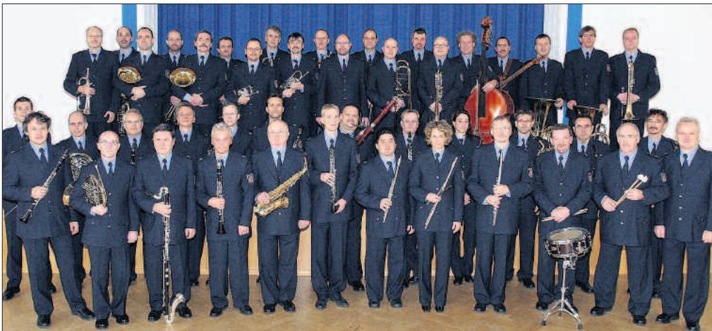
Das Landespolizei-Orchester Brandenburg spielt beim Tag der offenen Tür der Kreisverwaltung in Herzberg auf. Im Gepäck haben die beliebten Musiker ein breites Repertoire vom Schlager bis zum Swing im Big-Band-Sound.