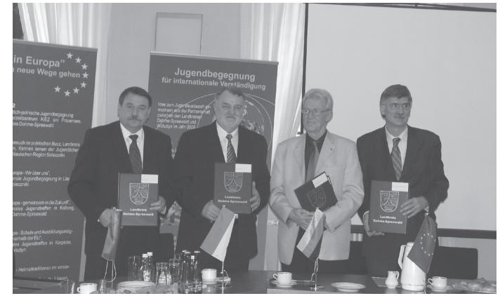
Vertragsunterzeichnung sichert weitere Jugendbegegnungen

Am 3. Dezember 2007 unterschrieben die Landräte aus Dahme-Spreewald, aus dem polnischen Wolsztyn und aus dem litauischen Soleczniki im Landratsamt in Lübben eine Vereinbarung über weitere gemeinsame Jugendbegegnungen bis zum Jahr 2010. Die Jugendtreffen werden weiterhin in Partnerschaft mit der Stiftung „Großes Waisenhaus zu Potsdam“ stattfinden.