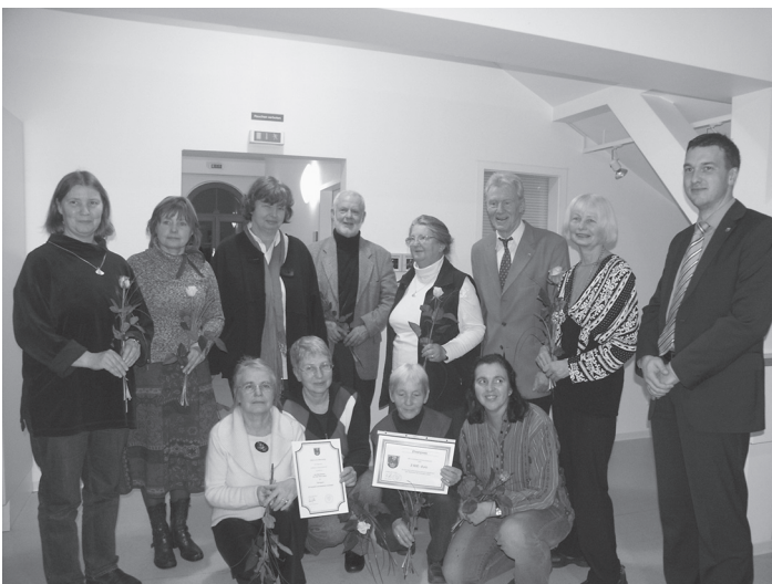
Das Team des Eine-Welt-Ladens freute sich über die besondere Ehrung

Die Würdigung im Ehrenamt erfolgt laut Beschluss des Kreistages im Wechsel mit der Auszeichnung von Menschen für Zivilcourage und der Verleihung des Umweltpreises und ist mit 2.500 Euro dotiert. Anschließend nutzten die Gäste die Gelegenheit, sich den nahe gelegenen Eine-Welt-Laden anzuschauen.