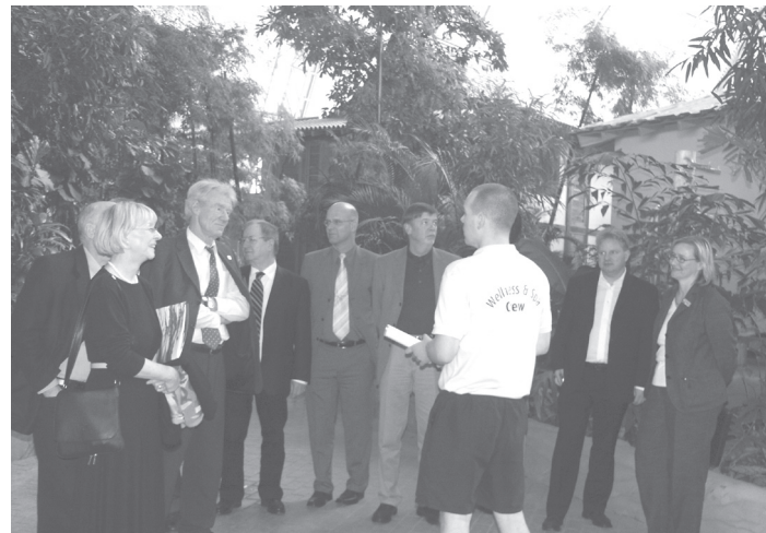
Rundgang durch die beeindruckende Saunalandschaft von Tropical Islands