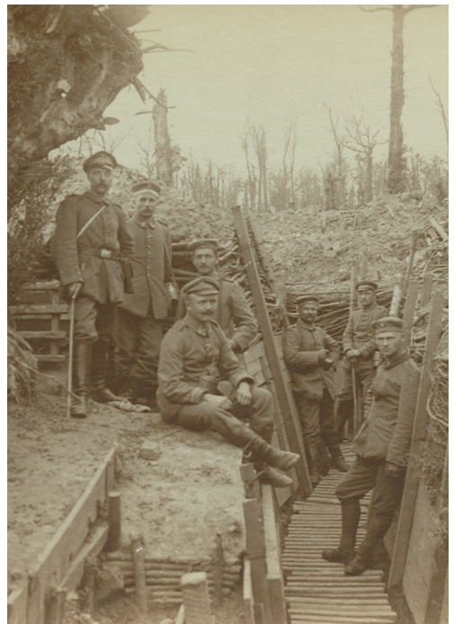
Soldaten im Schützengraben, September 1916, ohne Inv.-Nr.