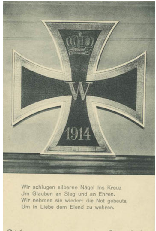
Postkarte des Eisernen Kreuzes vom Brandenburger Tor, 1915, Ernst Eichgrün, FS 14788

cke überwiesen, das Mädchenerziehungsheim „Marthasheim“ erhielt 600 Mark, 1.000 Mark wurden für Weihnachtsbescherungen in Lazaretten ausgegeben. 1.500 Mark sollten in Weihnachtsgeschenke für Kinder aus Kriegerfamilien investiert werden, da die Teuerung vor allem Kriegerfamilien und die ärmere Bevölkerung betraf. 47