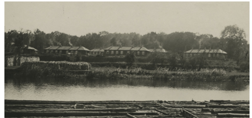
Blick auf die Siedlung Vorderkappe, um 1920, FS 14976-8

Um der weiterhin akuten Wohnungsnot entgegen zu wirken, baute die Stadt Holzhaussiedlungen an der Vorderkappe. 51