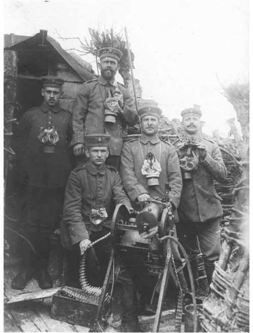
Soldaten im Schützengraben, unbekannter Fotograf, 1914-1918, ohne Inv.-Nr.