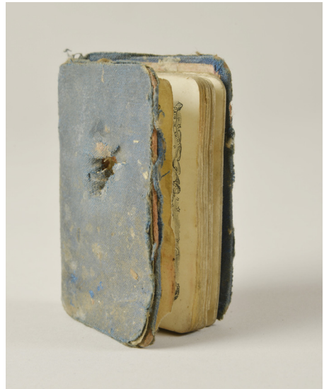
Französisches Andachtsbüchlein mit Durchschuss, 1914-1918, SD-2014-11

55 Siehe eine Aktennotiz zum Weihestein auf dem Luftschiffhafengelände. „Einweihung: 15.Mai 1927“, vgl. StA Potsdam, 1-9/400, Bl. 161.