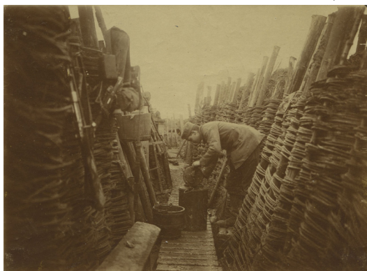
Der Schützengraben bedeutete Schutz und Geborgenheit – hier im Bild eine beinahe „idyllische“ Szene: Deutscher Soldat im Schützengraben, Februar 1915, ohne Inv.-Nr.