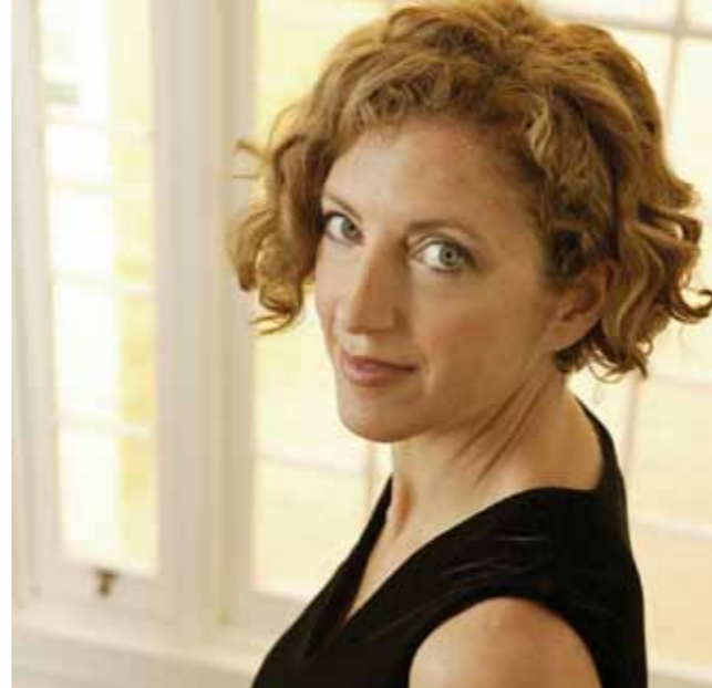
Die Autorin Joanna Murray-Smith