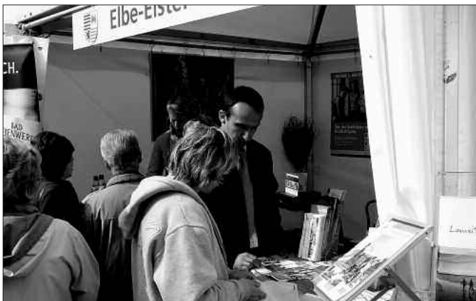
Besucher informieren sich über sehenswerte Ausflugsziele in der Region.