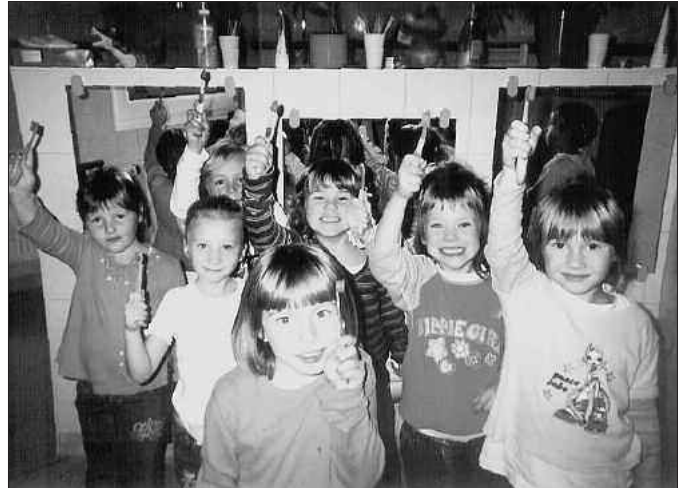
Kinder der Kita „Schlaumäuse“ machen Zahnbelag mit einer Färbelösung sichtbar

der und Schulkinder, die lustig und kindgerecht auf das wichtige Thema Zahnhygiene hinwiesen. (tho)