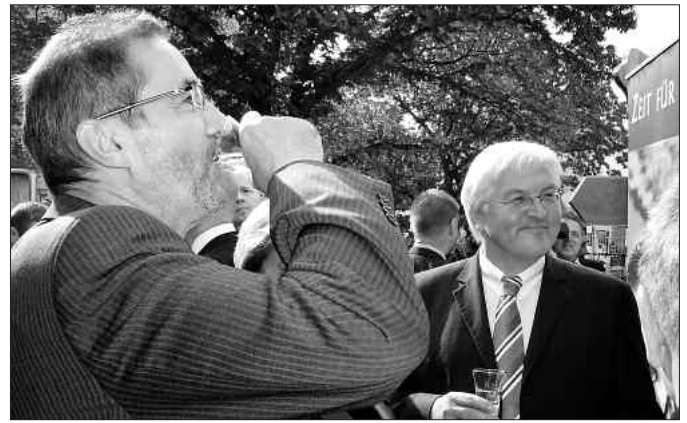
Politprominenz am Elbe-Elster-Stand: Matthias Platzeck und Frank-Walter Steinmeier kosten einheimische Getränkespezialitäten.