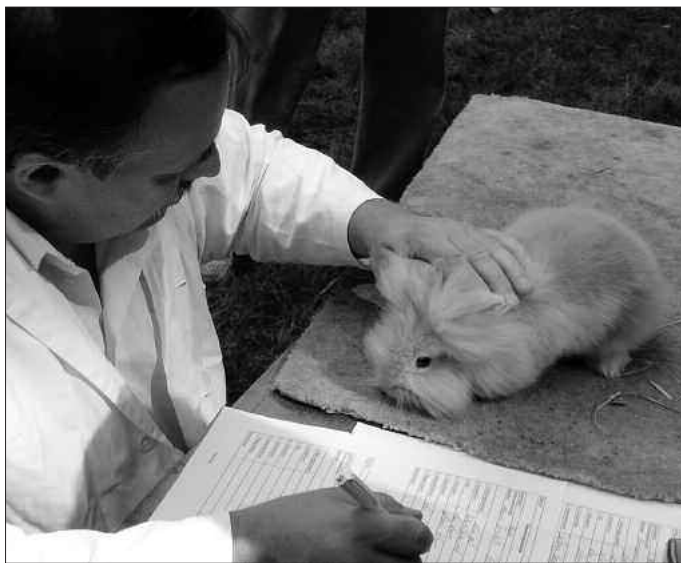
Bei der Bewertungsschau der „Elsterperle“ werden die Tiere kritisch von Preisrichtern betrachtet und die erbrachten Zuchtleistungen entsprechend bewertet.

Am 27. und 28. Oktober 2007 veranstaltet der Kleintierzuchtverein „Elsterperle“ die Kreisschau des Rassegeflügels des Altkreises Bad Liebenwerda und seine traditionelle vereinsinterne Ortsschau der Rassekaninchen auf dem Vereinsgelände in Elsterwerda-Biehla.