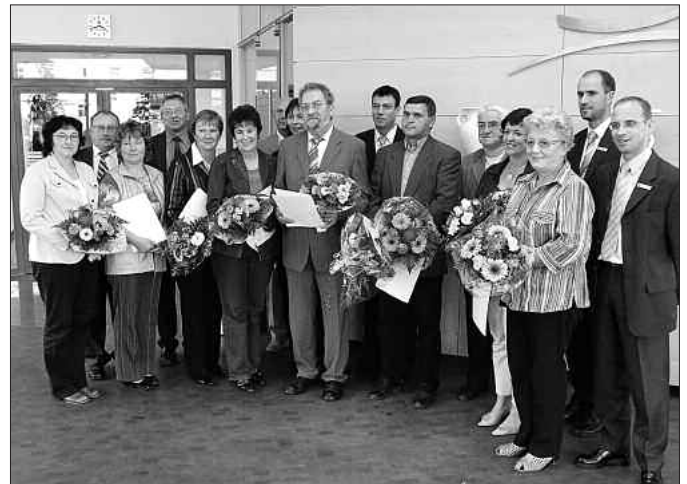
Die Preisträger 2007 auf einen Blick

Sie beteiligen sich kontinuierlich am Projekt für die Instandsetzung einer Schule und übernahmen Patenschaften für 134 Schulkinder für 5 Jahre in Sri Lanka.