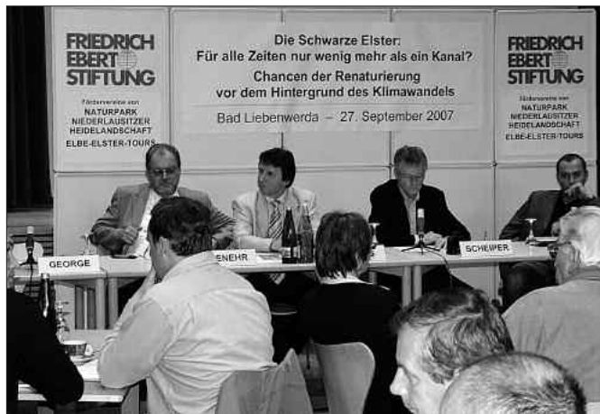
1. Schwarze-Elster-Konferenz lockte gut 90 Gäste ins Bürgerhaus

Jahren bis teilweise Anfang der 80er Jahre waren an vielen brandenburgischen Flüssen wie Spree und Havel ausgedehnte Frühjahrsüberschwemmungen allgegenwärtig. Ausbau, Errichtung von Poldern und Stauregulierungen haben die Schwankungsamplituden dieser Fließgewässer verringert.