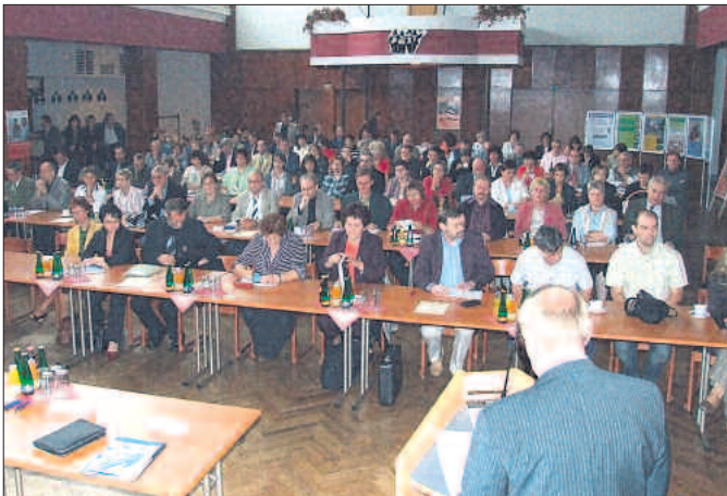
Blick in den Konferenzraum, in dem bis abends an neuen Konzepten gefeilt wurde.