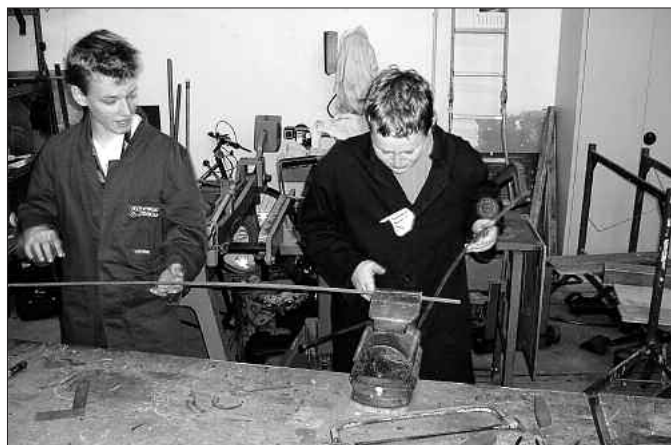
Früh übt sich: Schüler der Klassen 7a und 7b der Oberschule Falkenberg probierten sich an ihrem ersten Projekttag zum Beispiel in der Metallbearbeitung aus und stellten Schrauben und Nägel her.

Klassenleiterinnen der Kl. 7a/b, Oberschule Falkenberg