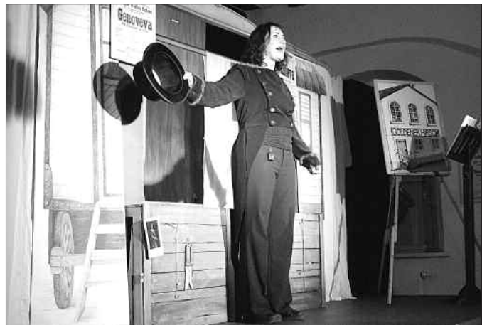
"Genoveva", dargebracht vom "Ambrella-Theater" aus Hamburg, gab Einblicke in die Entstehungsgeschichte des Wandermariionettentheaters.