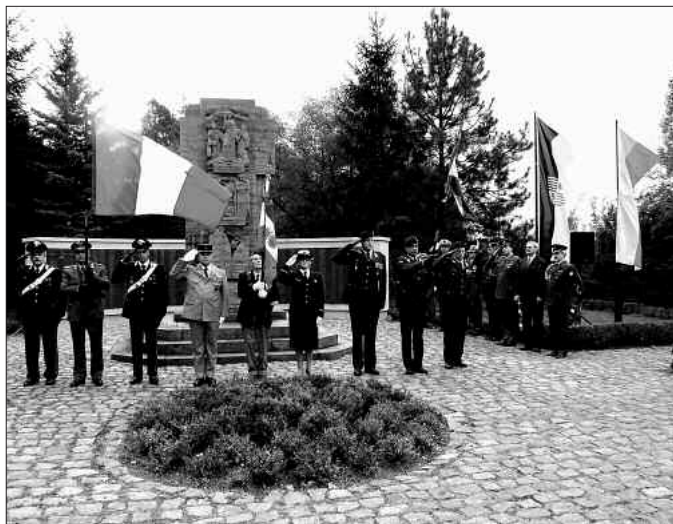
Mit den jeweiligen Landesfahnen und dem Abspielen der Nationalhymnen haben die internationalen Gäste Aufstellung vor dem Denkmal genommen. Die Soldaten und Veteranen erwiesen der Trikolore die Ehrenbezeichnung.