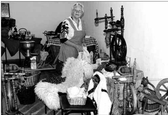
Gleich an mehreren Spinnrädern wurde gezeigt, wie Schafwolle gesponnen und danach gestrickt wird.