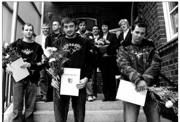
Abschiedsfoto vor dem Ausbildungsbeginn an der Kreisvolkshochschule.

kann. Er wünschte allen Kursteilnehmern einen erfolgreichen Lehrabschluss. (hf)