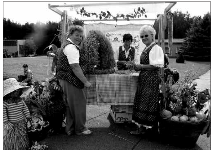
Die Röderländer Landfrauen an ihrem Verkaufsstand.