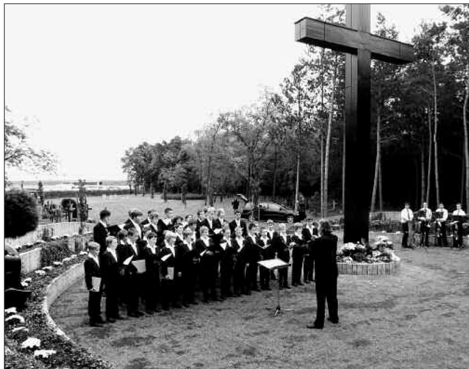
Gedenkfeier für die Opfer des ehemaligen Kriegsgefangenenlagers und späteren Speziallagers Nr. 1 des sowjetischen NKDW bei Mühlberg